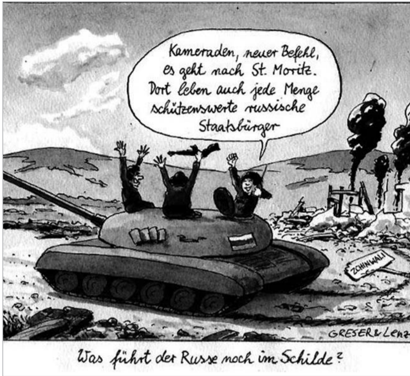
“ფრანკფურტერ ალგემეინე”. 25 აპრილი - კიდევ რას აპირებს რუსი: ამხანაგებო, ახალი ბრძანება. საბჭო მორიცში მივდივართ. იქაც ბევრი დასაცავი რუსეთის მოქალაქე ცხოვრობს.

რამ უბიძგა სააკაშვილს, “ავანტიურისტს საქართველოს პრეზიდენტის პოსტზე” (ნიკოლოზ სვანიძე - FAZ-თან ინტერვიუში) გადაეცა ნაბიჯები კატასტროფისკენ - “ამაზე პასუხს დოქტორანტი გაცემენ ოცდაათი წლის შემდეგ” - პასუხობს ერთი დიპლომატი FAZ-ს. შიგულთან ინტერვიუში აღმოსავლეთ ევროპის ექსპერტი კლაუს ზეგბერსი თვლის, რომ “საკაშვილმა ვერ გათვალა”. მიუხედავად საქართველოსადმი სიმპათიისა ზეგბერსი კითხულობს - “ხომ არ შეიძლება ვინმეს ჰქონდეს ინტერესი, ნატოში ისეთი ქვეყნების შემოყვანისა, რომლებმაც ყოველ კვირა ერთი კონფლიქტი შეუძლიათ ატომური ბომბის მფლობელ ქვეყნებთან წამოიწყონ.”