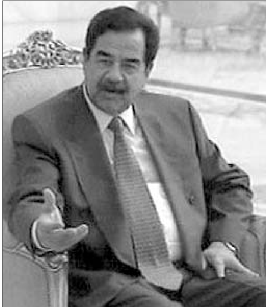
გაერო-ში და აშშ-ში სადამ ჰუსეინი დაიმორჩილეს - დიდი ხნით?