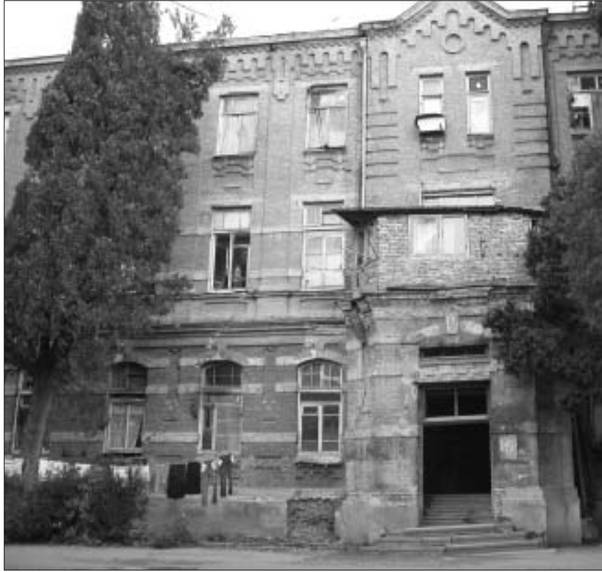
ასე გამოიყურება პირველი კლინიკური

პირველი კლინიკური საავადმყოფოს (ი.წ. „არამიანცის“) ერთ-ერთი კორპუსში, თავის დროზე, დევნილები რომ შესახლდნენ, ეს შენობა ვერ კიდევ მაშინ იყო დასანერგე. ექიმებს დევნილები გაუფრთხილებიათ, მანც ცხოვრება ძალზე საშიშიაო. თუმცა, უსახლკაროდ დარჩენილი ხალხი აქ აღნიშნულ ცხოვრობს. ამასობაში ზოგმა ბინა იყიდა და წავიდა, მათი ადგილი კი სასწრაფოდ სხვებმა დაიკავეს. ამჟამად კორპუსში 65 ოჯახია. ეს შენობა მინისძვრამდეც ისე გამოიყურებოდა, შიგნით შესვლის შეუძლებლობა. არავის ეგონა, მინისძვრას თუ გადაურჩებოდა. კორპუსი კი გადარჩა, მაგრამ შემონახვაზე მისულმა მშენებლობის სამინისტროს კომისიამ გარდადებ შეხვედრაც კი მესაძრე კატეგორიის ავარიულია მიიჩნია და იქ მცხოვრებლებს ურჩია, სასწრაფოდ გასახლებულიყვნენ. ლტოლვილთა და განსახლების სამინისტრომ მათ რამდენიმე ადგილას შესთავაზა თავსუსფარი, მაგრამ დევნილებმა იქ გადასვლაზე უარი განაცხადეს.