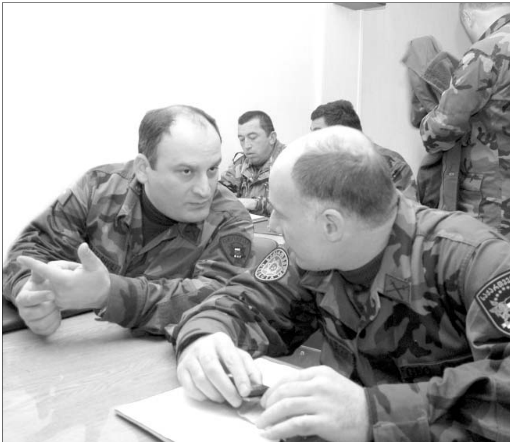
რამდენიმე გინდა ითვალე. ქარისთვის ფული არ არის.

დამოუკიდებლობის მეთერთმეტე წელს საქართველოში ჭერ კიდევ ეძებენ პასუხს ამ კითხვაზე