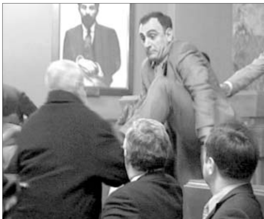
პარლამენტის ავტორიტეტი ისევ ჩინიხს.