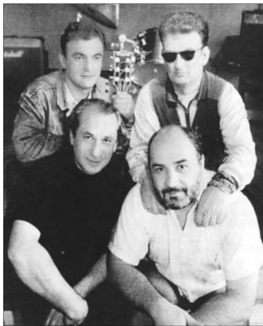
T.Blues Mob-ის ეს ფოტო დანიურ გაზეთში გამოქვეყნდა.

დისკო "პარლემ დევიდსონის" ფესტივალზე ჯგუფის წლებანდელი