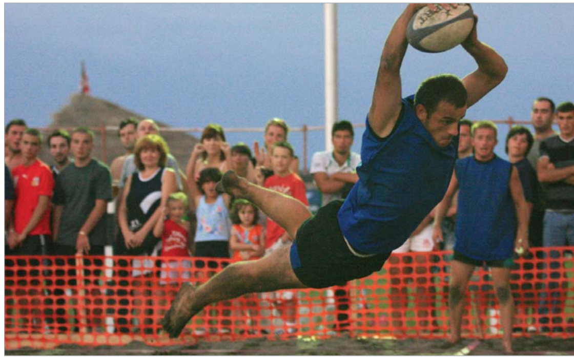
თავდაცვის სამინისტროს ბიჭებმა არაერთი ლაშაზი ლელო დადეს და მოყვარულებს შორის მეორე ადგილიც დაიკავეს

პროფესიონალები: "ლოკო-მოტივი" (თბილისი), "ლელო" (თბი-