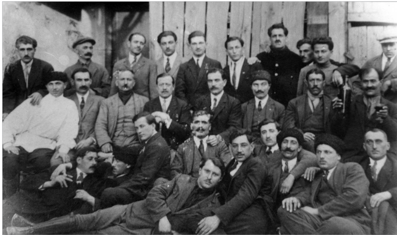
1924 წლის აჭანყების მთავარი შტაბის წევრები