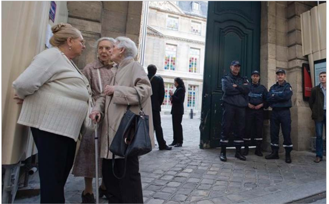
პიკასოს მუზეუმის შესასვლელთან

მეტროს პირველი ხაზი, გაჩერება "სან პოლ", მერე რამდენიმე პატარა და მოზრდილი ქუჩა უნდა გადაკვეთო. ეს პარიზის ერთ-ერთი უძველესი უბანია. პარიზელებს რომ უგდოთ ყური, უკვე მეთორმეტე საუკუნეში დაწყებულია მისი განაშენიანება,