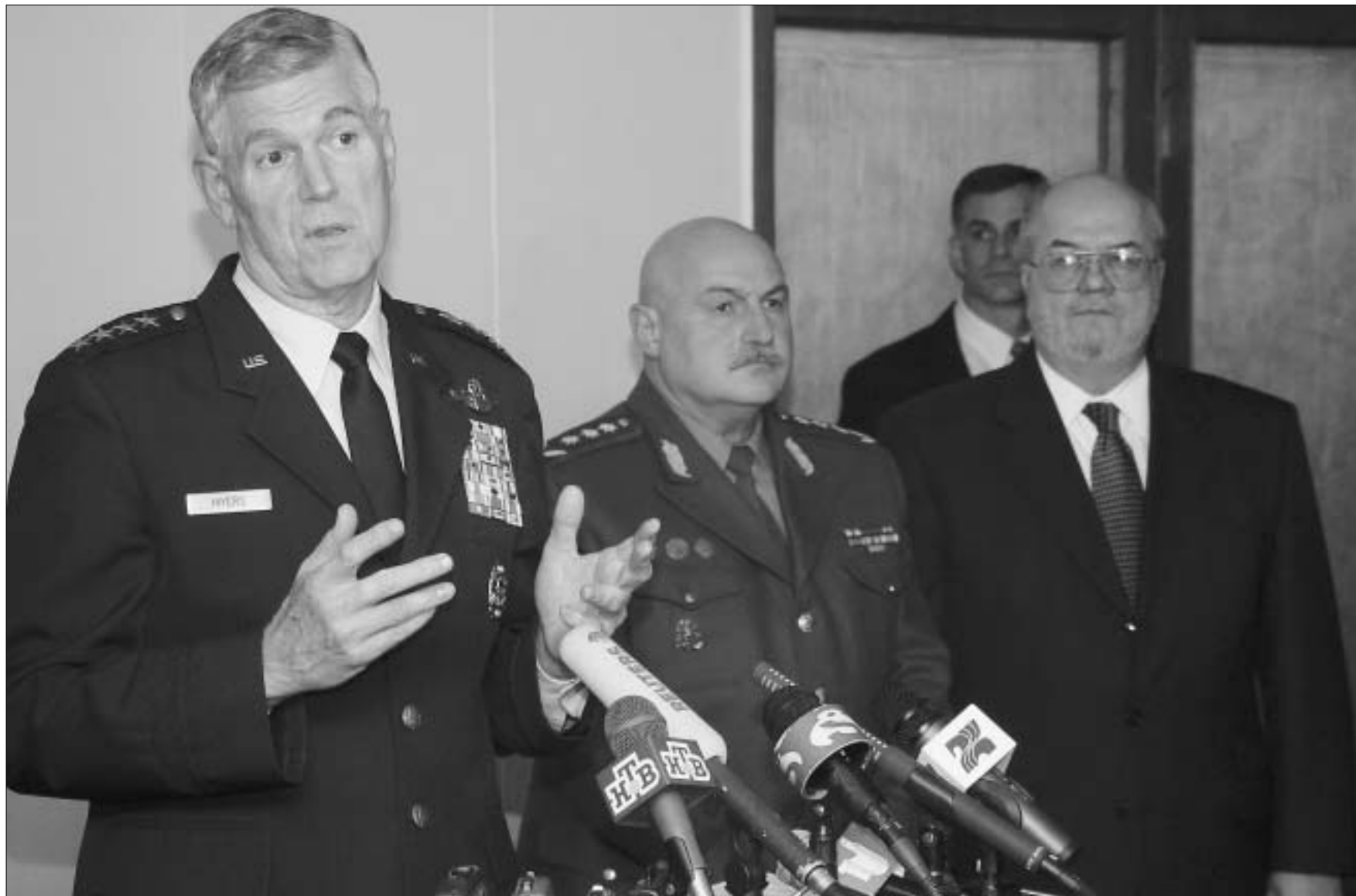
რიჩარდ მაიერსი კანკლარიაში გამართულ ბრიფინგზე

პრალის სამიტთან რამდენიმე დღეში, საქართველოში სტუმრად ამერიკის შეერთებული შტატების გაერთიანებული შტატების თავმჯ- დომარე, ოთხგარკვლავიანი გენე- რალი რიჩარდ მაიერსი ჩამოდის. ამერიკაში ყველაზე გავლენიანი გენე- რალს საქართველოს თავდაცვის მი- ნისტრის მოწვევა, დიდი ხანია, მიღე- ბული ჰქონდა, თუმცა, პრალის სამი- ტის შემდეგ, სადაც შევარდნაძემ ნა-