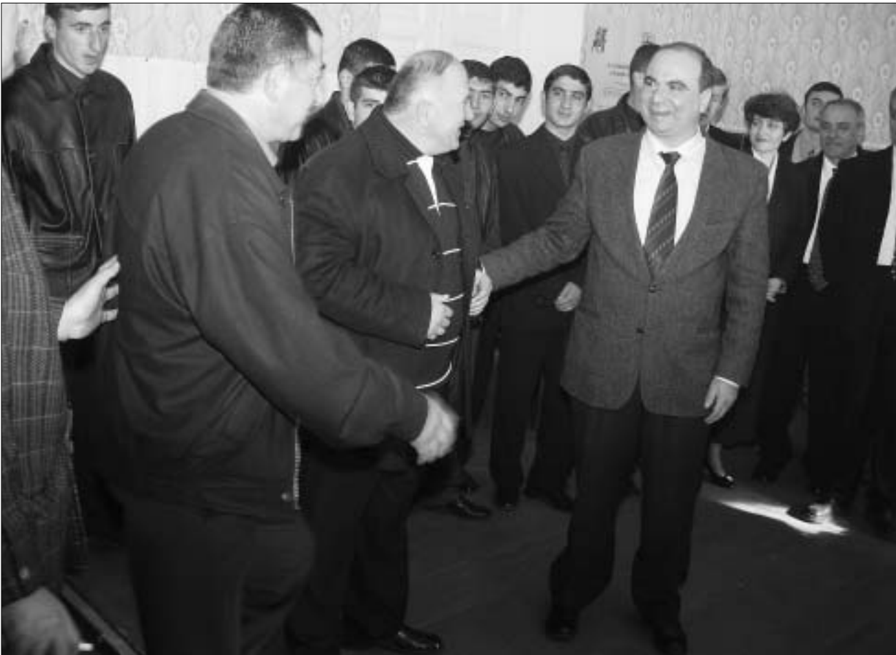
ზურაბ ჟვანია ახალქალაქში

უმიედობა – აი, ეს არის თანამედროვე ჯავახკი“, როგორც მას ადგილობრივი სომხები უწოდებენ. თუმცა, ხანდახან, აქ მხატვარ შოეიკ რაისიანის გამოფენაზე და ადგილობრივი პოპ-ვარსკვლავის ერიკ დენსის კონცერტზეც შეიძლება წასვლა, რომელიც, მინუს ხუთ გრადუსამდე გაყინულ ახალქალაქის თეატრში ტარდება ხოლმე. ერთი სიტყვით, ჯავახეთში ყველა პირობა შექმნილი იმისათვის, რომ ადამიანმა მხოლოდ და მხოლოდ ამ სახელმწიფოდან თავის დაღწევაზე გაქცევაზე ან სეპარატიზმზე იფიქროს. აქ არასოდეს გამართულა არჩევნები, თუნდაც, თბილისური გაგებით, მმართველ პარტიას, აქამდე გამართულ ყველა არჩევნებზე ხმების 99,9 პროცენტი გარანტირებული ჰქონდა. ამიტომ, გასულ შაბათს, სამცხე-ჯავახეთში „გაერთიანებული დემოკრატიის“ რაიონული ორგანიზაციის დამფუძნებელ კონფერენციანზე, „გდ“-ს ლიდერის ზურაბ ჟვანიას ვიზიტმა ახალქალაქლებში უდიდესი ინტერესი გამოიწვია, მით უმეტეს, რომ „გდ“-ს ადგილობრივ ლიდერად, ჯავახეთის ერთ-ერთი გავლენიანი კლანის წარმომადგენელი, მეღვირაისიანი იქნა არჩეული. იგი ადგილობრივი ბაზრის გაზით, ნავთითა და ბენზინით მთავარი მომმარაგებელია და ფლობს პატარა სასტუმროს. ჯავახეთში ძლიერ პოლიტიკურად ჯავახეთი, „მოქცავირთან“ ერთად, კვლავ რჩება სახალხო მოძრაობა „ჯავახკი“ , რომელიც 5000-მდე წევრს ითვლის. „24 საათს“ საშუალება მიეცა, გასაუბრობდნენ „ჯავახკის“ დღევანდელ და ყოფილ თავმჯდომარეებს ნორიკ კარაპეტინსა და არარატ კარამიანს და გაეგო, როგორ წარმოუდგენიათ მათ ჯავახეთი მომავალი საქართველოს შემადგენლობაში.