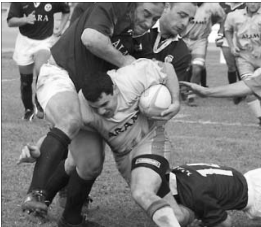
დათვებმა პროვანსი ვერ გადათელეს

თქვენი და ბურგუნდის მატჩის ვიდეოჩანაწერი და გარკვეული დასკვნები აჭარის გუნდზეც გამოვიტანეთ. ბუნებრივია, ამ გუნდს ლორესტეც აქვს და ნაკლებად, რამდენადაც ხვალ გამოიყენებთ.