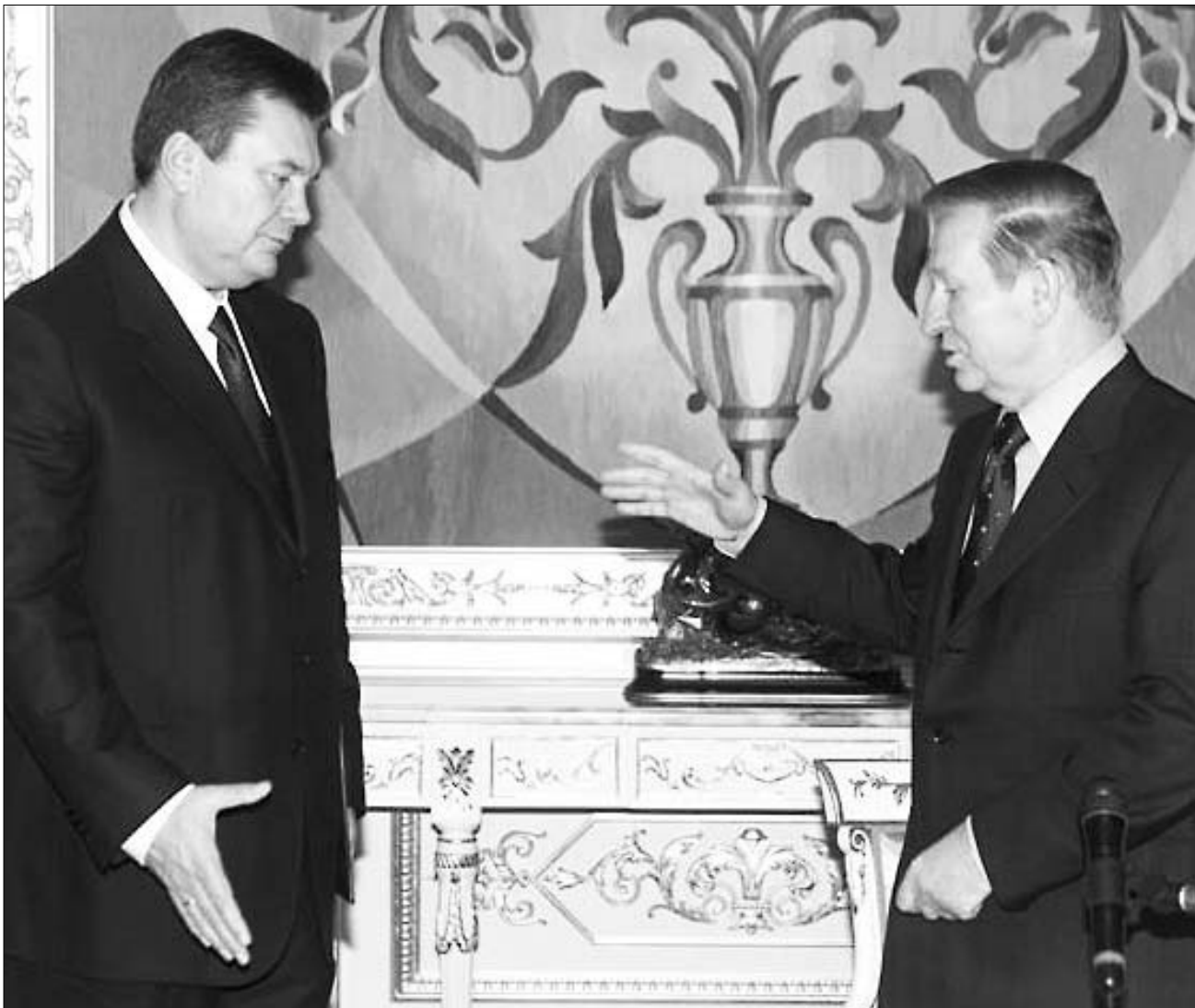
ვიქტორ იანუკოვიჩი და ლეონიდ კუჩმა

გასულ კვირას უკრაინის რადიო დიდი ალბომ-მიცემობა ქვეყნის ახალი პრეზიდენტი-მინისტრის "არჩევით" დასრულდა. 21 ნოემბერს დონეცკის ვუბერნატორმა, ვიქტორ იანუკოვიჩმა ოფისი შეიცვალა და დედაქალაქში მთავრობის თავმჯდომარის კაბინეტი დაიკავა. კენჭისყრაში მონაწილე 237 დეპუტატიდან მას ხმა 234-მა მისცა. პრეზიდენტ კუჩმასთან "საქმევაჩარხულმა" იანუკოვიჩმა, მართალია, პარლამენტის გადაწყვეტილება საერთო გამარჯვებად მონათლა, მაგრამ უკრაინელების აზრით, ეს მხოლოდ მისი პირადი წარმატებაა. ქვეყნის მოსახლეობის უმეტესობამ იმ დღეს არც კი იცოდა, რატომ ირეოდა უამრავი სპეცნომრის მანქანა რადას შენობასთან.