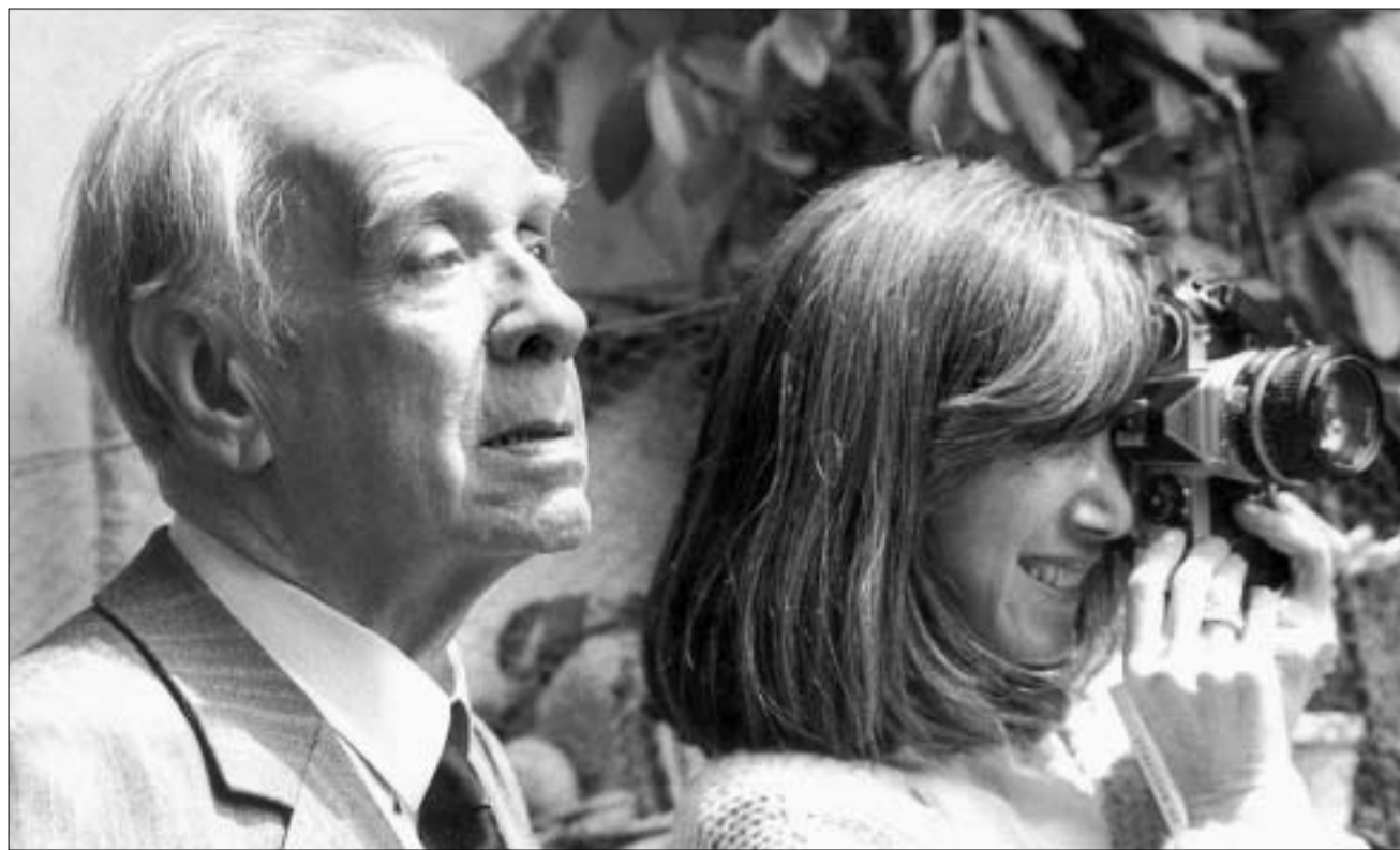
ხორხე ლეის ბორხესი მეუღლესთან, მარია კოდამსთან ერთად