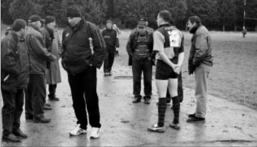
"ლოკომოტივმა" თავი აიტაცა