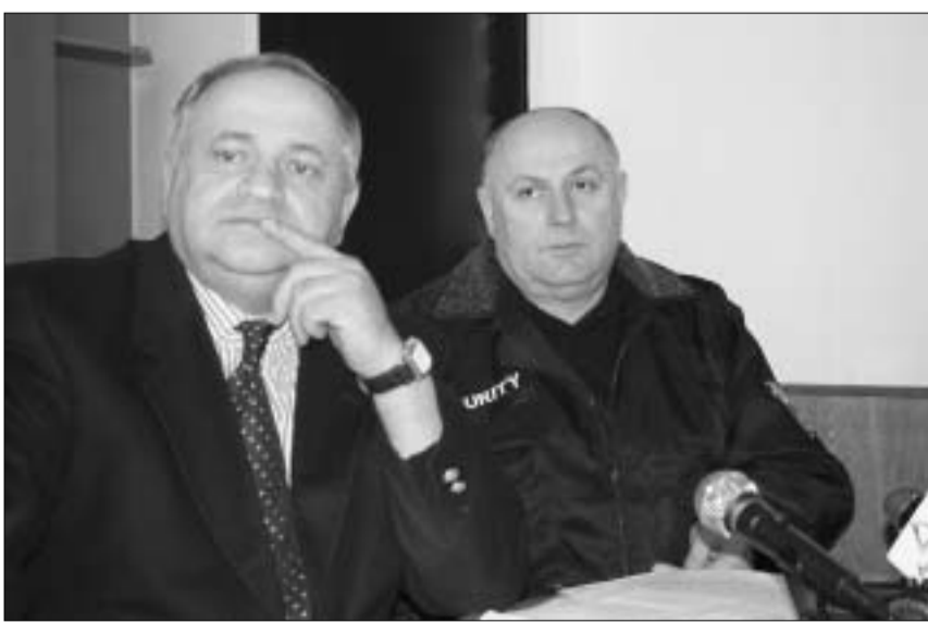
პრესკონფერენცია ისანი-სამგორის პოლიციის სამმართველოდან.

ორი კვირის წინ სასტუმრო „მეტეხი-პალასთან“ მომხდარი გახმაურებული დანაშაული განხილვია. ისანი-სამგორის პოლიციამ კრიმინალთა 7-კაციანი ჯგუფი, რომელთა შორის მცირეწლოვანი, 13 წლის ბავშვიცაა, გუშინ, დილით, მთანმინდაზე მდებარე ბარში დააკავა.