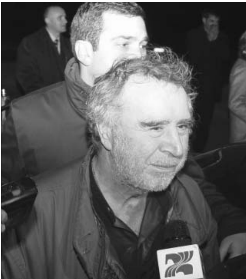
პიტერ შოუ განთავისუფლების დამეს.

მასხოსს მხოლოდ ის, რომ ჩვენს მახლობლად ნამდვილი პოლიციის მანქანა გაჩერდა. ეს საკმაოდ სასაცილო იყო: ქართულ პოლიციას ცოტა ფული აქვს და მათ არ შეუძლიათ, პისტოლეტში ერთზე მეტი ტყვია ჩა-