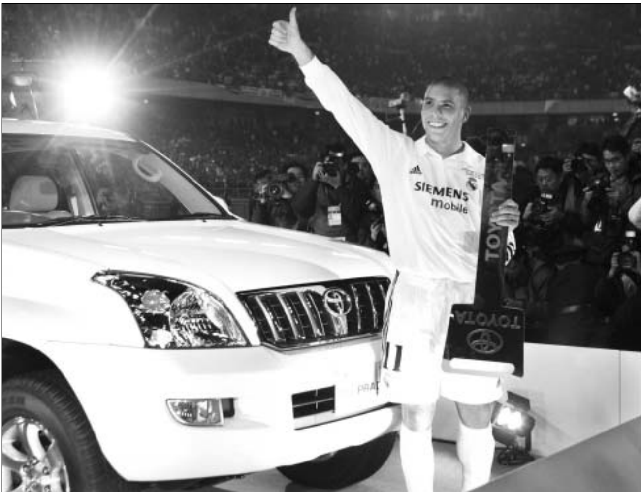
რონალდო თავისი ახალი „Toyota“-თ

მატჩის გმირი გახდა ბრაზილიელი რონალდო, რომელიც მსოფლიოს ჩემპიონატის ფინალში განცდილი ტრიუმფიდან ხუთი თვის შემდეგ კვლავ დაბრუნდა იოკოჰამას სტადიონზე და ამჯერადაც გაიმარჯვა. მატჩის მე-13 წუთზე მის მიერ გატანილი პირველი გოლი დაამყვებელი აღმოჩნდა „რეალისთვის“, თანაგუნდელის შესაცვ-