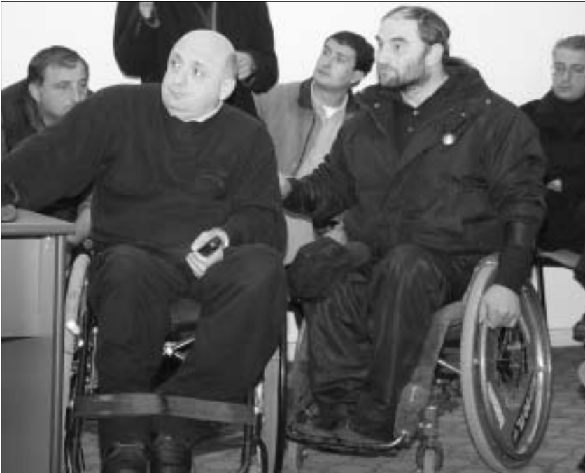
ინვალიდებს ექვს მილიონს შეპირდნენ

შეხვედრის პირველივე წუთებზე ჯანდაცვის მინისტრმა, ამირან გამყრელიძემ, ინვალიდებს გაზრდილი ბიუჯეტის შესახებ ახარა. ფინანსთა სამინისტროსთან სპეციალური შეთანხმების შემდეგ, მომავალი წლის ბიუჯეტის პროექტში უნარმწუხრულად პირთა პროგრამების დაფინანსებისთვის 6 200 000 ლარია გათვალისწინებული, რაც, მარშანდელ მაჩვენებელთან შედარებით, ორჯერ მეტია. პროგრამები, რომელიც დაფინანსებას ჯანდაცვისა და ფინანსთა სამინისტროები ინვალიდებს პირდებიან, მართლაც, სასიცოცხლოდ აუცილებელია ამ ადამიანების რამდენიმე ძირითადი პრობლემის მოსაგვარებლად. ყველაზე მნიშვნელოვანი, რაზეც ინვალიდები დიდ იმედებს ამყარებენ, უფასო სამედიცინო მომსახურების გაზრდაა. მინისტრის მოადგილე ვასიკო ჭიჭინაძე: „ამ ადამიანებს სჭირდებათ სპეციფიკური სამედიცინო მომსახურება, რასაც მომავალ წელს ყველა აუცილებლად მიღებს. ამ მომსახურებით თითოეული ინვალიდი რომ უზრუნველყოფილი იქნება, ქვეყანაში მონესრიგდეს მათი პასპორტიზაცია, რაც დღემდე არ არსებობდა.“ უნარმწუხრულად პირთა პასპორტიზაცია, ჭიჭინაძის განმარტებით, გულისხმობს: პირველ რიგში უნდა ჩატარდეს უნარმწუხრულად პირთა სპეციალური ექსპერტიზა. ამის შემდეგ თითოეულ მათგანს მიეცემა ბლანკი, რომელშიც ზუსტად იქნება განსაზღვრული, კონკრეტულად რა მომსახურება სჭირდება პაციენტს. „ინვალიდთა პასპორტიზაციის შემდეგ გვეცოდინება“, - დარწმუნებით გვითხრობ ვასიკო ჭიჭინაძე. ინვალიდთა პასპორტიზაცია და ექსპერტიზა ხსენებული ექვსი მილიონის ფარგლებში ჩატარდება. ჯანდაცვის მინისტრი განსაკუთრებულ მნიშვნელობას ანიჭებს იმ პროგრამებს, რომელთა წარმატებით განხორციელების შემთხვევაში, ინვალიდები საზოგადოების სრულყოფილებიან