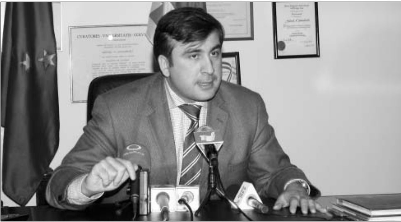
მიხეილ სააკაშვილი: "მან ვერ გაითვალისწინა, რომ მე არა ვარ ლადო კახაძე..."

ქერა: “ზოდელავას სურდა, რომ მთავრობაში გია კარბელაშვილის შეყვანით ჩვენი მხარდაჭერა მოეპოვებინა... მან ვერ გაითვალისწინა, რომ მე არა ვარ ლადო კახაძე და არ შეძლება ახალ საკრებულოს მივუდგე იმავე მეთოდებით, როგორც ძველს... რაც შეეხება კარბელაშვილს, იგი ჩვენი პარტიის წევრი არ არის. მისადმი სიმპათია გავგრძნავთ მაშინ, როცა მან გაზედა და გია ჯობითაბერიძეს დაუპირისპირდა.”