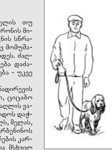
ფრანც გრანდერატის მიხედვით

დაუმეგველია სათრეველას ერთბაშად და ზედმეტად დამძიმება. ხუთ-ფრინველიანი სათრეველა თვით ცხრა თვის ხვადისთვისაც კი მეტისმეტია - მით უმეტეს, თუკი მთელი ოცი წუთის განმავლობაში ამ ტვირით ველოსიპედს გვერდით უნდა ვარბინოთ. საერთოდ კი, ასეთი შედეგებიც მიიღწევა, ოღონდ იმ ლეკვთან, რომელსაც ყოველდღიურად, მიზანმიმართულად ვავარჯშობთ და რომელიც აპორტირების თანდაყოლილი ნიჭით გამოირჩევა.