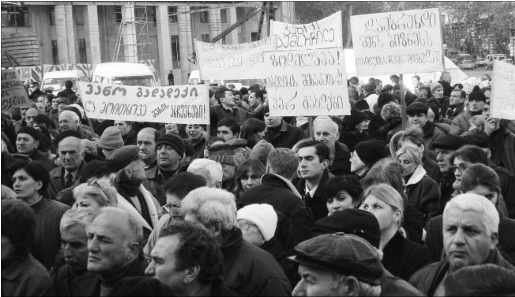
აქცია მერიის წინ