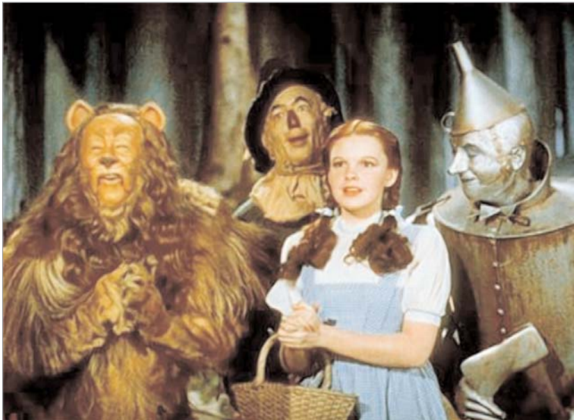
1939 წლის ფილმი

სწორედ ამ ფიგურებით მიაღება ტოდ მაკფარლენი კინოკომპანია