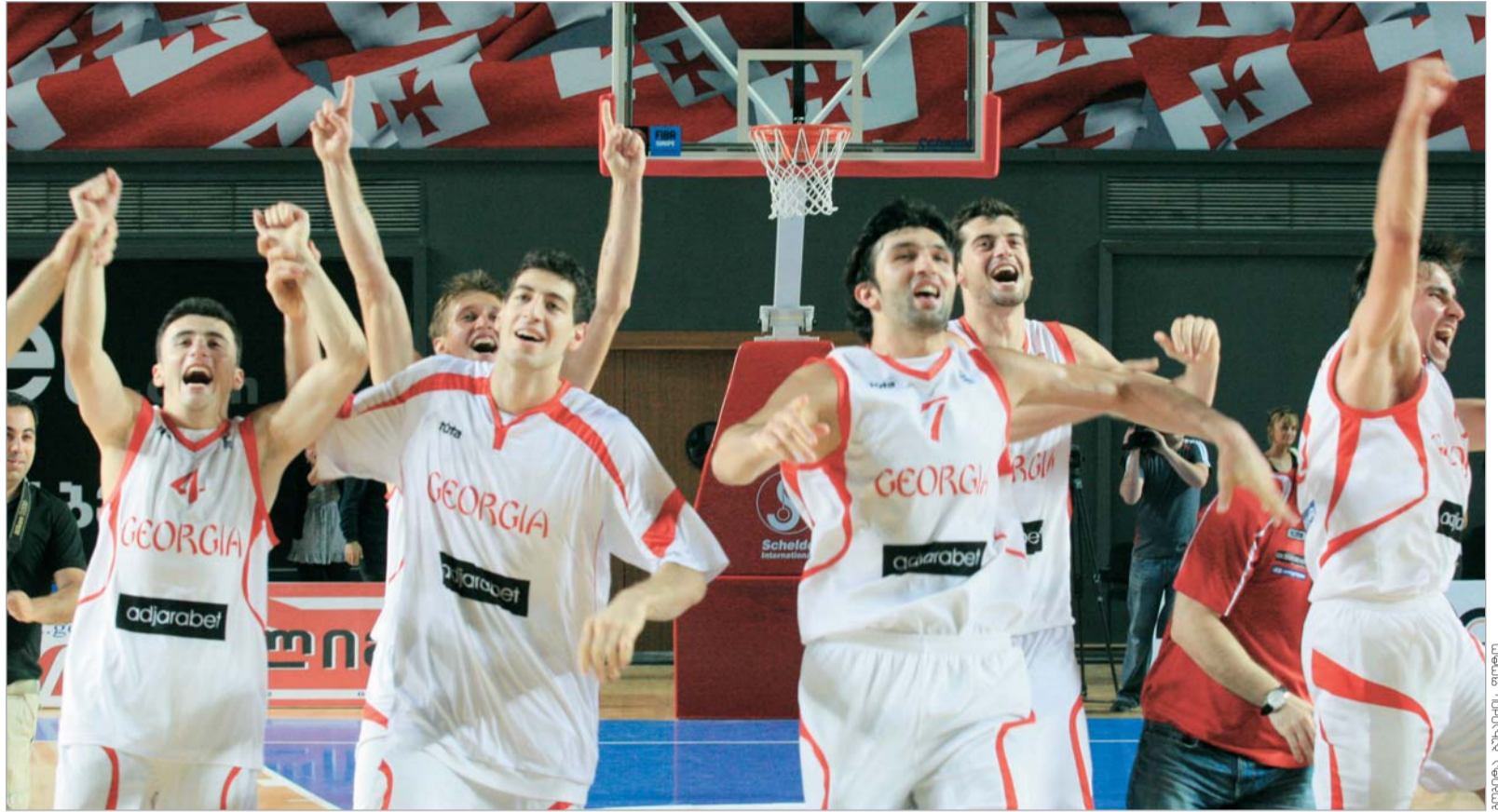
საქართველოს ნაკრები A დივიზიონში ითამაშებს.