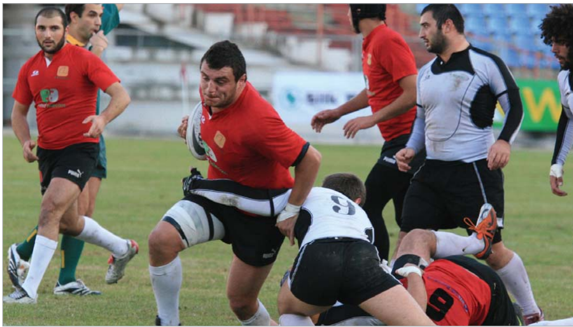
ლელოს მსგავსად, "ლოკომოტივმაც" ფლეი-ოფის საგზური მოიპოვა.

ამის შემდეგ "აკადემია" გამოცოცხლდა და უპირატესობაც მოიპოვა, მაგრამ მეტოქის ჩათვისის მოედანში ვერ შეაღწია. ჯარიმებით კი ჩამორჩენა მ ქულამდე დაიყვანა - 9:17. "ლელო" დროზე მოეგო გონს და ტაიმის ბოლომდე თითო ჯარიმა და არეკენ გაიტანა - 23:9.