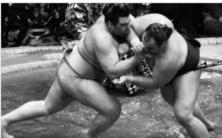
კოკაიმ ბალანსი გაათანაბრა

უნდა ითქვას, რომ ტოჩინოზინმა პირველი ოთხი მარცხის შემდეგ ზედიზედ ორი ოქეის დამარცხება მოახერხა, რამაც მის გულშემატკივარს იმედები გაუღვიძა თუმცა შაბათს და კვირას გამართული ორი დაპირისპირება ახალგაზრდა ქართველმა დათმო და ახლა იმისათვის, რომ რანგი შეინარჩუნოს დარჩენილი 7 ბრძოლიდან ექვსი აქვს მოსაგები, რაც პრაქტიკულად ალბათ შეუძლებელია და ესეგი ტოჩინოზინი რანგი დაქვეითდება.