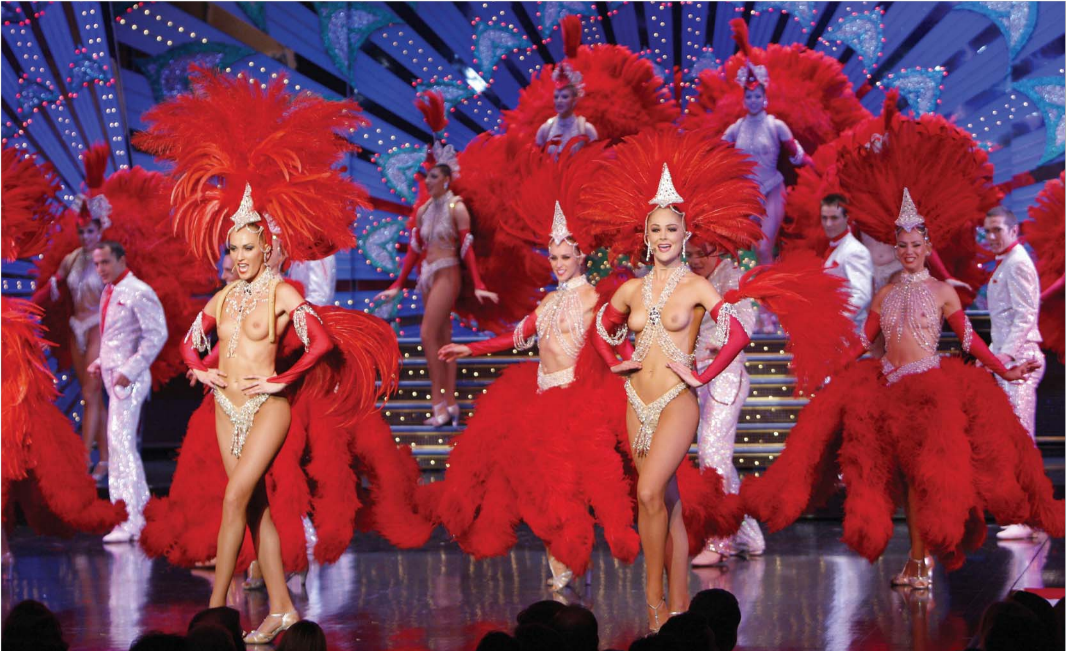
უკვე ორი დღეა, რაც პარიზის ლამის ნახევარი ზეიმობს. მულენ რუჟის კაბარეში ახალი წარმოდგენების სერია დაიწყო. 6 ოქტომბრამდე კაბარე საკუთარ 120-ე დაბადების დღეს ზეიმობს... ეს დაწესებულება პარიზის თავისებულები, ფერადი, მხიარული და ბოჰემური კულტურისა და ყოფის ტაძარია. მულენ რუჟი არაა მხოლოდ ის ადგილი, სადაც მდიდარი ტურისტები შედიან, ანდა ხელმომჭირენი მის წინ ფოტოს იღებენ, არამედ პარიზული მეოცე საუკუნის ხატებაა. ყოზეზ ოლერმა და შარლ ზიდლერმა კაბარე 1889 წელს გახსნეს და ცოტა ხანში ეს გახდა ადგილი სადაც იკრიბებოდნენ არა მხოლოდ ლამაზი და გულახდილად ჩაცმული მოცეკვავე ქალები, არამედ იქცა ადგილად, სადაც ნახევრით ყველას, ვინც იმ დროისთვის ფრანგულ კულტურას ქმნიდნენ. მულენ რუჟის მსახიობები იმთავითვე გახდნენ არაერთი ხელოვანის შემოქმედების ინსპირატორნი, მაგრამ ყველაზე მნიშვნელოვანი როლი მათ ტულუზ ლოტრეკის მხატვრობაში ერგოთ.