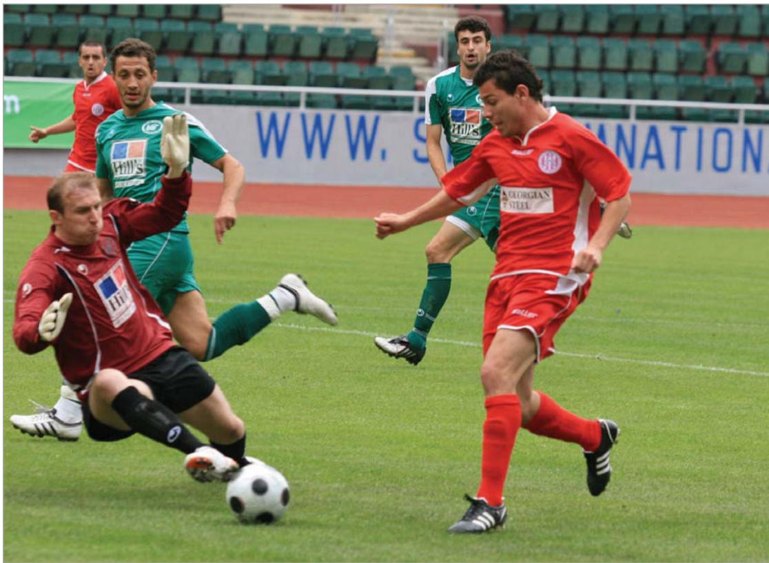
"ოლიმპი" და "ვიტ ჯორჯია" ერთმანეთს მშვიდობიანად გაეყარნენ.