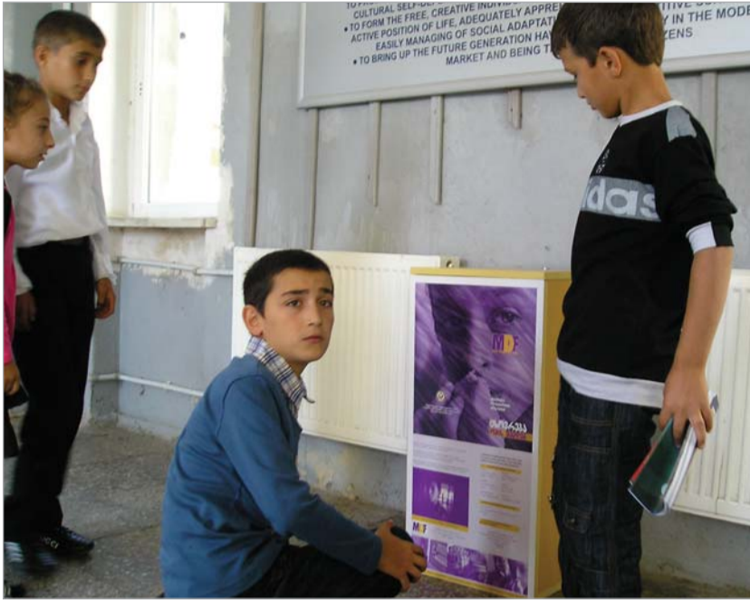
ბის ნამუშევრები უნდა ასახავდეს ომის დილეგებს და მომავლის მათეულ ხედვას. ნამუშევრები წარმოდგენილი უნდა

ცხოვრება (დევილოზაში) ომის შემდეგ - ყუთები ასეთი წარწერით საქართველოს 6 სკოლაში ახალი სასწავლო წლის დასაწყისიდან გამოჩნდა. ამ ყუთებში ერთი თვის განმავლობაში მოზარდებს, რომელთაც 2008 წლის აგვისტოს შემდეგ საკუთარი სახლების დატოვება მოუხდათ, ომისა და ომის შემდგომ ცხოვრებაზე შექმნილი თემებისა და ნახატების ჩაყრა შეუძლიათ.