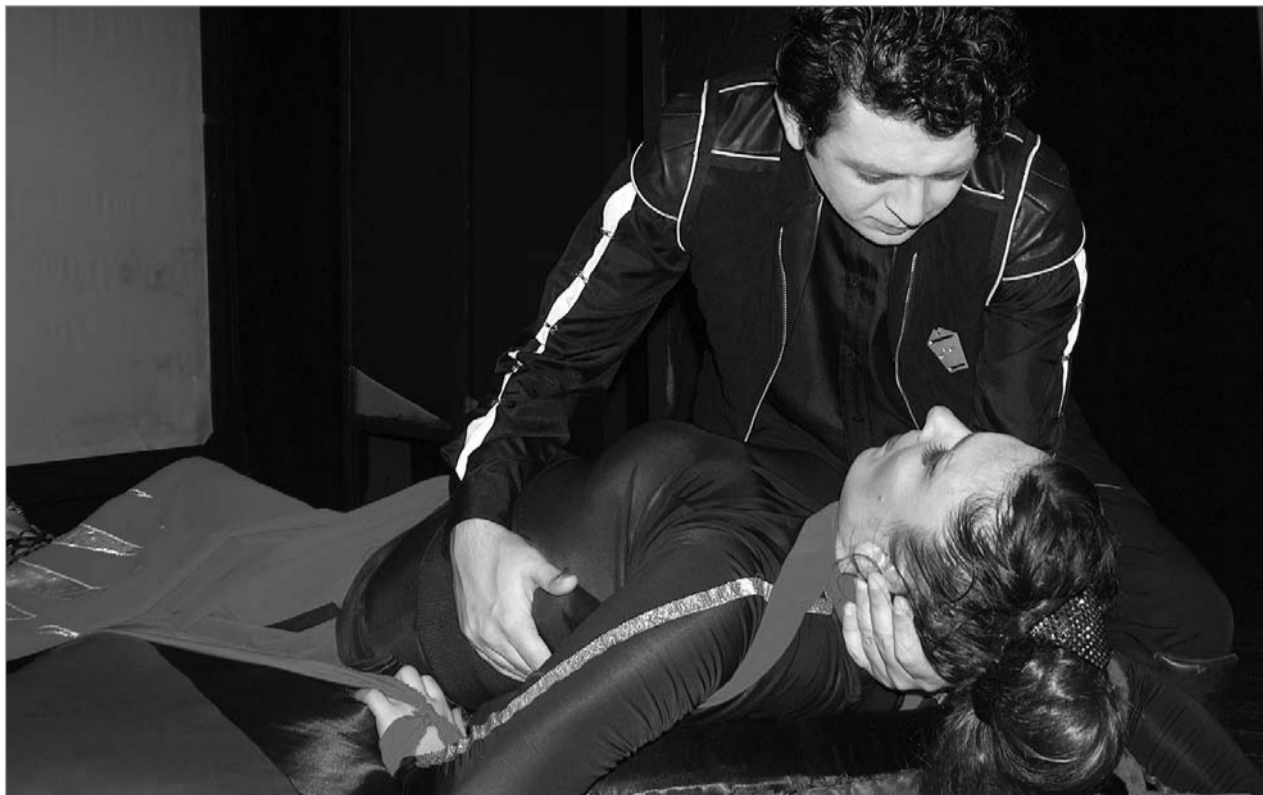
სცენა სპექტაკლიდან "451° F"

სამსახიობო ოსტატობის მხრივ, ამ შემთხვევაშიც იგივე პრობლემებთან გვაქვს საქმე, რომლებსაც მხოლოდ რეგიონალურ თეატრებში არ ვაწყდებით. ფოთის თეატრის მაგალითზე, ძალიან გამიჭირდება ისეთი მსახიობის დასახელება, რომელიც ამ საქმეში ბოლომდე დაოს-