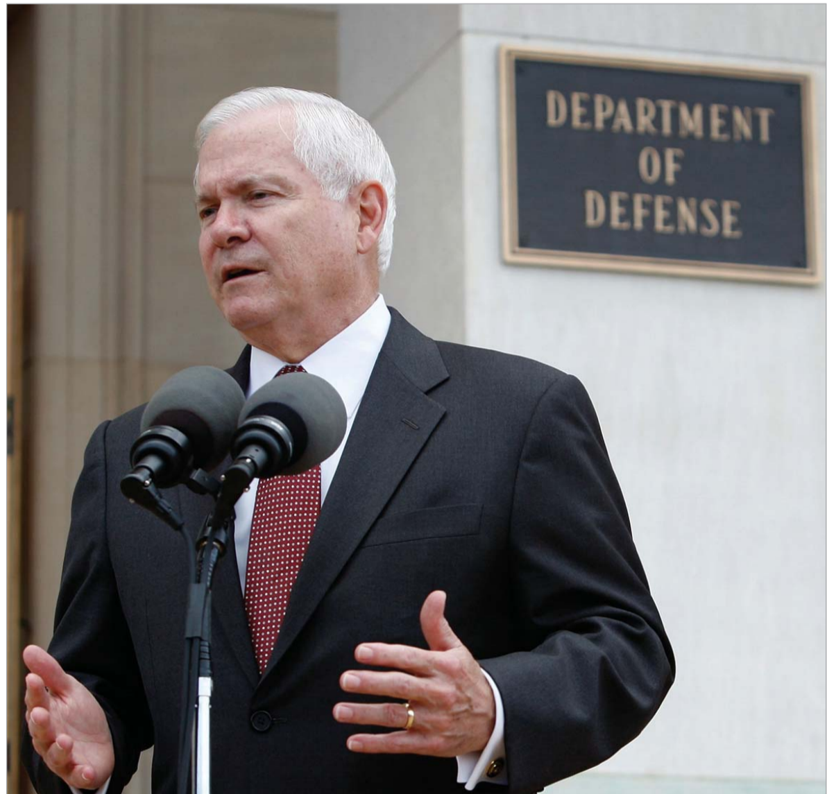
აშშ-ს თავდაცვის მინისტრი რობერტ გეითსი