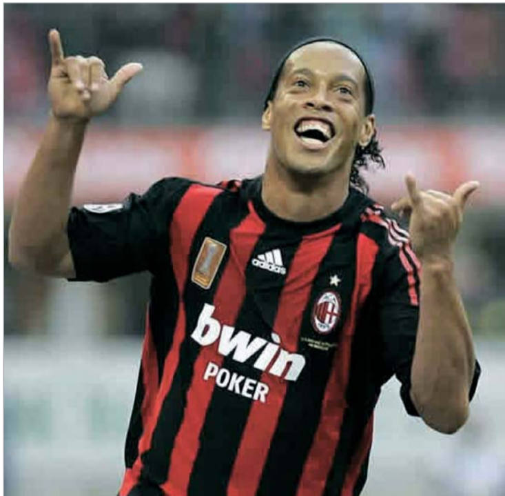
რონალდინიო მუნდიალს უმიზნებს

ამ დღეებში იტალიური მედია ავრცელებდა ინფორმაციას, თითქოს რონალდინიო სეზონის ბოლოს ფეხბურთისთვის თავის დანებებას აპირებს. ჟურნალისტები ინფორმაციის წყაროდ ასახელებდნენ ფეხბურთელის მეგობარს, რომლის თქმით, "გაუჩინო" მოტივაცია აღარა აქვს ფეხბურთის სათამაშოდ. თუ რონალდინიოს სათამაშო ფორმას გაეითვალისწინებთ და იმასაც დაუვამტყობთ, რომ ბოლო სამი სეზონის მსოფლიოს ორგზის საუკეთესო ფეხბურთელს მოედანზე თითქმის არაფერი გაუკეთებია, ზემოთქმულის დაჯერება ძნელი არ არის. ამას ისიც ემატება, რომ "მილანში" გადაბარებულ ბრაზილიელს კრიტიკის მეტი არაფერი ესმის საკუთარი თავის შესახებ.