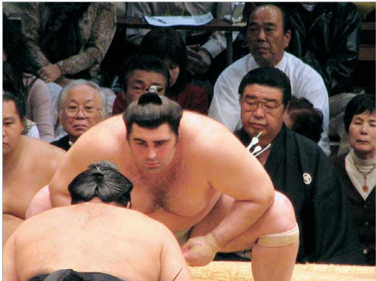
კოკაიმ ბაშოს დადებით ბალანსით დასრულების შანსს ინარჩუნებს

ტოქე იორიკირის ილეთით დაამარცხა. ქართველისთვის ეს მესამე გამარჯვებაა სექტემბრის ბაშოზე, მისმა მეტოქემ კი მესამე მარცხი იწვნია.