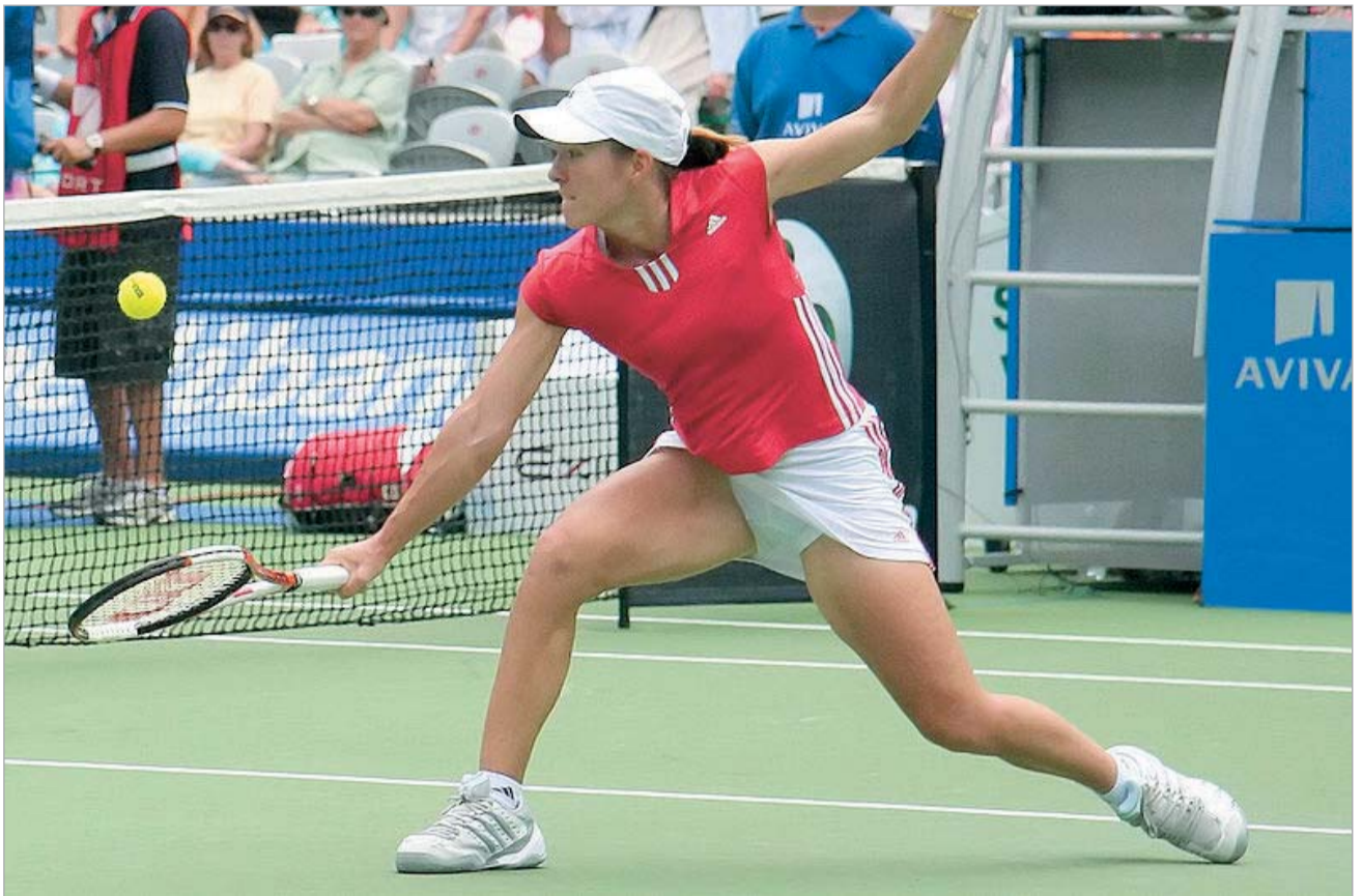
გრუნტის დედოფალი ბრუნდება

იყო დრო, როცა ქალთა ჩოგბურთში ორი ბელგიელი ბატონობდა. პირველობას ჟუსტინ ენინი და კიმ კლაისტერსი ეცილებოდნენ ერთმანეთს. კიმმა პროფესიულ ჩოგბურთს ოჯახი არჩია და წავიდა, ჟუსტინს კი უბრალოდ მობეზრდა, ის თითქმის უკონკურენტოდ დარჩა და ყველა ტურნირს უპრობლემოდ იგებდა. მხოლოდ უიმბლდონი არ დაემორჩილა, თუმცა, ჩოგბურთის დედოფალმა დაახლოებით ერთი წლის წინ თქვა, აღარ მინდა თამაში და წავიდა. თან, WTA ტურის ხელმძღვანელებს სთხოვა, რეიტინგიდან ამოეშორებინათ. ასე რომ არ მომხდარიყო, ჩოგბურთიდან წასული ბელგიელი კიდევ კარგა ხანს შეინარჩუნებდა ამქარში პირველობას. სულ ცოტა ხნის წინ პროფესიულ ჩოგბურთს კიმ კლაისტერსი დაუბრუნდა და დიდი სლემის პირველივე ტურნირი მოიგო. როგორც ჩანს, მაგალითი გადამდები აღმოჩნდა. და აი, სამშობათს ჟუსტინ ენინმა ოფიციალურად განაცხადა, რომ პროფესიულ ჩოგბურთს უბრუნდება და მისი პრიორიტეტი უიმბლდონის მოგება იქნება. "ბედნიერი ვარ განვაცხადო, რომ მართლაც ვაპირებ პროფესიულ ჩოგბურთში დაბრუნებას. გასული 15 თვის განმავლობაში ჩოგბურთზე არ მიფიქრია. თუმცა, უცებ მივხვდი, რომ ჩემში თამაშის სურვილმა ისევ გაიღვიძა. რა თქმა უნდა, ქვეცნობიერად კიმის წარმატებამ იქონია გავლენა. თუმცა, ეს ძირითადი მიზეზი არ არის. მინდა უიმბლდონი მოვიგო. დაბრუნების შემდეგ ჩემი პრიორიტეტი სწორედ ეს იქნება", - განაცხადა ენინმა. "ჟუსტინი ქალთა ჩოგბურთის ერთ-ერთი დიდი ჩემპიონია და, ცხადია, მისი დაბრუნება გვახარებს. დარწმუნებული ვარ, მილიონობით გულშემატკეპარი