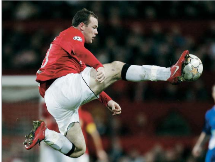
რუნი "ოლდ ტრაფორდის" დატოვებას არ ფიქრობს

უკვე ხუთი წელია, რაც უეინ რუნი "მანჩესტერ იუნაიტედის" ლირსებას იცავს. ის უკვე ჩამოყალიბდა მანჩესტერის გუნდის ლიდერად. მის გარეშე ალექს ფერეისონის რაზმი წარმოუდგენელია. სერ ალექსი შეელია კრიტიკიანუ რონალდუს და კარლოს ტევესს, რუნი კი იმ ფეხბურთელთა კატეგორიას განეკუთვნება, რომლებიც არ იყიდებიან. როგორც ჩანს, არც თავად რუნი აპირებს კლუბის შეცვლას. "მანჩესტერში" მას იგივე გზის გაველა სურს, რაც სკოულზმა და გიგზმა გაიარეს. მანჩესტერის ოფიციალურ ვებგვერდზე გამოქვეყნდა რუნის მცირე ინტერვიუ, რომელსაც ჩვენს მკითხველს ვთავაზობთ.