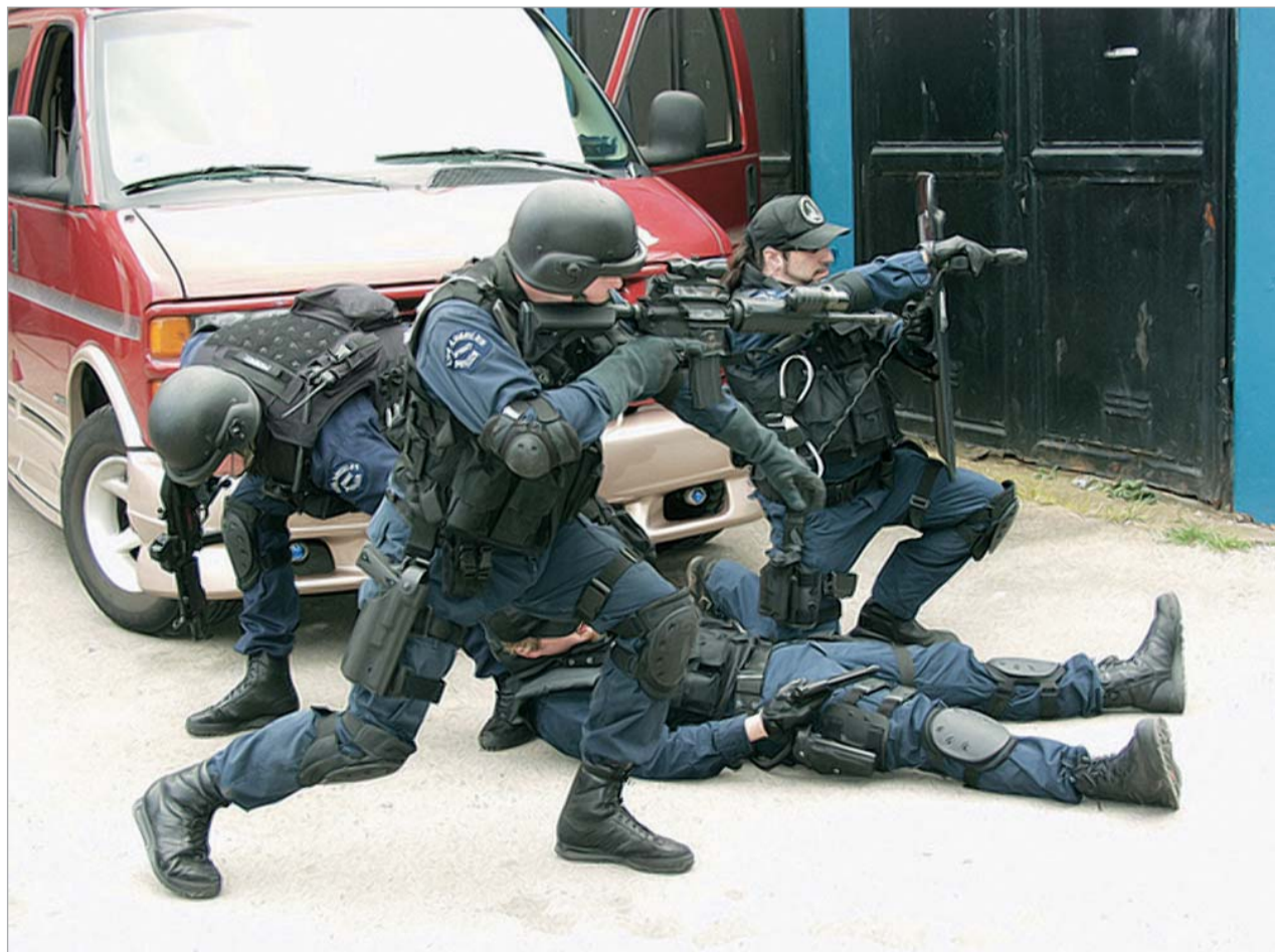
ფართომასშტაბიანი ოპერაცია ლოს-ანჯელესში

ამერიკელ კოლეგებთან შეხვედრისას რუსეთის ნარკოტიკების ბრუნვაზე კონტროლის ფედერალური სამსახურის უფროსმა ვიქტორ ივანოვმა ამერიკისგან მოითხოვა ავღანეთში ყაყაჩოს პლანტაციების განადგურება. The New York Times-ის ინფორმაციით, ივანოვის განცხადებით, რუსეთში შესული ავღანური ნარკოტიკით ქვეყანაში კატასტროფულ სიტუაციას ქმნის.