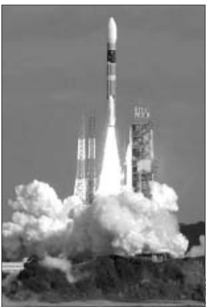
"H-2A" ტიპის რაკეტა გაშვების მომენტში

ახალი თაობის "H-2A" ტიპის რაკეტა, რომელზეც ოთხი თანამგზავრი არის განთავსებული, ტოკიოდან 1000 კმ-ით დაშორებული პატარა ტრაიკულის კუნძულოდან ნარმატებით გაფრინდა კოსმოსში. მასზე განთავსებული სატელევიზიოებიდან ერთი ავსტრალიის კუთვნილებაა. გაშვებული რაკეტის სიგრძე 53 მეტრს შეადგენს. "რაკეტის ნარმატებით გაშვება მიუთითებს იმაზე, რომ "H-2A" ტიპის რაკეტამ შესაძლოა, მალე მსოფლიო მასშტაბის ნდობა დაიმსახურებს," - განაცხადა იაპონიის მეცნიერებისა და ტექნოლოგიების მინისტრმა აიკუკო ტოიამამ. უნდა ითქვას, რომ ეს იაპონიის მიერ ამ ტიპის რაკეტის ნარმატებით გაშვების მეორე შემთხვევაა. პირველად "H-2A" ტიპის რაკეტა იაპონიამ 2001 წლის ავგისტოსში გაუშვა, თუმცა მასზე კოსმოსური თანამგზავრები განთავსებული არ ყოფილა. მეორე მცდელობა, რომელიც კრახით დასრულდა, 2001 წლის თებერვალში შედგა. ამჯერად კი ყველაფერმა კარგად ჩაიარა.