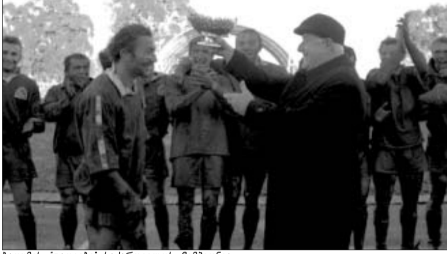
ბათუმის "დათვები" საქართველოს ჩემპიონია

ნი დამდნარი თოვლისგან ატალახებულ მოედანზე გაიმართა, უფრო სწორად, მოედანი თანდათან ატალახდა და ბოლოს ისეთი ვითარება შეიქმნა, გულმგობ მატკიერებს უკვირდით კიდევ, მორავტებები ერთმანეთს როგორ არჩევდნ. შეხვედრის დასრულების შემდეგ მატჩის არბიტრმა, ნოდარ რობიტაძემაც გაიხუმრა, - ვინ რომელი გუნდის მოთამაშე იყო, ხშირ ვარჩევდი, თორემ სახე არავის უჩანდაო.