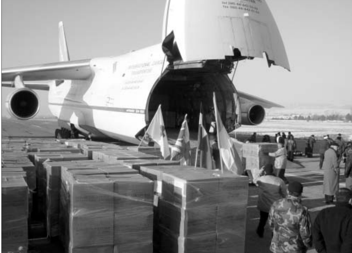
თბილისის აეროპორტი - თვითმფრინავი “სამარიტელთა ქისით”.