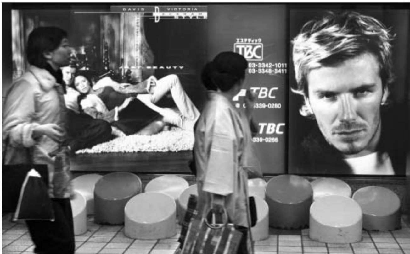
ბექჰემის იაპონური რეკლამა

იაპონელებს ბექჰემისადმი სიყვარული არც მსოფლიო ჩემპიონატის შემდეგ განუღებიათ. ინგლისის ნაკრების მარცხის მოუხედავად, "მანჩესტერ იუნაიტედისა" და ეროვნული ნაკრების კაპიტანი დღესაც მალაი რეიტინგით სარგებლობს. იაპონურმა შოკოლადის მწარმოებელმა კომპანიამ ამიტომაც გადაწყვიტა, თავისი ახალი პროდუქტის რეკლამაში ბექჰემი და მისი მეუღლე გადაეღო. უზარმაზარი