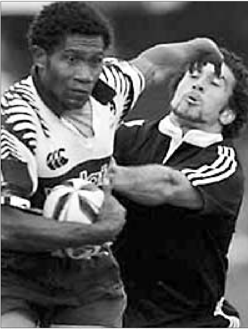
ფიჯისა და ახალი ზელანდიის ნაკრები გუნდების შეხვედრის ფრაგმენტი

სამხრეთ აფრიკაში კი შვიდაცა რაბბის მოთამაშე მსოფლიო შვიდაცა სერიის მეორე ტურნირზე შეიკრიბნენ. სერიის პირველი ტურნირი, რომელიც დუბაიში გაიმართა, ახალზელანდიელთა გამარჯვებით დასრულდა. ზეზანიძელები ამჯერადაც ფინალში გავიდნენ, ოღონდ რაბბის ამ სახეობის ჯადოქრებთან - ფიჯელებთან დამარცხდნენ (14:24).