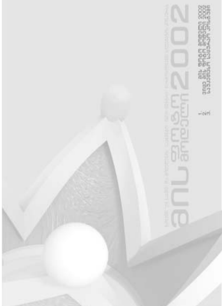
L5 რუსიკო ავაგუაძე სააპი-18, 182/91/62/82, თბილისი - თაფლის, თბა - შავი