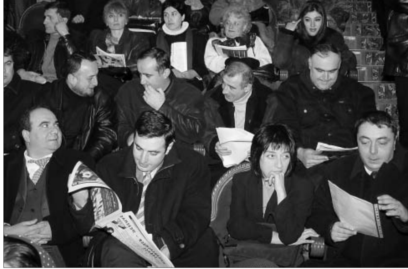
„ედეკ“-ის კონფერენციის სტუმართა შორის მხოლოდ „მოქალაქეობრივი“ არ იყო.