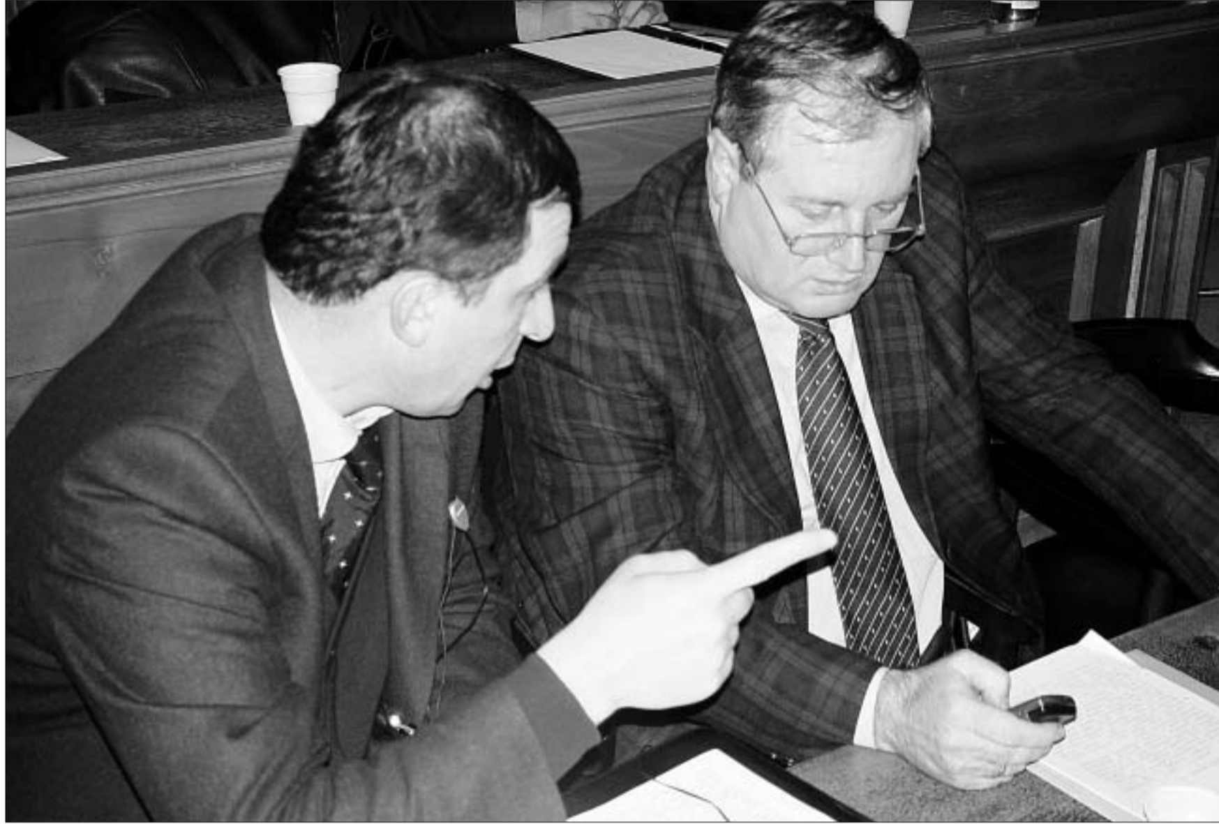
აღმასრულებელი ხელისუფლება პარლამენტის კრიტიკას მორჩილად ისმენდა.