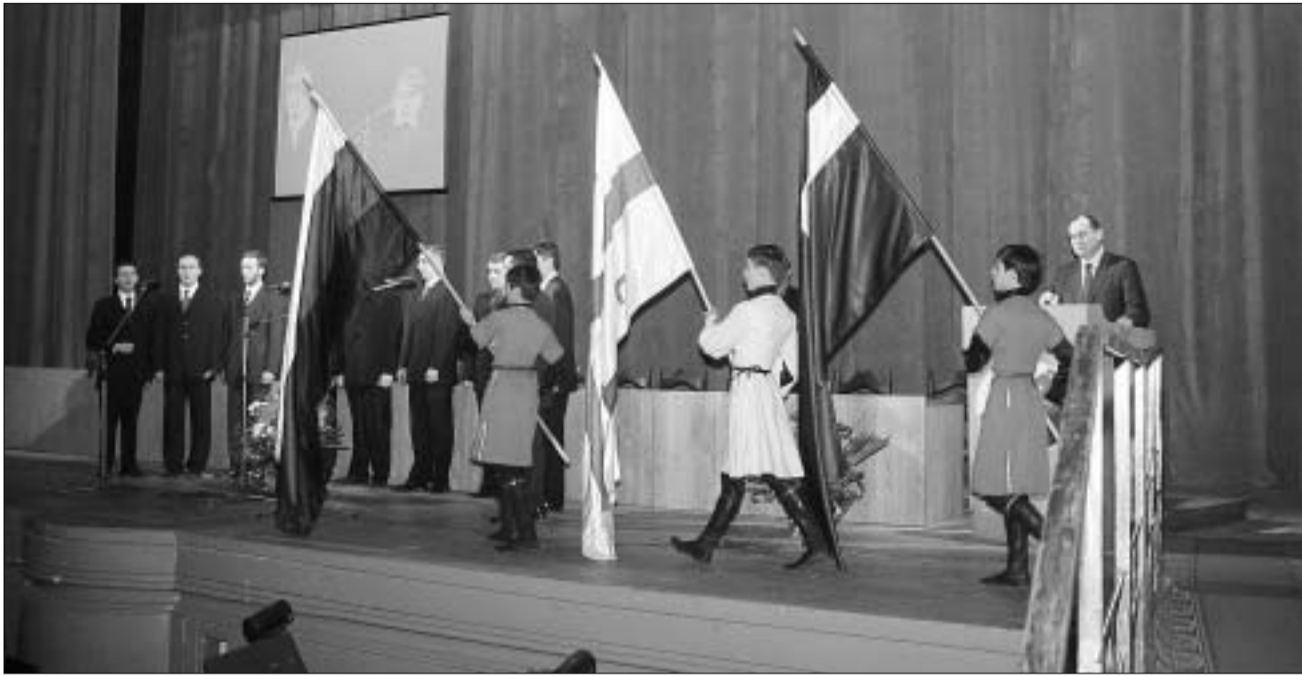
„ედაპე“ ამომრჩეველს წარსული სიძლიერის აღდგენას პირდება

საგულისხმოა, რომ თავის გამოსვლაში პარტიის ლიდერმა ხელისუფლება და ზოგიერთი ოპოზიციური პარტია მათ მიმართ ფარულ და მიხამშიმაროვალ მტრობაში დაადანაშაულა, რაც, სარიშვილის თქმით, „საზოგადოების