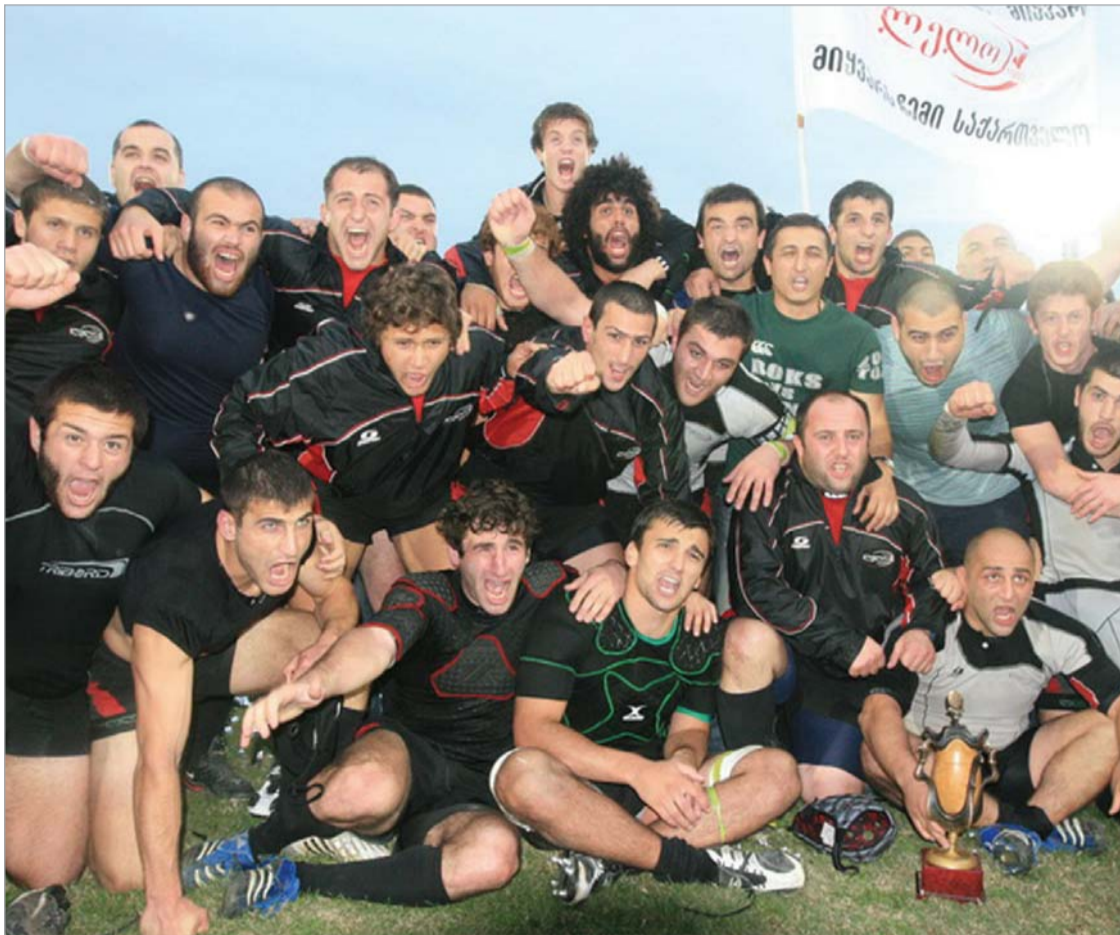
"ლელო" საქართველოს ორგზის ჩემპიონია.

ბათუმის ფინალისტობა იმდენად დიდი სიურპრიზი იყო, რომ სპეციალისტების ნაწილი მას "ლელოს" წინააღმდეგ სამარცხვინო მარცხსაც კი უწინასწარმეტყველებდა. ლევან მაისაშვილმა ფინალისთვის ტრადიციული ტაქტიკა აირჩია. ხაზის მოთამაშეების სწრაფ, ფლანგურ გარღვევებს