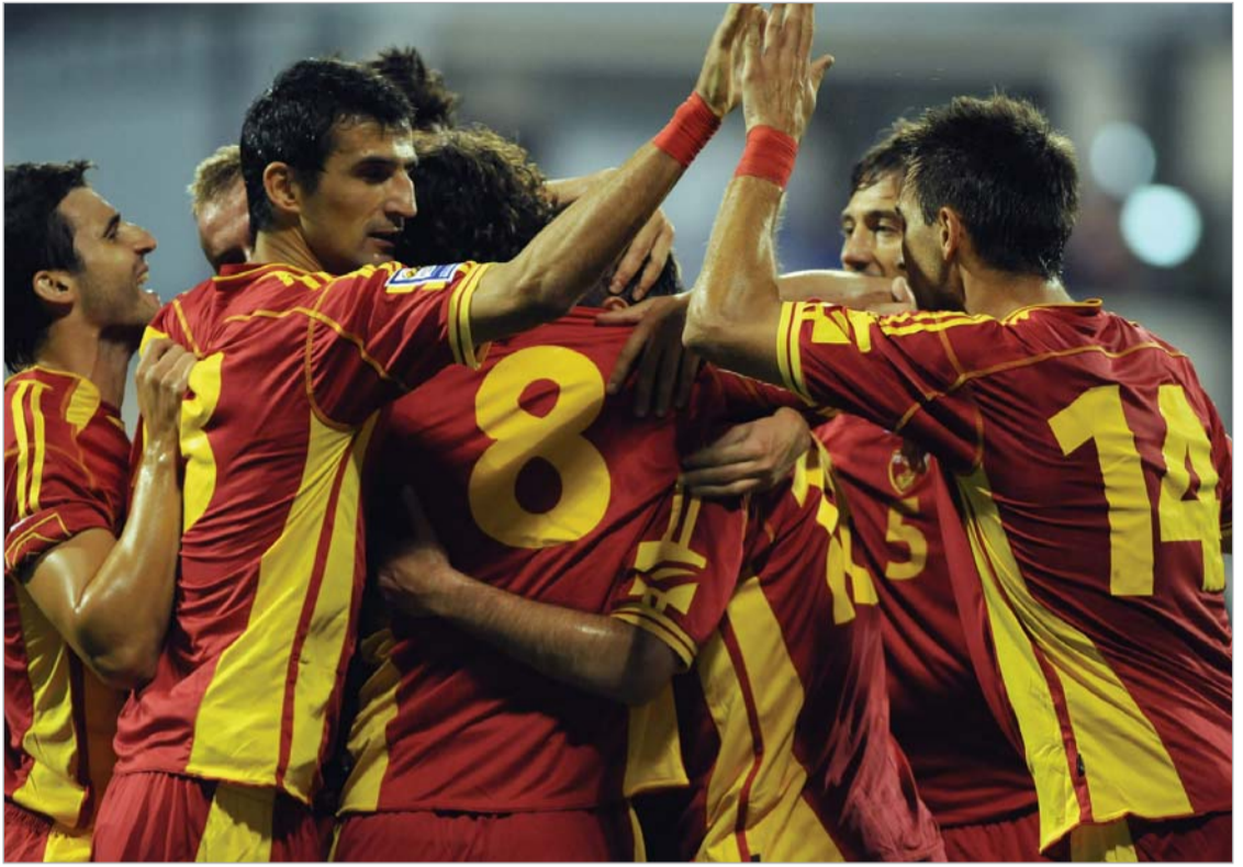
მონტენეგრომ პირველი გამარჯვება სწორედ საქართველოს ნაკრებთან მოიპოვა.

ანტირეკორდია. ამ შავ სტატისტიკას მძიმე მორალურ-ფსიქოლოგიური ტვირთიც სდევს თან. თქმა იმისა, რომ საქართველოს ეროვნული ნაკრების ფეხბურთელებს ნაგებულის ფსიქოლოგია მყარად ჩამოუყალიბდათ, ნიშნავს, რომ არაფერი სთქვა. ნაკრების ერთმა წევრმა მითხრა, როგორც კი კლუბის ჭიშკარს გამოიკეტავს და ეროვნულ გუნდში გამოემუშრება, პირველ რიგში მარცხის წინაგრძობა უფლება და გამარჯვების სასწაულის მოლოდინშია. ასეა: ჩვენი ნაკრებისთვის გამარჯვება მართლაც სასწაულის ტოლფასი გახდა. სასწაულის, რომელიც ჩვენს მწველთა ფეხბურთელებზე აღარაჩივრად არ არის დამოკიდებული და რაღაც “ტუნგუსის მეტეორის” მსგავსი უნდა ჩამოვარდეს, ეს ვითარება რომ შეცვალოს. კიდევ ერთი ანტირეკორდი ის გახლავთ, რომ კიდევ ერთი თამაში გვაქვს ჩასატარებელი - სოფიაში, ბულგარეთის ნაკრებთან, მაგრამ 100-0-იც რომ მოვიგოთ, ცხრილში უსამარჯვებოებს ბოლო საფეხურს ვერ დავტოვებთ, რის გამოც, მომდევნო - ევროპის ჩემპიონატის საკვალიფიკაციო ტურნირის წილისყრას ყველაზე დაბალ - მე-9 კალათაში შეხვედრებით, რაც ჩანაწახშივე გვისძობს რაიმე წარმატებაზე ფიქრის იმედს. ეს კი ნიშნავს, რომ კუპერმა და მისმა გუნდმა არა მხოლოდ თავისი შესარჩევი ციკლი, არამედ, პრაქტიკულად, მომდევნო ციკლიც სტარტამდე ჩააგდეს, რაც ამ არგენტინელის მთავარი დანაშაულია.