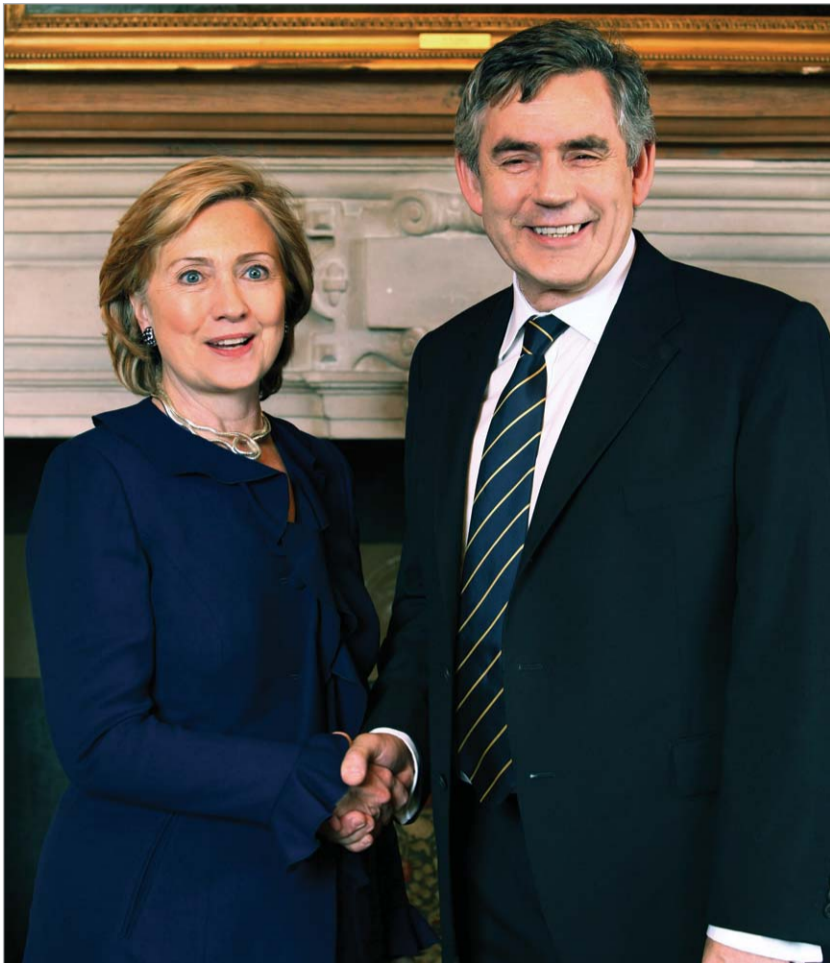
ჰილარი კლინტონი და გორდონ ბრაუნ

12-დან 15 ოქტომბერს ჰილარი კლინტონი თავის ახალ თანამდებობაზე ყოფნის დროს პირველად მიემგზავრება რუსეთში. სამშაბათს მას დაგეგმილი აქვს შეხვედრა ქვეყნის პრეზიდენტ დიმიტრი მედვედევთან. მოსკოვში ვიზიტის დროს კლინტონი გამართავს მოლაპარაკებას სტრატეგიული თავდაცვითი შეიარაღების შესახებ ახალი შეთანხმების დასასრულებლად. ამჟამად არსებულ შეთანხმებას 5 დეკემბერს ენურება ვადა, და ორივე მხარე ამ წლის განმავლობაში თითქმის ყველაფერს აკეთებდა რათა დოკუმენტის ვადის ამოწურვას არ