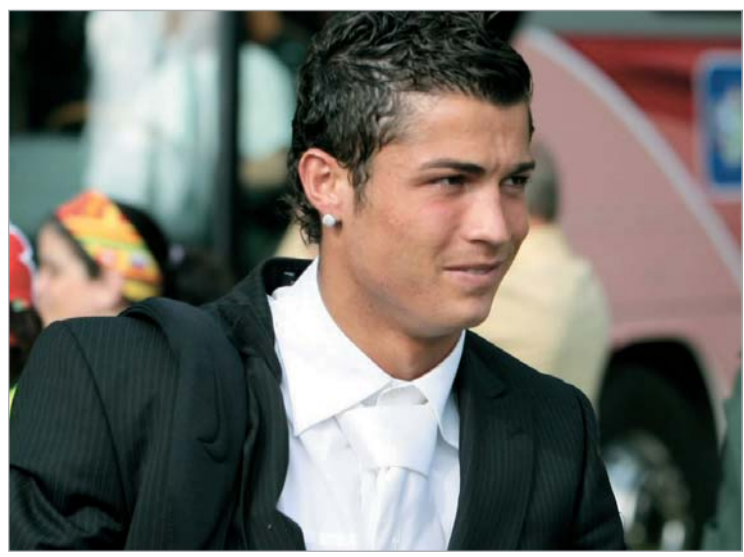
რონალდუს ტრავმები მოეძალა

ორიოდე კვირის წინ ესპანურმა მედიამ გაავრცელა, ცოტა არ იყოს, უცნაური და სასაცილო ინფორმაცია. თურმე ნუ იტყვით და, ვიღაც ჯადოქარი კრიშტიანუ რონალდუს ემუქრება. გაზეთ "ასში" გავრცელებული ცნობის თანახმად, "რეალის" ოფისში მივიდა ამ მხიბავის წერილი, რომელშიც ეწერა, რომ კრიშტიანუ რონალდუს საფეხბურთო კარიერა მიადრთხეშია. მხიბავის თქმით, ის იმდენს იზამს, რომ რონალდუ ტრავმების გამო კარიერას დაასრულებს. ცხადია, თავიდან ამას ყურადღება არავინ მიაქცია, მაგრამ მერე... როგორც ვთქვით, მხიბავი დაახლოებით ორი კვირის წინ დაიბეჭდა. ამას მოჰყვა "რეალისა" და "მარსელის" ჩემპიონთა ლიგის მატჩი, რომელშიც რონალდუმ ტრავმა მიიღო - 70-ე წუთზე ფეხბურთელი მოედნიდან გაიყვანეს. ამ ტრავმის შემდეგ ჯადოქარმა კიდევ ერთხელ შეგვახსენა თავი. ესპან-