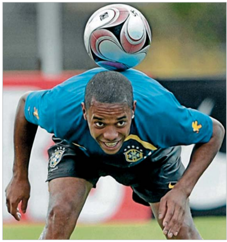
რობინიოს "ბარსელონაში" სურს თამაში

"მანჩესტერ სიტის" ბრაზილიელ შემტევს სურს დაამტკიცოს, რომ ექსტრა კლასის ფეხბურთელია. რობინიოს უნდა, თვალნათლივ დაანახოს მადრიდის "რეალის" მესვეურებს, რომ თავის დროზე გუნდიდან მისი გაშვება უდიდესი შეცდომა იყო და ამისთვის ბრაზილიელი ესპანეთში დაბრუნებას და "ბარსელონაში" თამაშს გეგმავს. ერთი თვად რობინიოს გეგმები და მეორე - რეალობა. თუ "ბარსელონამ" არ მოისურვავს რობინიოს შექენა, ცხადია, ბრაზილიელის ოცნება ოცნებადვე დარჩება. თუმცა, გავრცელებული ინფორმაციის თანახმად, კატალონიური გრანდი მართლაც დაინტერესდა რობინიოს გადაბირებით. "საინტერესო ვარიანტია", - თქვა ჩიკი ბეგირისტიანმა, გვარდიოლამ კი ამ ტრანსფერს მწვანე შუქი აუწოთ. საქმე ის არის, რომ რობინიოს შექენით პეპს ტიერი ანრის გამოფხიზლება სურს. ამჟამად "ბარსელონას" შეტევის მარცხენა ფლანგზე "ტიტის" კონკურენტი არ ჰყავს. პერიოდულად ამ პოზიციაზე პედრო და ინიესტაც თამაშობენ, თუმცა ეს იძულებითი ნაბიჯია. რაც შეეხება რობინიოს, ის სწორედ მარცხენა ფლანგზე მოთამაშე ფეხბურთელია და ან-