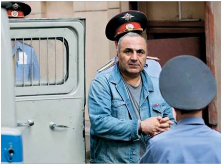
ვიაჩესლავ ივანკოვის მკვლელობა ბოლო დღეების მანძილზე რუსული მედიის წამყვანი თემა გახდა. გუშინ ცნობილი გახდა, იმ ქილერის ვინაობა, რომელმაც "იაპონრიკს" ფაქტობრივად, სასიკვდილო ტყვია ესროლა. გავრცელებული ინფორმაციით, ქილერი ვეტერანი ავღანელი იყო და მას ბანდიტური დაჯგუფების ლიდერებმა მიაგნეს.

რუსული მედიის ინფორმაციით, მაფიოზებმა მილიციას დაასწრეს და ქილერი, რომლის ვინაობაც ჯერჯერობით გასაიდუმლოებულია, სიცოცხლეს გამოასალმეს. ამავე ინფორმაციით, მკვლელობამდე მან მოასწრო შემკვეთის ვინაობის დასახელება. ამ ინფორმაციის მიხედვით, "იაპონრიკს" მკვლელობა ტარიელ ონიანმა შეუკვეთა, რომელიც ამჟამად, რუსეთის ციხეში იმყოფება და "კანონიერი ქურდების" მიერ ცოტა ხნის წინათ გამოტანილ განაჩენს ელოდება. .