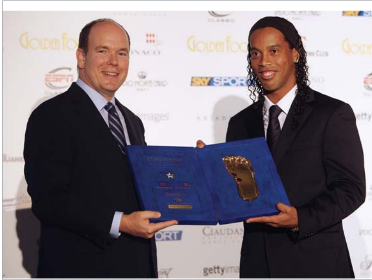
მონაკოს პრინცმა რონალდინიოს ჭილდო გადასცა

ამ ფეხბურთელს კარიერის განმავლობაში ყველაფერი აქვს მოგებული, რისი მოგებაც ერთ მოთამაშეს შეუძლია. შესაძლოა, სწორედ ეს გახდა იმის მიზეზი, რომ ფეხბურთის თამაშისას მის განთქმულ ღიმილს ვეღარ ვხედავთ. როდესაც რონალდინიო თამაშობს, ისეთი შთაბეჭდილება რჩება, რომ მას ფეხბურთი მობეზრდა. უკვე რამდენიმე წელია, ბრაზილიელი ფეხბურთის გულშემატივარი ვეღარ ხედავს იმ შთაბეჭქდავ თამაშს, რომელსაც რონალდინიომ შეგვაჩვენა. ორშაბათს მონტე კარლოში რონალდინიოს მორიგი ჭილდო გადაეცა. მონაკოს პრინც ალბერ მეორის ხელიდან მან მოქროს ფეხში მიიღო. შეიძლება გაგიკვირდეთ კიდევ, რა დროს რონალდინიოს დაჯილდოებაა, უკვე სამი სეზონია მას გროსის ფასი არაფერი გაუკეთებიაო. მაგრამ მოქროს ფეხში სხვა ტიპის ჭილდოა. ამ ტიტულს მხოლოდ 29 წელს მიღწეულ ფეხბურთელებს გადასცემენ და არა დღევანდელი თამაშისთვის, არამედ წარსული დამსახურებისთვის. პოდა, რა გასაკვირია, რომ მილანის ბრაზილიელი ვარსკვლავი დააჯილდოეს. რონალდინიოსთან ერთად