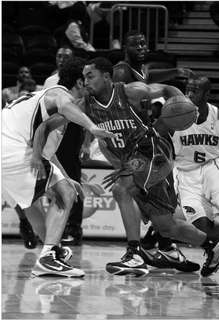
ფაჩულია მეტოქის შეჩერებას ცდილობს

შორფორდის არც ისე დამაჯერებელი თამაში ატლანტელთა გულშემოტყვივისთვის საგანგაშო აღმოჩნდა, თუმცა მსოქუისმ მწვრთნელს მაიკ ვუდსონს მიაჩნია, რომ ალის სუსტი თამაში კომპენსირდება ზაზას კარგი ასპარეზობით და ამ დუეტს ბევრი სიკე-