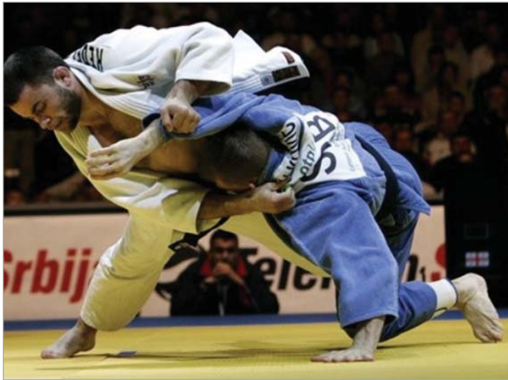
კედელაშვილი შინ გამარჯვებული დაბრუნდა

ჩემპიონები გახდნენ ზაზა კედელაშვილი (73 კგ.) და ლაშა გუჯეჯიანი (მძიმე წონა), ვერცხლის მედლები მოიპოვეს დავით კუპრაშვილმა (73 კგ.) და გრიგოლ მამრიკიშვილმა (90 კგ.), ბრინჯაო - ამირან პაპინაშვილმა (60 კგ.), მინდია ბოდაველი (90 კგ.), ლომერ ჟორჯო-