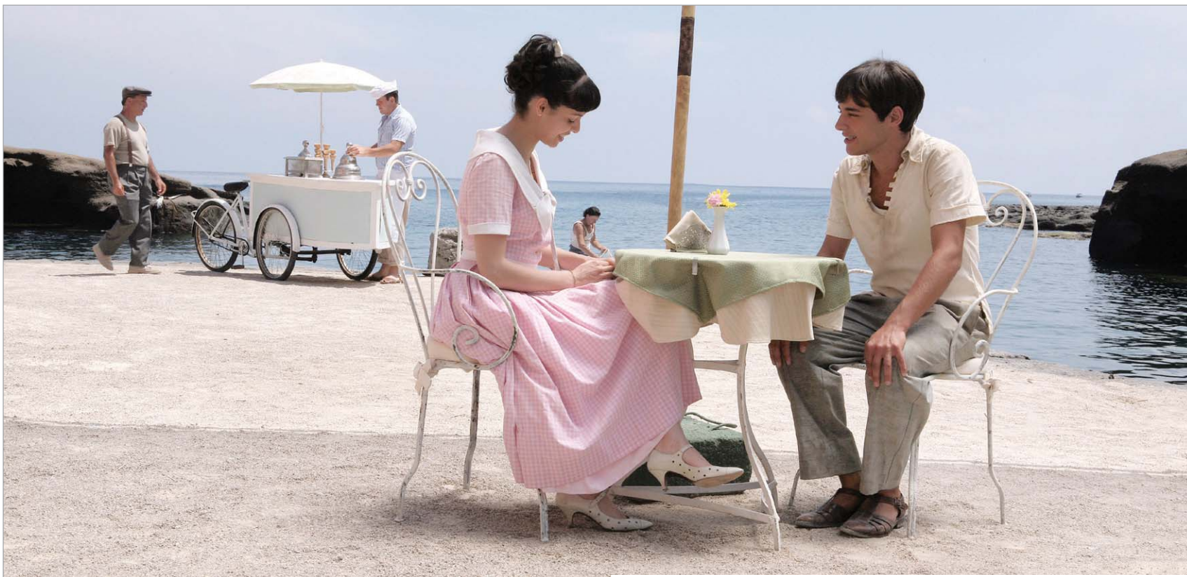
კადრი ფილმიდან "მარჩელო, მარჩელო"

პოლიციელია და ახალგაზრდა ქალის მკვლელობას იძიებს. ეს ნაწარმოები დაედო საფუძვლად ამავე სახელწოდების ფილმს, რომელშიც კრიმინალური სამყაროს თავისებურებებია წარმოჩენილი. ის მოულოდნელი ფინალით მთავრდება და მაცურებელს მოწყენის საშუალებას არ აძლევს.