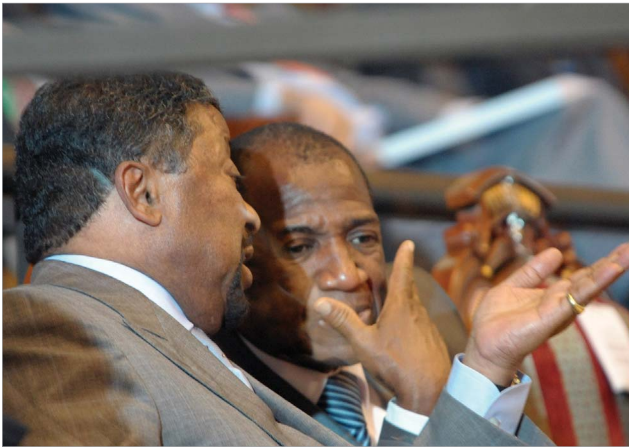
გვინეის პრემიერი კაბინე კომარა (მარჯვნიდან)

ამერიკის შეერთებულმა შტატებმა გვინეის სამხედრო ხელისუფლების ქმედებას მსაკუთარი