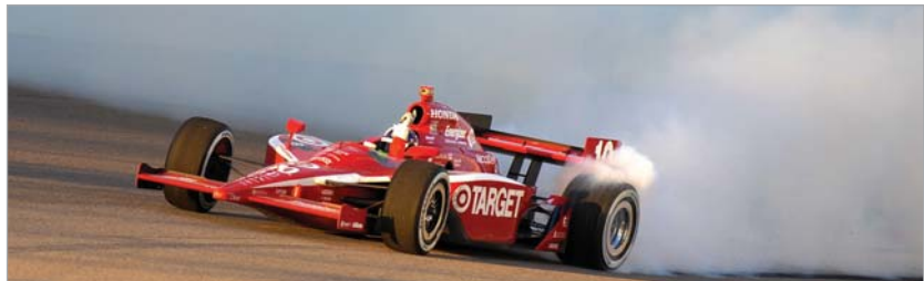
რბოლებს დაბრუნებულმა ფრანკიტომ ჩემპიონის გვირგვინი დაიდგა

შოტლანდიელი დარო ფრანკიტი ზედიზედ მეორედ, ერთი სეზონის გამოტოვებით, ინდი კარის მსოფლიო სერიის ჩემპიონი გახდა. ზედიზედ მეორედ იმიტომ, რომ შარშანდელი სეზონი გააცდინა, მაგრამ, დაბრუნდა თუ არა, მაშინვე ჩემპიონის გვირგვინი დაიდგა.