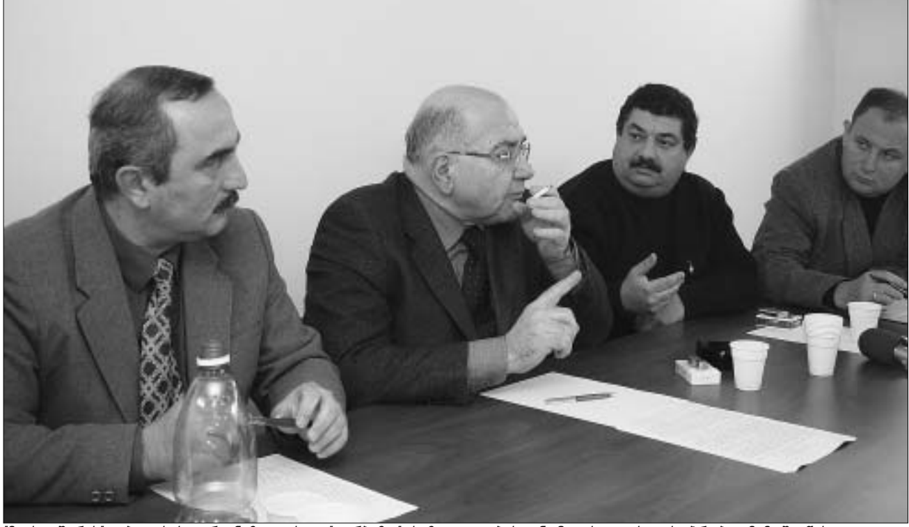
მოქკავშირის თბილისის ორგანიზაციის - "დარბაზი" საზოგადოებასთან ჩატებითი ხიდის პრობლემებზე შეხება.

"მოქკავშირელები" წუხან, რომ მმართველ პარტიასა და მოსახლეო-