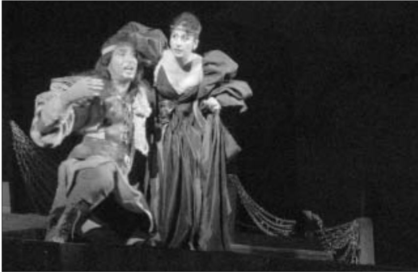
მაკბეტი: სვენა სპექტაკლიდან