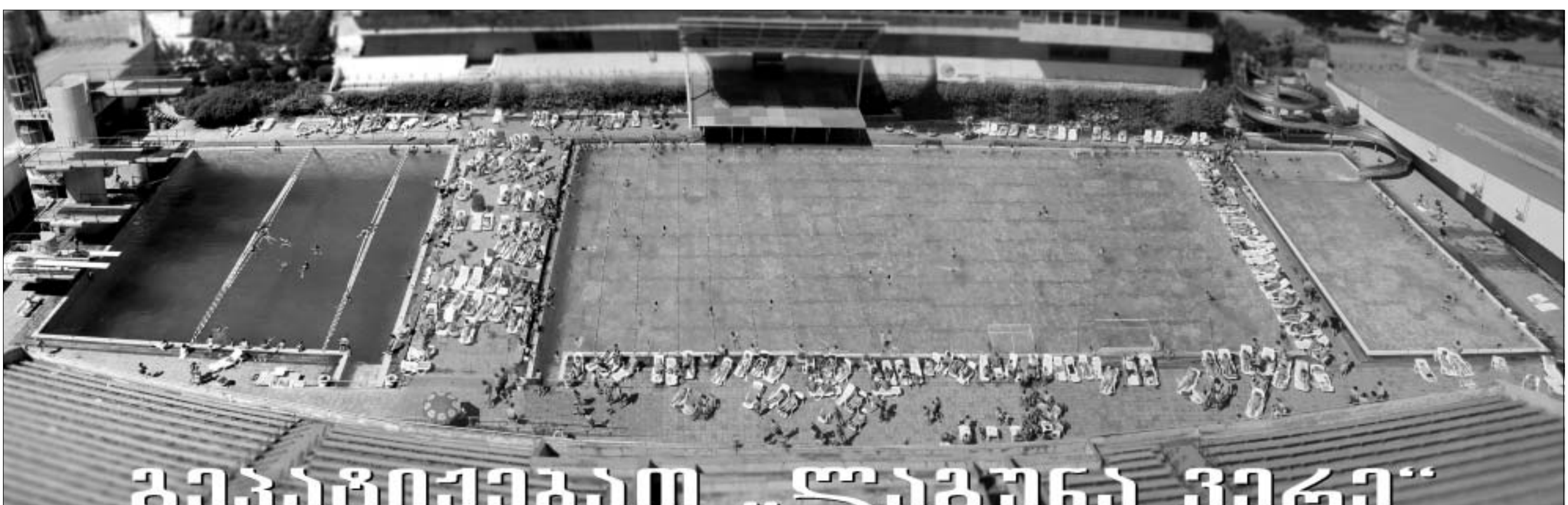
გეპაპოქიშვილი „ლაგუნა ვიკი“

სამთი თილამურები. ამერიკელმა ბოდე მილერმა, მსოფლიო თასზე გვიანტურ სლალომში, მთელი წლის განმავლობაში, ვერც ერთი ეტაპი ვერ მოიგო. ამჯერად, როგორც იქნა, ნავსი გატყდა - იტალიაში, ალტა ბადაში, გვიანტური სლალომის მეთოხე ეტაპზე, მილერმა გაიმარჯვა.