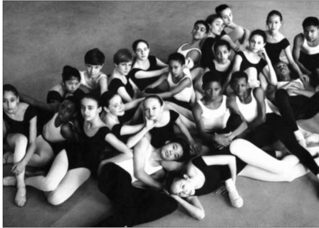
მომავალი მოცეკვავეები ქორეოგრაფიული ცენტრის მოლოდინში

ბალერონი ნიუ-იორკში ახალი პროექტით ბრუნდება