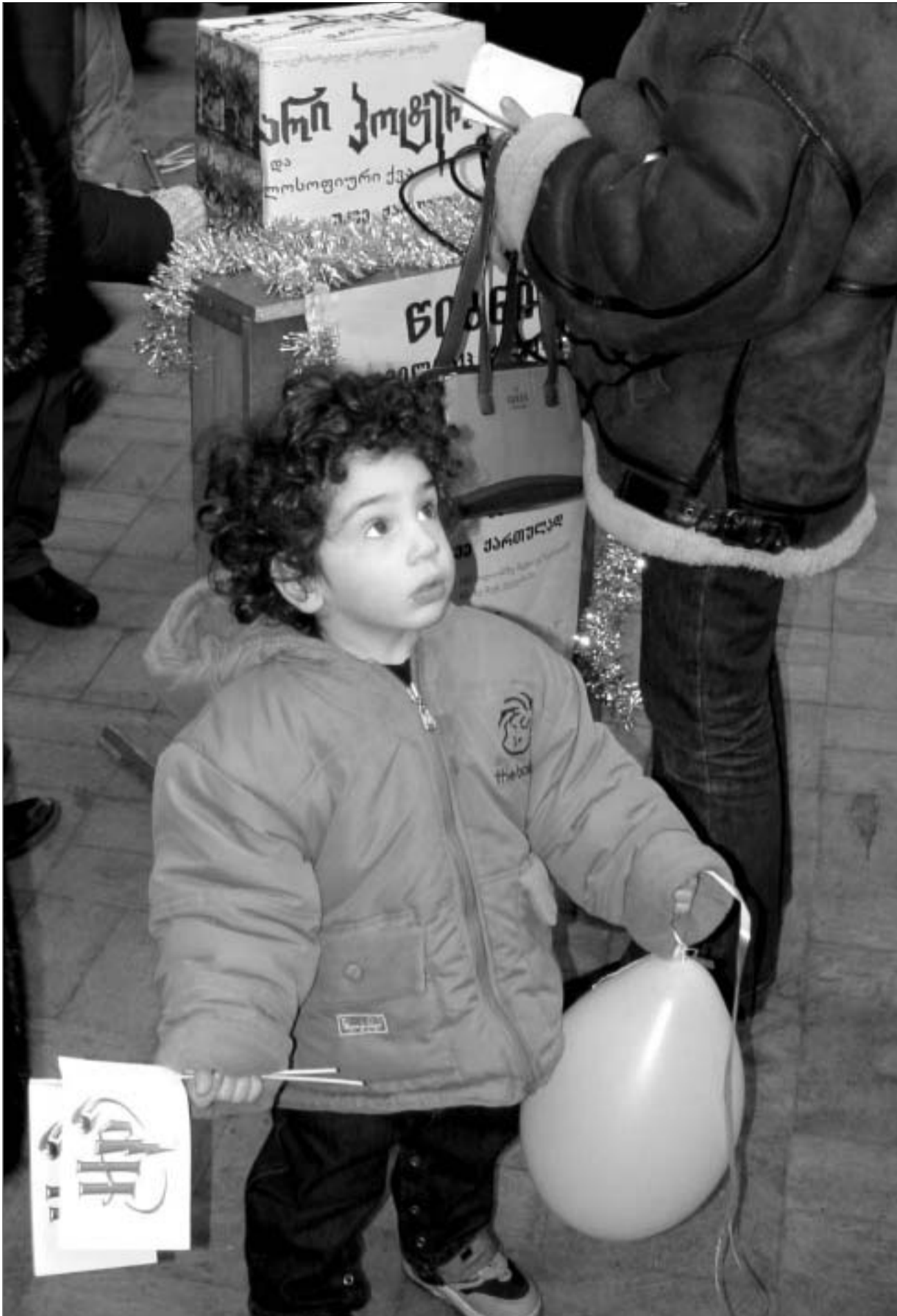
პარი პოეტის კიდევ ერთი ფანი