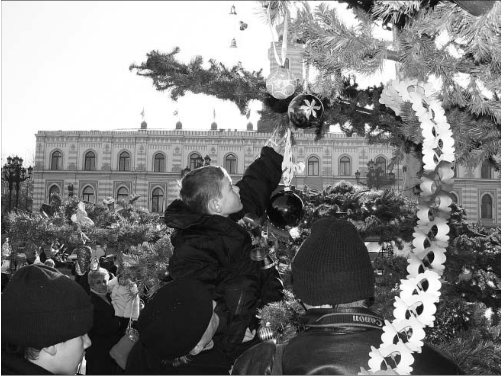
თბილისელები ნაძვის ხეს საკეთარი ხელით რთავენ.