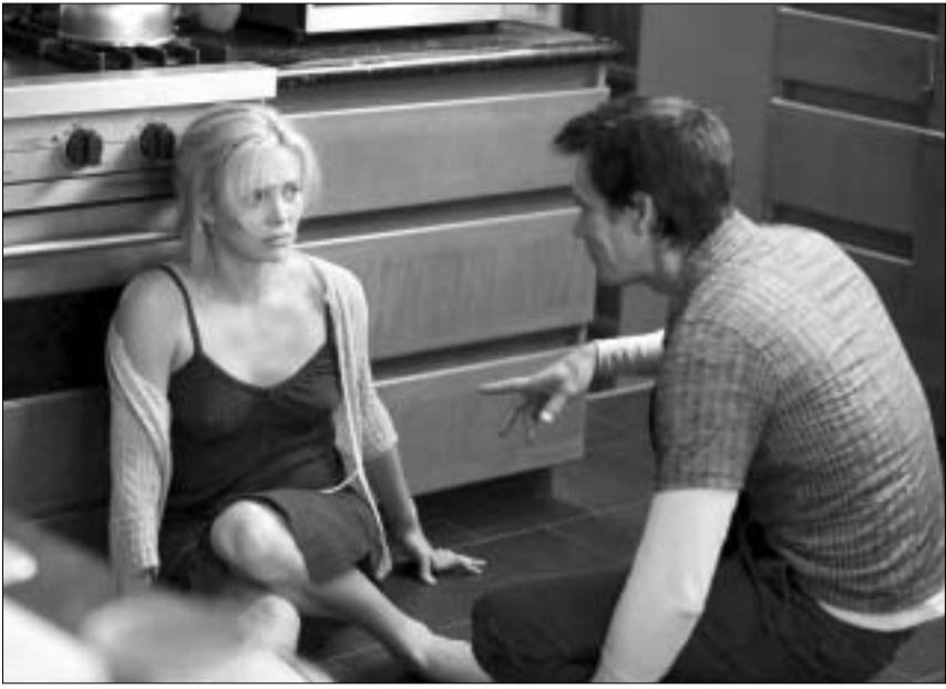
რეჟისორი: ლუსი მანდოკი მთავარ როლებში: შარლოზ ტერონი კევინ ბეიკონი კორტნი ლავი სტიუარტ ტუნსენდი

ამერიკულ ფილმებში იმდენად დეტალურადაა სხვადასხვა სახის დანაშაული აღწერილი, რომ კრიმინალურ სამყაროს, პოლიციის ფილმების "ინსტრუქციების" მიხედვით, შეუძლია თავისი მავი საქმის კეთება. ამერიკაში ჯერ ასეთ ფილმებს აწარმოებენ და მერე უკვირობენ, ჩვენთან დანაშაულებებმა იმატაო! თურთმეტი სექტემბრის ტერაქტიც ხომ ძალიან ჰგავდა მესამეხარისხოვანი ამერიკული ფილმის სიუჟეტს და ამიტომაც იყო რეალურად მომხდარი ტრაგედია ასეთი დაუჯერებელი. "24 საათში" ორი ცნობილი მსახიობი თამაშობს, შარლოზ ტერონი და კევინ ბეიკონი. კევინ ბეიკონს რაც შეეხება, სხვადასხვა ფილმებში მისი თამაში კარგ და სასიამოვნო შთაბეჭდილებას ტოვებს, ის ერთნაირად დამაჯერებელია გამძვინვარებული უჩინო მანინის თუ ბავშვების გამტაცებლის როლში. მის კარიერას ერთ-ორ გახმაურებულ ბლოკბასტერში მონაწილეობა აკლია, თორემ დარწმუნებული