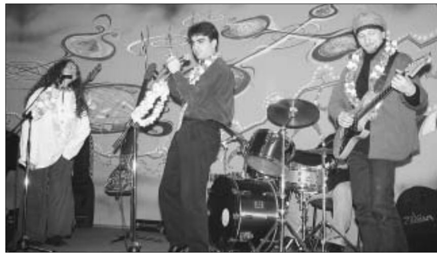
"ინსაიტი" კლუბის პრეზენტაციის ხე

"ნოა-ნოა" - თბილისური "ტუსოკის" ახალი ღამის სათევი