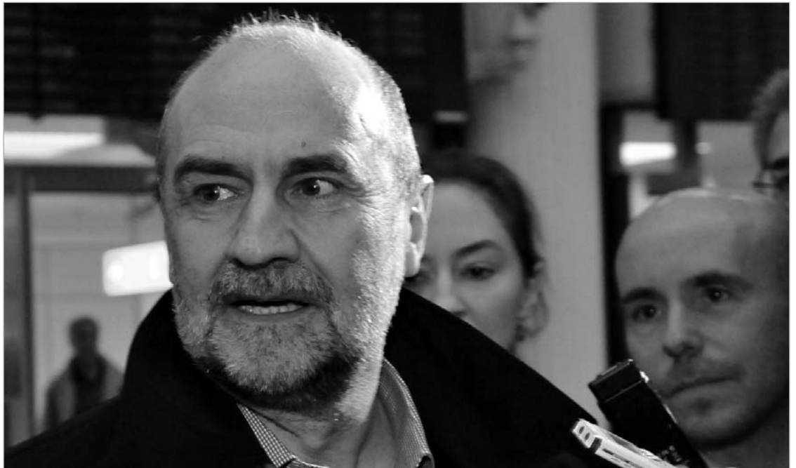
ბირთვული სააგენტოს ინსპექტორები ვენის აეროპორტში.

ქვეყნის ხელმძღვანელობამ უარი განაცხადა ქვეყნიდან ურანის მარაგის 75 პროცენტის ერთდროულად გატანაზე. მათი აზრით, ეს საფრთხის ქვეშ დააყენებს ირანის ისლამური რესპუბლიკის უსაფრთხოებას. ისინი თანახმა არიან, რუსეთში ურანი რამდენიმე პარტიად ჩაიტანონ და საბოლოო პროდუქტი ასევე წელწელ - პარალელურ რეჟიმში მიიღონ უკან. ექსპერტების აზრით, სიტუაციის ასეთი შემობრუნება დასავლეთის უკმაყოფილებას გამოიწვევს, რომლებიც ისედაც მიიჩნევენ, რომ ირანი სამყაროში ატომურ პროგრამას ბირთვული იარაღის წარმოების შესანიშნავად იყენებს. გუშინ ირანის პრეზიდენტმა მაჰმუდ აჰმადინეჯადმა ქალაქ მაშხადში სიტყვით გამოსვლისას განაცხადა, რომ "შექმნილია პირობები ბირთვულ სფეროში საერთაშორისო თანამშრომლობისთვის" და "მისაღებად ამ საკითხებზე მოლაპარაკებებს ატომური ენერჯის საერთაშო-