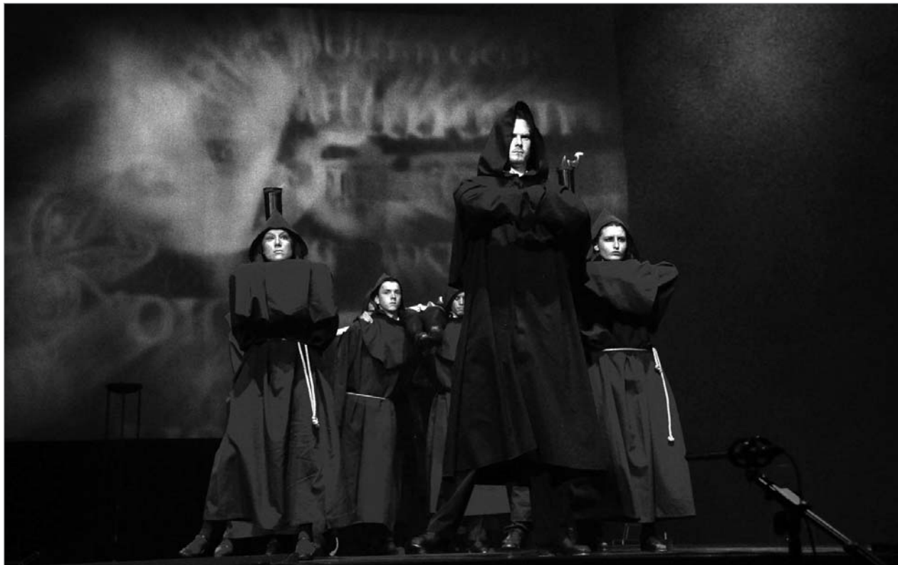
"Magic of the dance" - შოუ თბილისში