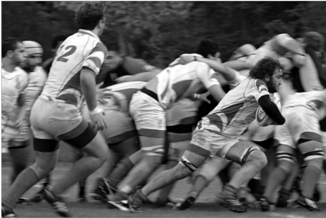
პატარა "ბორჯღალოსნებმა" რუს "დათებს" ორი ლელო აკემეს.