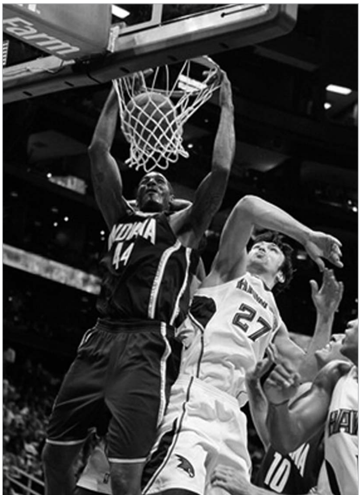
ფარულიას სეზონის პირველი მატჩი არ გამოუვიდა

თავისი პირველი მატჩი გამართა NBA-ს რეგულარულ სეზონში ზაზა ფარულიას "ატლანტა ჰოუქსმა". ჯორჯიელებმა საკუთარ "ფილიპს არენაზე" "ინდიანა პეისერზს" უმასპინძლეს და მეტოქე 120:109 დაამარცხეს. ზაზა ფარულიას წვლილი ამ გამარჯვებაში არც ისე დიდაა. მართალია, საქართველოს ნაკრების კაპიტანმა მოედანზე 17 წუთი დაჰყო, მაგრამ ქართველი ცენტრის მონაგარი სოლიდური არ ყოფილა. ამის მიზეზი ალბათ ის არის, რომ მან ახლახან მოიშუშა ტრავმა.