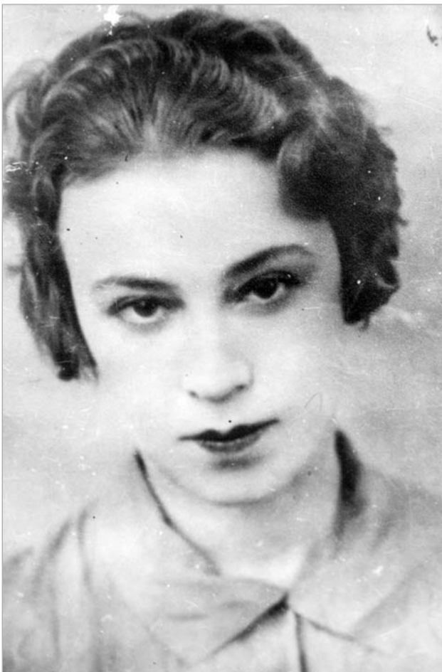
თამარ ნულუკიძე - რეპრესირებული

საზოგადოების ინდივიდუალულობა - აი, ამაზეც წუხან საზოგადოების წევრები. მათთვის, რომლებმაც ძალა და ენერჯია უდანაშაულოთა ხსოვნის უკვდავყოფას შეაღიეს, მტკივნეულია გულგრილობა, რომელიც გამეფებულია და ადამიანებს, განსაკუთრებით კი ახალგაზრდებს, საკუთარი ქვეყნისა და ხალხის ისტორიის ცოდნაში უშლის ხელს. არადა, ეს ის შემთხვევაა, რომელიც უნდა გვახსოვდეს, თუნდაც იმიტომ, რომ არ გავიმეოროთ ის, რაც მოხდა და ვისწავლოთ დაფასება, თანაგრძნობა... "კავკასიურ სახლში" ორგანიზებული გამოფენა, რომელიც რეპრესირებულ ქალებს ეძღვნება, ბევრს ჯერ არ უნახავს, ამიტომაც გაცნობებთ, რომ მისი დათვალიერება 20 ნოემბრამდე შეგიძლიათ. საპატრიო ადგილასაა გამოფენილი დახვრეტილ ქალთა: ვერა ასათიანის, ამელია ელიაშვილის, ოლღა ოკუჯავას, ლილია გასვიანის, ვერა ვარაზაშვილის, მარია ორახელაშვილის, ოლღა სვა-