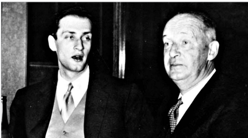
დიმიტრი და ვლადიმერ ნაბოკოვები

ვლადიმერ ნაბოკოვის შვილი, დიმიტრი, კარგა ხნის განმავლობაში ორჭოფობდა: ვერ გადაეწყვიტა, მამის უკანასკნელი სურვილი შეესრულებინა და დაუსრულებელი რომანი გაენადგურებინა, თუ გამოექვეყნებინა. 2008 წლის ბოლოს, მან არჩევანი გააკეთა. ნიგნი 2009 წლის 17 ნოემბრიდან ამერიკული მაღაზიების დახლებზე გამოჩნდება, რამდენიმე დღეში კი რუსულად ნაკითხვაც გახდება შესაძლებელი. მის გასაფორმებლად ბოტიჩელის ცნობილი ნახატი - "გაზაფხული" იქნება გამოყენებული. აღსანიშნავია, რომ რომანის ნაწილი უკვე დაიბეჭდა ამერიკულ ჟურნალში Play Boy . დიმიტრი ნაბოკოვის მტკიცებით, მამამისი უკანასკნელი რომანი - "ლაურა", მის წინა რომანებს არაფრით ჰგავს და ერთგვარ შედეგარადაც შეიძლება ჩაითვალოს. გარ-