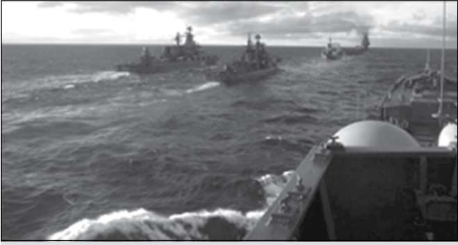
ოფიციალური თბილისი რუსეთის მიერ შავ ზღვაში სამხედრო ნავთობის დაწყების გამო შეზღუდვა

საქართველოს საგარეო საქმეთა სამინისტროს შემოფოტებას გამოთქვამს რუსეთის ფედერაციის პრეზიდენტის გადაწყვეტილებასთან დაკავშირებით, რომელიც შავი ზღვის რეგიონში რუსული შეიარაღებული შენაერთების ფართომასშტაბიანი წვრთნების მოულოდნელად დაწყებას ითვალისწინებს.