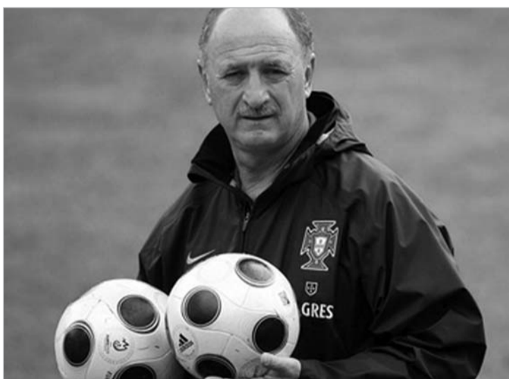
სკოლარის "რეალში" გადასვლა არ ეჩქარება

- "რეალში" გადასვლა მისთვის სწორი ნაბიჯი იყო, რადგან ინგლისში გარკვეული ეტაპი დასრულდა. იქ მან ყველაფერი მოიგო. ამის შემდეგ მოტივაცია კლებულობს. ახლა მადრიდში