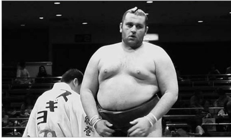
გაგამარუმ პირველი გამარჯვება იხიმა

გუშინდელ დღეზე საუბარს რანგით დაბალი - ჭუროს დივიზიონით დაიწყებთ. სუმიოს ელიტაში მოხვედროლმა გაგამარუმ გუშინ