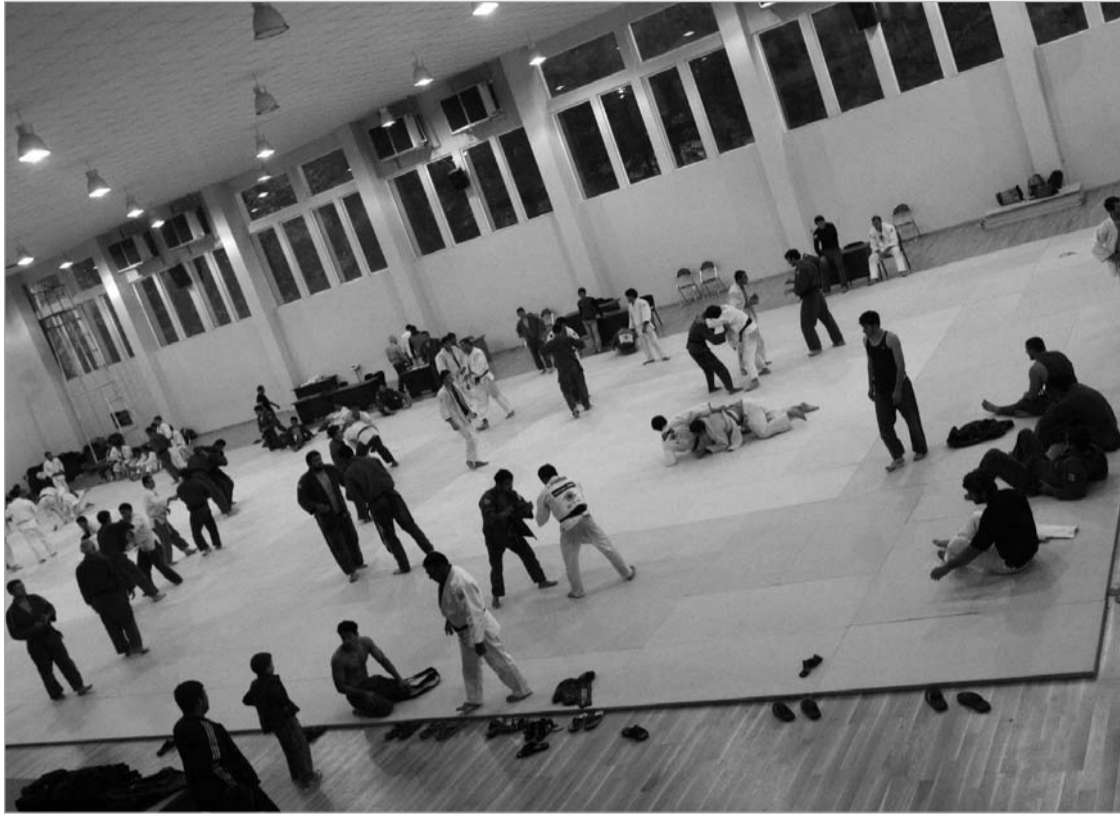
საქართველოს ახალგაზრდული ნაკრები შეკრებას დღეს დაასრულებს

“ევროპის ჩემპიონატისთვის დასკვნით შეკრებას გაფართოებული შემადგენლობით გავდიოდით. ნაკრების კანდიდატებს დიღმის დარბაზში ვაკვირდებოდით, განაცხადში კი საქართველოს ჩემპიონები შევიყვანეთ. ბიჭ-