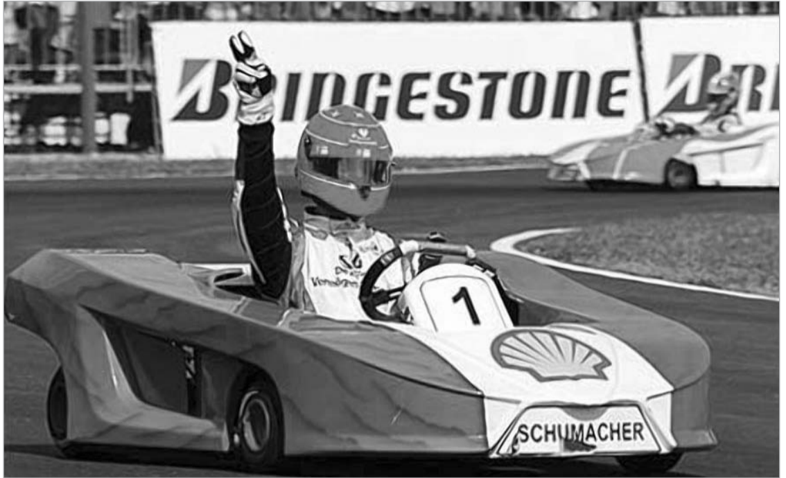
უქმეებზე შუმახერმა ფელიქს მასას ორგანიზებულ საქველმოქმედო ტურნირზე კარტინგის რბოლა მოიგო

მაგრამ "ფერარიში" ორივე ადგილი დაკავებულია. ერთი გუნდის სამი მანქანით გამოსვლის შანსი კი პრაქტიკულად არ არსებობს. სხვა კონკურენტუნარიანი გუნდი, რომელში ყოფნაც შეიძლება შუმახერმა ისურვოს, "მერსედესია", რომელიც ჯერ მხოლოდ ერთი პილოტი ჰყავს, მეორის დასახელებას კი არ ჩქარობს.