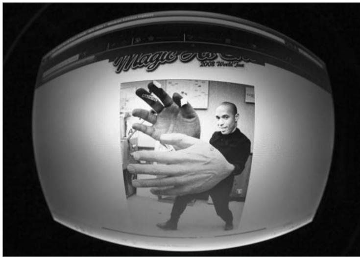
ანრის ხელს "ფასი" დაედო

ნესბურგის გუშინდელ პრეს-კონფერენციაზე ფიფას შვეიცარიელმა მესაჭე ზეპ ბლატერმა თქვა, მათ (ირლანდიელებმა) მოგვემართეს თხოვნის ნერი-