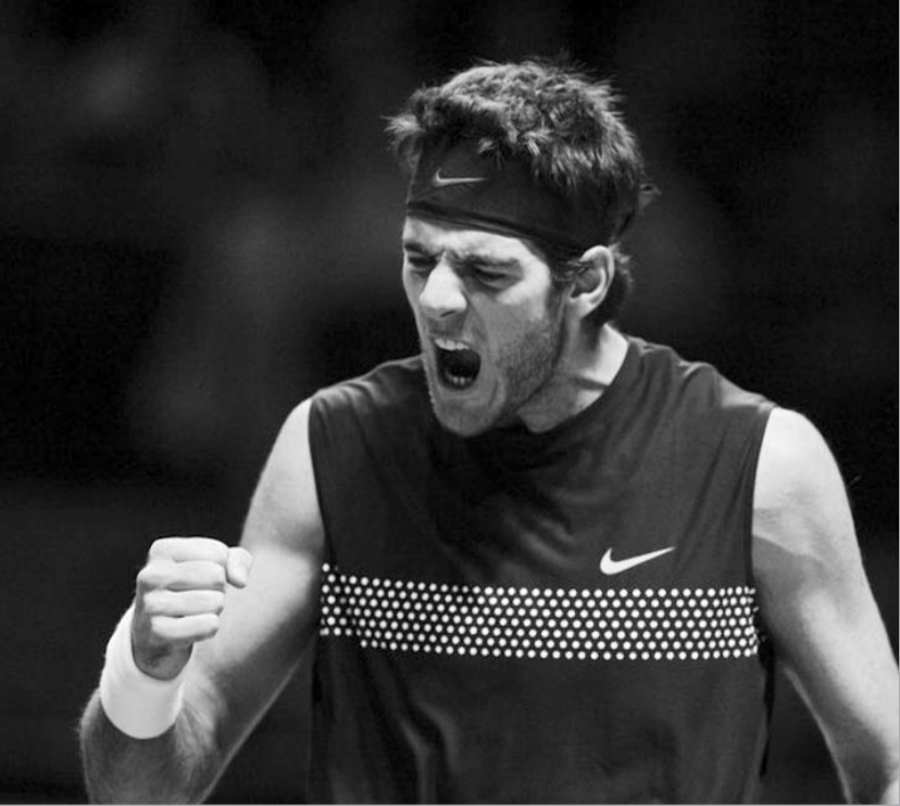
ხუან მარტინ დელ პოტრო