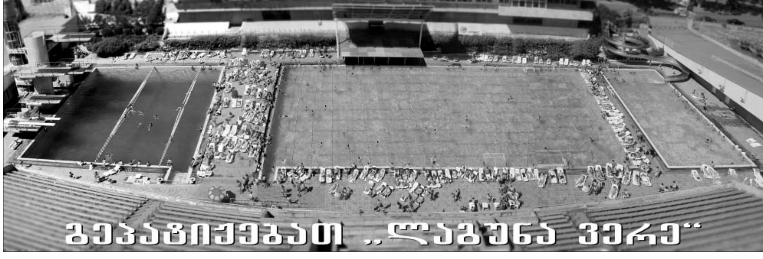
გეგმაზონიშენების „ლაგუნა ვეჩი“