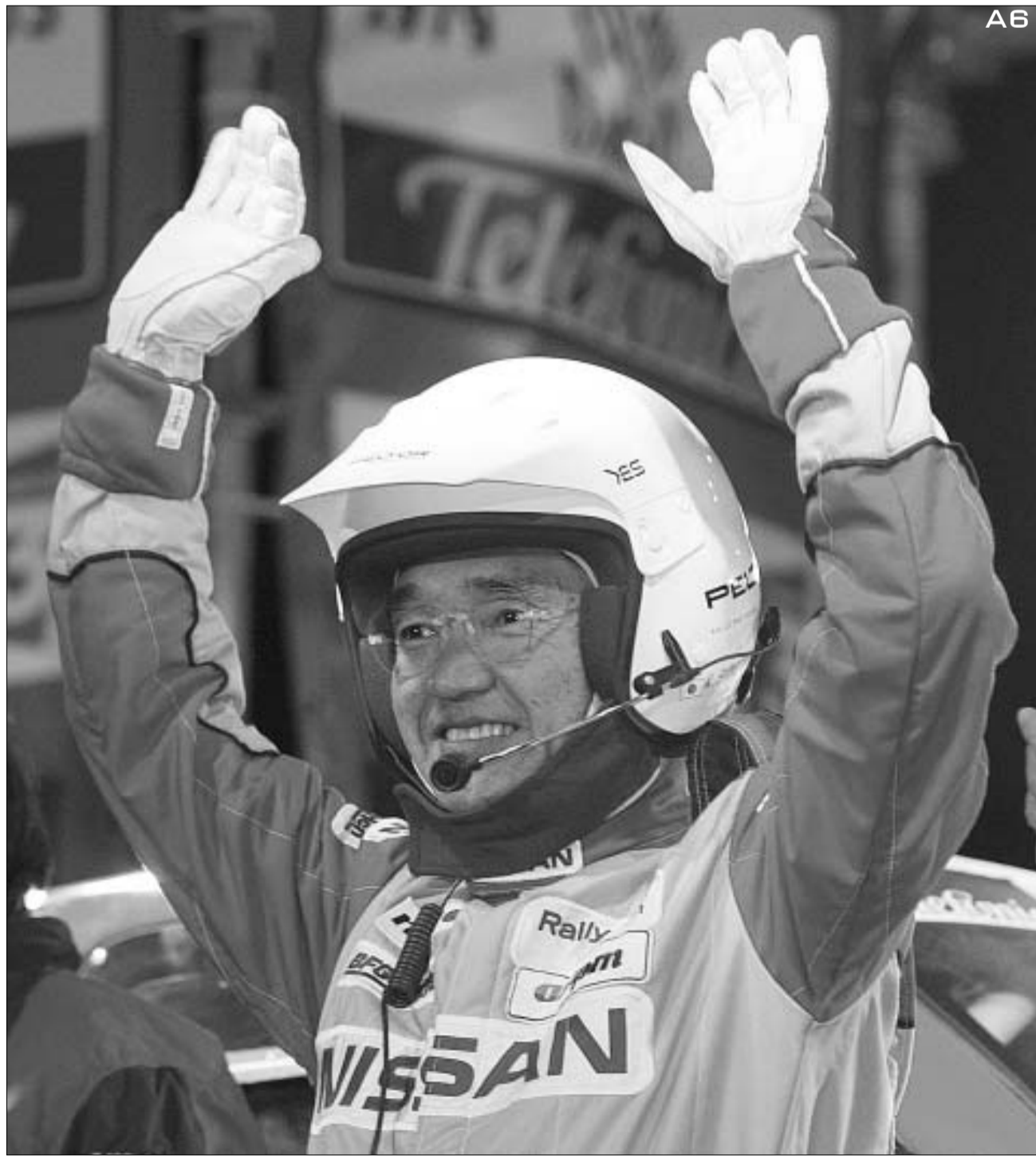
პარიზი-დაკარის ერთ-ერთი ლიდერი კენჯირო შინიუკა.