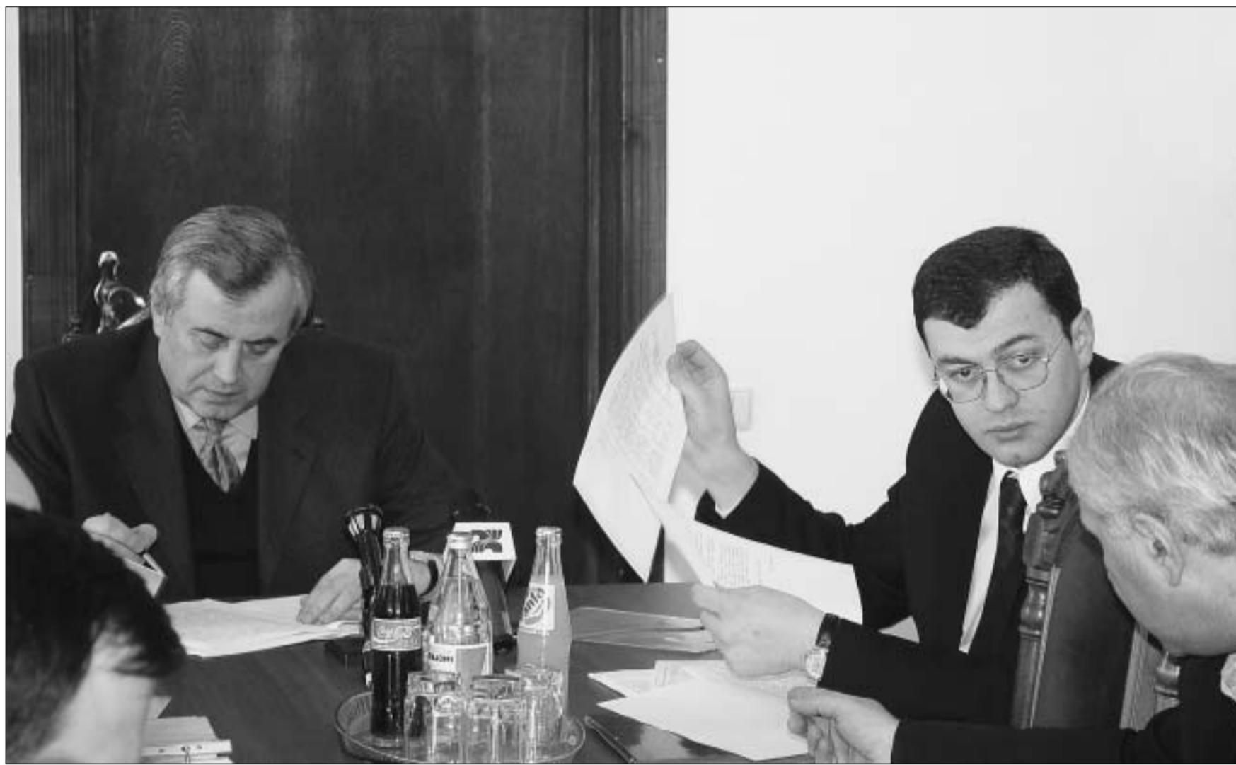
მთავრობამ ეკონომიკის ოპტიმიზმის რეცეპტი გამოიწერა.