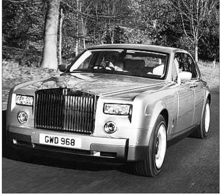
ბაზრძილა A4 ბვირძილა

მიმდინარე კვირა ისტორიულია ცნობილი გერმანული ავტომწარმოებლის, "ბეივესისთვის." "როლს-როისის" ხელში ჩაგდებად პირველად კომპანია ამ ლეგენდარული მარკის პირველი საკუთარი მოდელი წარმოადგინა - "როლს-როის ფანტომი", რომელიც 382 ათასი დოლარი ეღირება. ახალი "ფანტომი" თავისი დიზაინით "როლსის" 61-იანი წლების სახელგანთქმულ მოდელს, "სილვა ქლაუდსა" და "სილვა გოუსის" მოგვაკონებს. "ბეივეს" ხელმძღვანელთა თქმით, ახალი მოდელი მსოფლიოს ყველაზე სახელგანთქმული მარკის ულტრაათანად ედროვე ინტერპრეტაციაა.