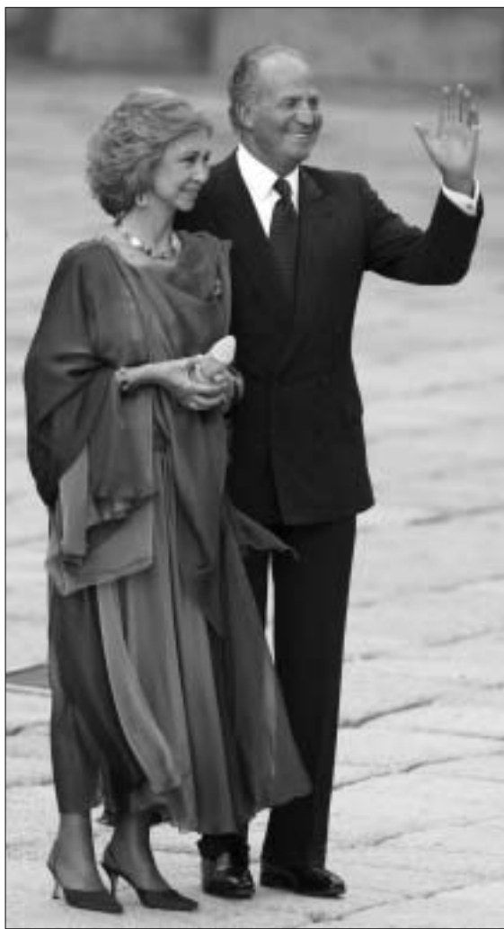
ხუან კარლოსი მეუღლესთან ერთად

ესპანელ ბურჰოზთა დინასტიის წარმომადგენელი, ხუან კარლოს I,