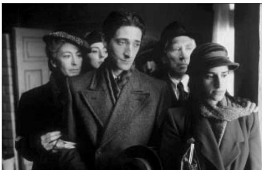
კადრი ფილმიდან "პიანისტი"

პოლანსკის სრული ტრიუმფის მიუხედავად კინო-კრიტიკოსებმა აღფრთოვანება ვერც აღფონსო კუარონის განმარტებული ფილმის Y Tu Mama Tambien-ის მიმართ დამატეს