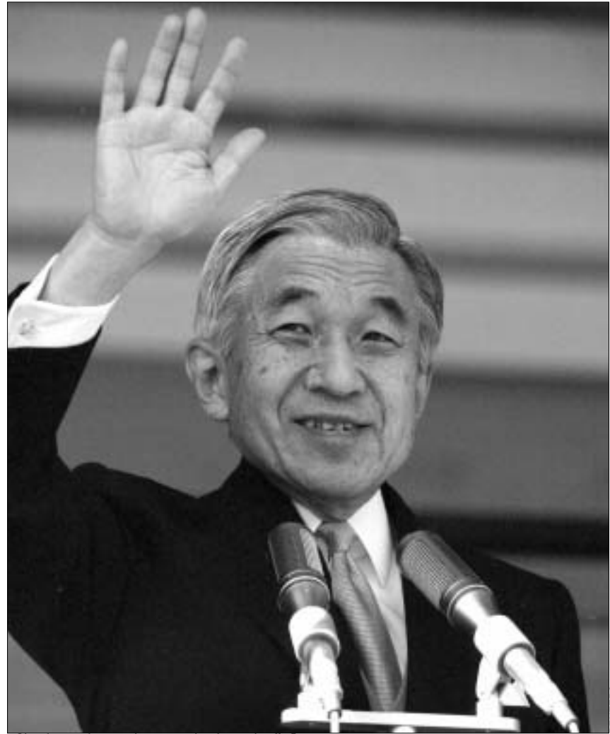
იმპერატორი აკიჰიტო ოპერაციის წინ.

იაპონიის იმპერატორს გუშინ ქირურგიული ოპერაცია ჩაუტარდა, რომელიც ექვს საათს გაგრძელდა. 69 წლის იაკონიელი მონარქის გაკვეთის მიზეზად პროსტატის კიბო იქცა. მას ეს დიაგნოზი ჯერ კიდევ გასული წლის დეკემბრის ბოლოს დაუდგინეს. ექიმები იმედოვნებენ, რომ იმპერატორი აკიჰიტოს სრული გამოჯანმრთელებისათვის კარგი შანსები აქვს, რადგან ავადმყოფობა მას აღრეულ სტადიაში აღმოუჩინეს და ორგანიზმში კიბოს მეტასტაზები ჯერ კიდევ არ იყო განვითარებული. მსოფლიოში დღემდე არსებული უძველესი მონარქიის იმპერატორის აკიჰიტოს მონაპოვიაზეცაა გასულ ხუთშაბათს მოხდა, მას შემდეგ რაც, იაკონიის მინისტრთა კაბინეტმა იმპერატორის კონსტიტუციური უფლებამოსილება მის უფროს ვაჟს - 42 წლის პრინც ნარუჰიტოს გადასცა. იმპერატორს ოპერაცია ტოკიოს სახელმწიფო უნივერსიტეტის საავადმყოფოში ეროვნული ონკოლოგიური ცენტრის შედგმა ნამყვანმა სპეციალისტმა გაუკეთა. იაკონიის ისტორიაში ეს პირველი პრეცედენტია, როდესაც მონარქის ოპერაცია იმპერატორის სასახლის გარეთ გაუკეთდა. ვარაუდობენ, რომ იმპერატორი აკიჰიტო საავადმყოფოში ერთ თვეს დაჰყოფს, რის შემდეგაც რეაბილიტაციას ტოკიოს ცენტრში მდებარე თავის სასახლეში გაივლის.