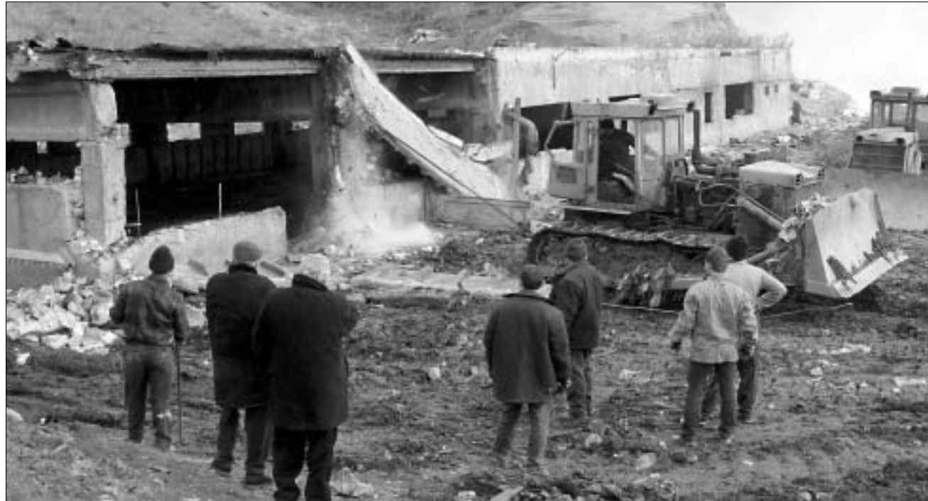
გლდანის ნაგავსაყრელზე სალორები დაანგრეს.

“მერიდან ჩვენ ვერაფერს მოვაგვარებთ. ქალაქის გასუფთავება