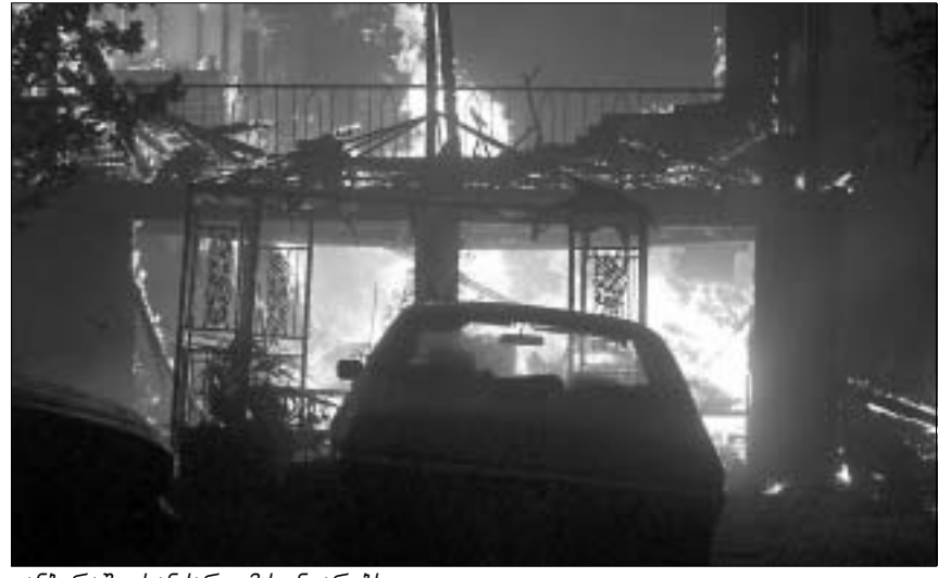
კანბერაში ხანძარი მძინეარებს.

გუშინ ავსტრალიის დედაქალაქ კანბერაში საგანგებო მდგომარეობა შემოიღეს. ამის მიზეზად ტყეში გაჩენილი უძლიერესი ხანძარი იქცა, რომელიც, უკვე კვირაზე მეტია, კანბერას ნაციონალურ პარკში მძინეარებს. პარკი კანბერას დასავლეთით მდებარეობს. ხანძარი გუშინ უკვე ქალაქის საცხოვრებელ რაიონებსაც მისწვდა. ავსტრალიის მასობრივი საინფორმაციო საშუალებების ცნობით, ქალაქის სამხრეთ რაიონში - დაფიში, ცეცხლმა მთლიანად მოიცვა საცხოვრებელი კვარტალი. დაფიდან და ასევე სხვა რაიონებიდან ხელისუფლებამ მოსახლეობის სასწრაფო ევაკუაციის ბრძანება გასცა. კანბერასთან დამაკავშირებელი ყველა კომუნიკაციური საავტომობილო მაგისტრალი გადაკეტილია და ტრანსპორტის მოძრაობა შეწყვეტილია. დედაქალაქის ადმინისტრაციის ხელმძღვანელმა ჯონ სტეპოლმა გუშინ ქალაქში სა-