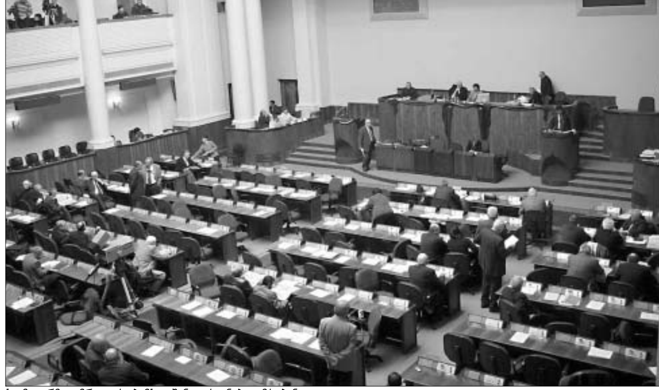
თემატურმა უმრავლესობამ გუშინ დასვენება ამოკონა.

ვიდრე სამთავრობო ფრაქციები “ნეიგრობენ”, ოპოზიცია “ნაყოფიერად” იყენებს მიკროფონებთან მიღებული უპირატესობას და შემთხვევას არ უშვებს ხელს, რომ პროსახელისუფლებო ძალებისა და მათ მიერ მხარდაჭერილი დოკუმენტის გასაკრიტიკებლად. მიხეილ მაჭავარიანის აზრით, თავად ბიუჯეტის პროექტს კენჭი კანონმდებლები ეყარა და აცხადებს, რომ ამასთან დაკავშირებით “გაერთიანებულ დემოკრატებს” განცხადება აქვთ შეტანილი საპროცედურო საკითხებისა და წესების კომიტეტში. თუმცა, ოპოზიციას კარგად მოეხსენება, რომ 17 იანვარს პარლამენტის მიერ მიღებული გადაწყვეტილების განდინების ალბათობა, პრაქტიკულად, წელის ტოლია. ამიტომ აქცენტში უფრო იმაზე კეთდება, რომ მოხდეს პარლამენტში წარმოდგენილი ბიუჯეტის პროექტის დისკრედიტაცია და შემდგომი განხილვების დროს მას, რაც შე-