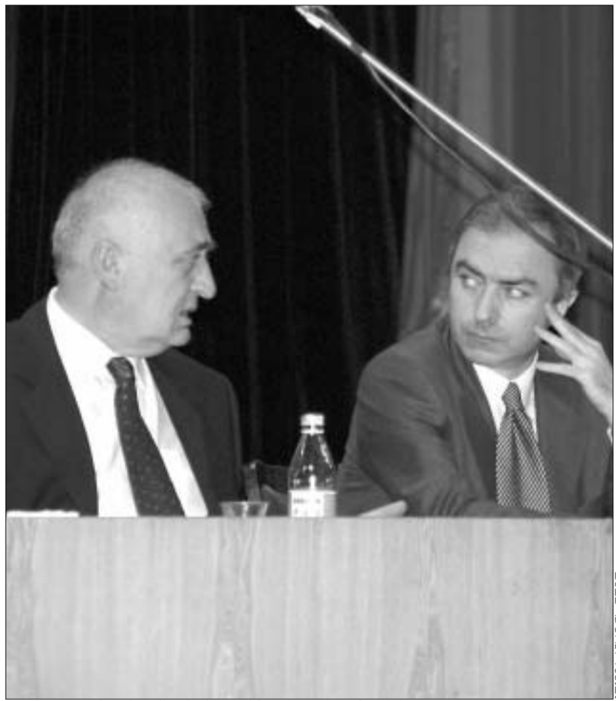
ჭერ კიდევ ზაფხულში "ერთობას" არადერი ემეკრებოდა.

მიუხედავად იმისა, თუ რომელ პარტიას შეერწყება "ერთობის" ორიოდე ათეული წევრი, ცხადია, რომ ამ ორგანიზაციის მთავარი ღირებულება ჯუმბერ პატიავილის პერსონა და მისი შედარებით მაღალი რეიტინგი გახლავთ. ჯუმბერ პატიავილთან დაკონტაქტება, "24 საათის" ინფორმაციით, რამდენიმე ოპოზიციურმა პარტიამ სცადა. მაგრამ, როგორც ჩანს, მიხეილ სააკაშვილმა ყველაზე მეტად იმარჯვა. მას