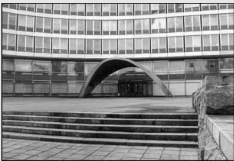
სდს-ს ცენტრალური შესასვლელი

დირექტორი - გენერალ-ლეიტენანტი სერგეი ნიკოლოზის ძე ლებედევი პირველი მოადგილე - ვლადიმერ ზავერჟინსკი მოადგილეები - ალექსეი შერბაკოვი, ივან კოროლოვსკი, ვიქტორ ერინი პრეს-ბიანი - მოსკოვი, იასენევი პრეს-მდივანი - ტატიანა სამოლისი დირექტორის კონსულტანტა ჯგუფის ხელმძღვანელი - ვადიმ კრაზნიჩევი დირექტორის მთავარი კონსულტანტი - ალექსანდრ გოლუბევი