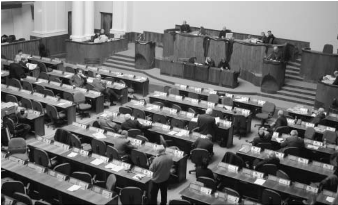
ასე აინტერესებთ ხალხის რჩეულებს ქვეყნის ტერიტორიული მთლიანობის აღდგენა.

უკვე თავისთავად მოულოდნელობაა ის ფაქტი, რომ საქართველოს პარლამენტში აფხაზეთის საკითხის მიმართ ერთმნიშვნელოვანი დამოკიდებულება დაფიქსირდა. ამიტომ თავა ერთხმად იქნა მიღებული (თუმცა, სხვა საკითხი, რამდენად ღირებულია ეს მიმართვა და რა ხარისხით მოახდენს იგი გავლენას რუსეთის ხელისუფლების „აფხაზურ პოლიტიკაზე“). მიუხედავად ამისა უკანასკნელ წუთამდე სახელისუფლებო ფრაქციებისა და ოპოზიციის მოსაზრებებზე და შეფასებებზე მკვეთრად განსხვავებულად ეროვნებისგან. მმართველი ძალის წარმომადგენლე-