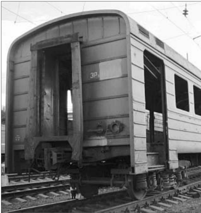
საქართველოს რკინიგზის "კომფორტული" ვაგონი

საბოლოოდ, რკინიგზის მიერ სამგზავრო ტარიფების გაზრდა იმას დაბრალდა, რომ რკინიგზის მარგეულირებული ორგანოს შექმნის საკითხი, ჯერჯერობით, გადაწყვეტილი არ არის. როგორც გაიარკვა, ტრანსპორტისა და კომუნიკაციების სამინისტრომ დროულად არ შექმნა