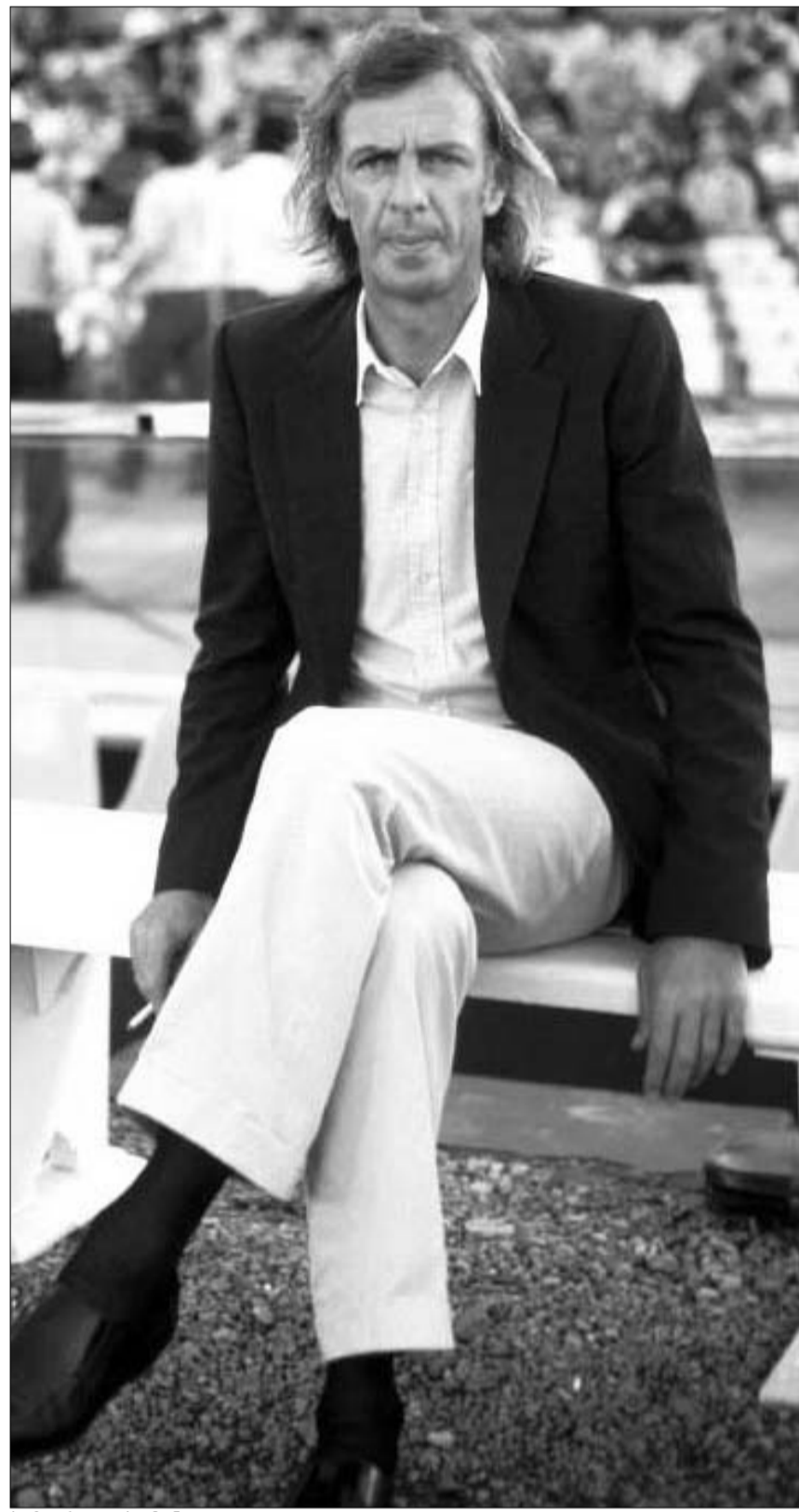
სეზარ ლუის მენოტი

მიუხედავად იმისა, რომ გუნდი ლისაბონში იყო, არც ერთი ნუსით არ შეხელებულა ციებ-ციხელება ბარსელონაში, კლუბის ოფისში. ხელმძღვანელობა განაგრძობს ახალი მწვრთნელის ძიებას, თანაც, შესაძლო კანდიდატა სიაში ახალ-ახალ გვარებს უმატებს. როგორც გაუწყით, დასახელებულ კანდიდატა დიდმა ნაწილმა უარი განაცხადა, სადაც თავი უნდასა დატოვებდა "ბარსელონას", მაგრამ არიან ისეთებიც, რომლებიც აქტიურობენ და გასპარს თვითონ ურეკავენ. მაგალითად, რუმინელი გეორგე ჰავი. "ბარსელონასა" და "რეალის" ყოფილი ნახევარმცველი ტელეფონით დაუკავშირდა გასპარს და თავისი სამსახური შესთავაზა,