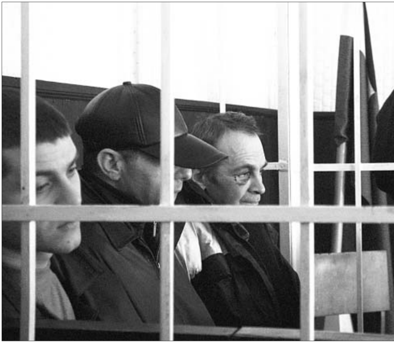
ჩეჩენი პატრონიპრეის სასამართლო პროცესზე

დოკუმენტების გასაცნობად 10 - დღიანი ვადა დათქვა და პროცესი ამ მიზეზით გადადო, გუშინ კიდევ ერთხელ გადავადგა სრულიად გაუთვალისწინებელი მოვლენამ გამოიწვია. კერძოდ, ანონიმი აბონენტის მიერ ტელეფონით მიწოდებულმა ინფორმაციამ იმის თაობაზე, რომ მთავრობა-კრწანისის სასამართლოს შენობაში დიდი რაოდენობით ასაფეთქებელი ნივთიერებაა ჩადებული - სასწრაფოდ დაცლილი შენობიდან გამოყვანილი პატრონიპრე გაცივრებული დაცვის თანხლებით გაამგზავრეს საპრობოლემო. მოგვიანებით კი, როცა უშიშროების სამინისტროს შესაბამისმა სამსახურებმა კინოლოგთა დახმარებით შეამოწმეს მთელი შენობა და საეჭვო ვერაფერი აღმოაჩინეს, პატრონიპრე დაბრუნება სხდომათა დარბაზში სხვადასხვა ტექნიკური მიზეზების გამო ვეღარ მოხერხდა. ჩეჩენი პატრონიპრეის გულშემატკივრები მიიჩნევენ, რომ ასაფეთქებელი ნივთიერების შესახებ ინფორმაცია განვრცად გაერცხლდა, რათა ხელისუფლებას პატრონიპრეის სასარგებლოდ გადაწყვეტილების გამოტანა თავიდან აეცილებინა. სასამართლოს თავმჯდომარე მამუკა სონღულაშვილი კი ამ მოსაზრების სანინაალმდეგოდ აცხადებს, რომ მას უფლება არ ჰქონდა, შენობის დაცლა არ მოეთხოვა, რადგან ინფორმაცია შენობის დანალმის შესახებ ოფიციალურად იყო დაფიქსირებული.