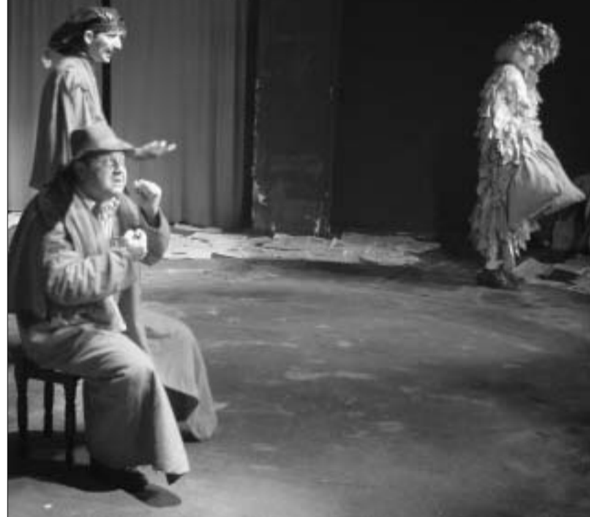
სარდაფში გოდოს ელოდებიან