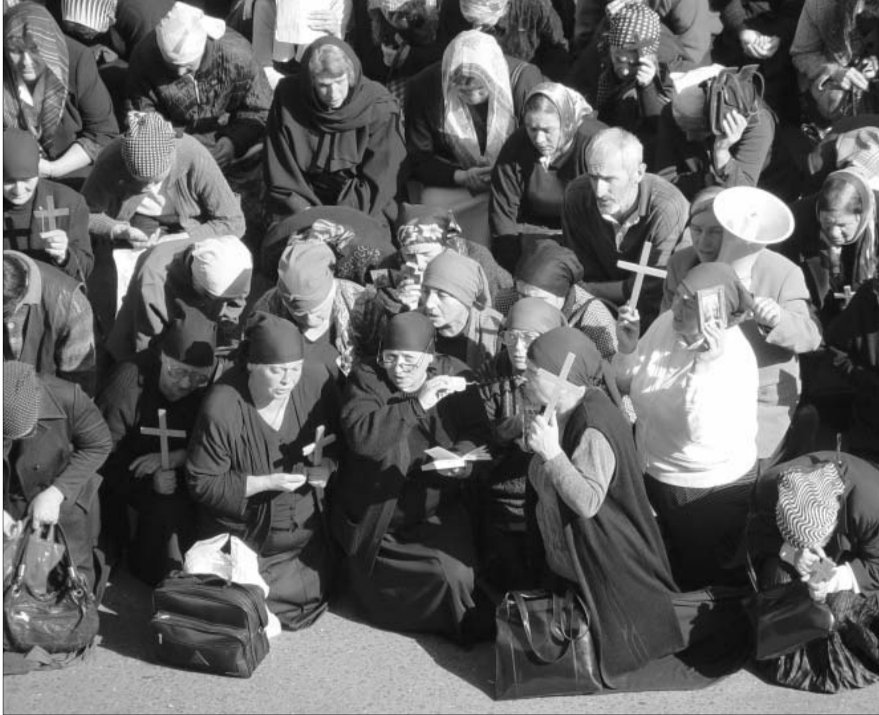
ბასილ მკალავიშვილის მოხსენები.