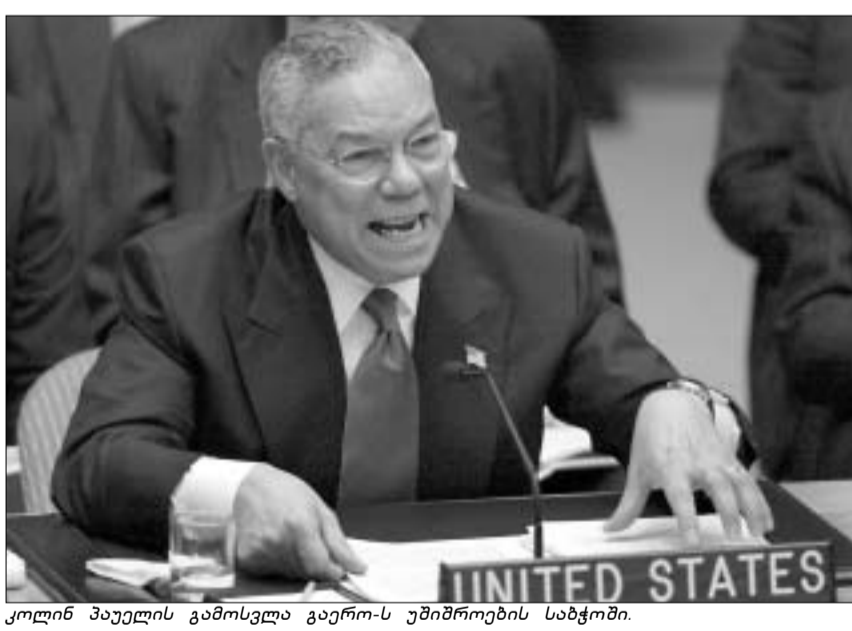
კოლინ პაუელის გამოსვლა გაეროს უშიშროების საბჭოში.