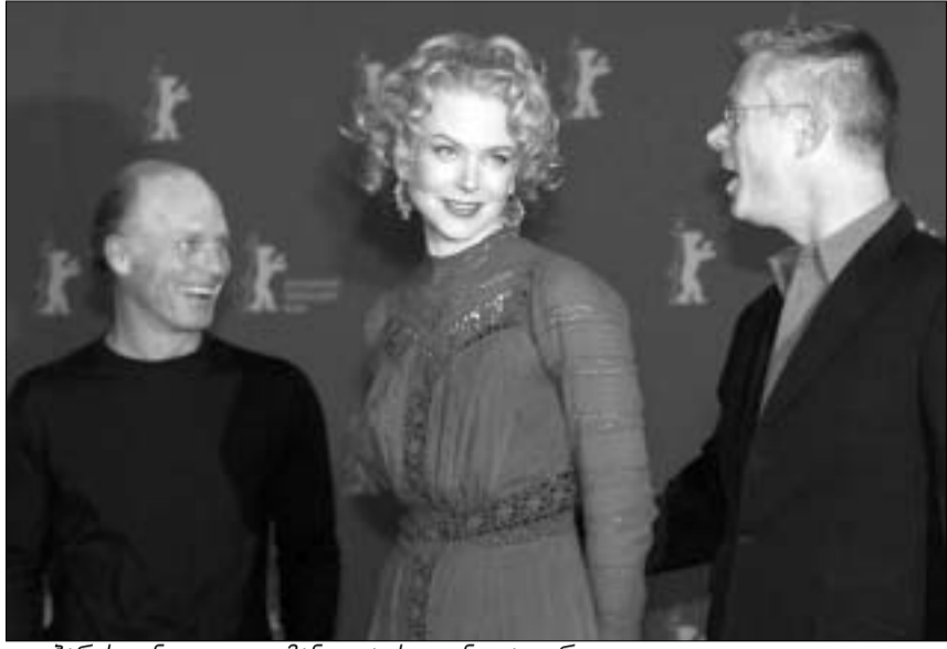
ედ პარისი, ნიკოლ კიდმანი და სტივენ დალდრი

გუშინ "ბერლინალეს" გამარჯვებულები გამოვლინდნენ. კინო-ფესტივალის ფიურის პრეზიდენტმა, კანადელმა რეჟისორმა ატომ ეგოიანმა რიგით 53-ე "ბერლინალეს" საუკეთესო ფილმი დაასახელა. წლებიდანელი "ბერლინალეს" ფავორიტი მაიკლ უინტერბოტომის ფილმი "ამ სამყაროში" აღმოჩნდა. ბრიტანელი რეჟისორის კინოსურათი