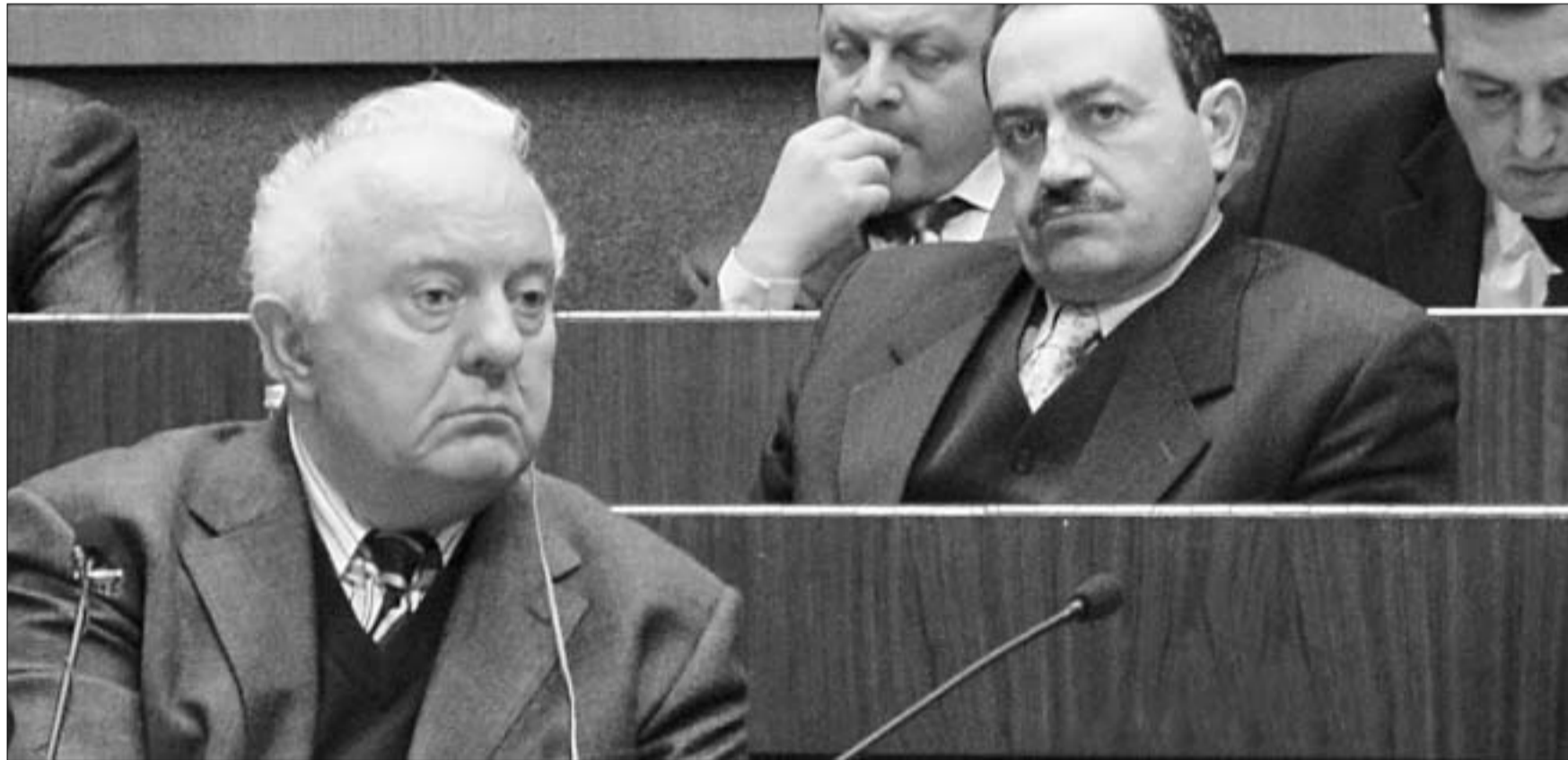
პრეზიდენტი სხვა განზომილებაში.