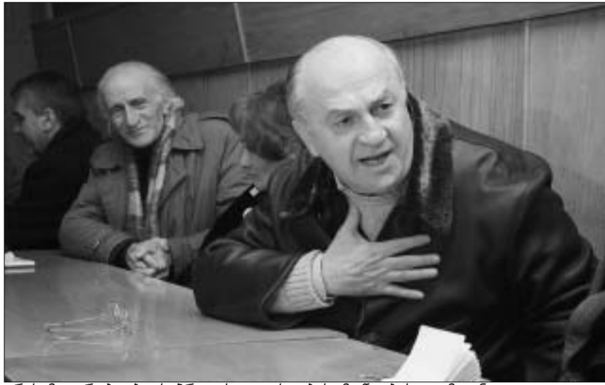
არასამთავრობოები საპროტესტო აქციების მოწყობას გეგმავენ.

"ვაკის გონივრული განვითარების" ოფისში სხვადასხვა არასამთავრობო ორგანიზაციის წარმომადგენლები შეიკრიბნენ. შეკრების მიზანი ბაქო-თბილისი-ჯეიჰანის ნავთობსადენის მშენებლობის საკითხების განხილვა გახლდათ. არასამთავრობოები უახლოეს დღეებში გააქტიურებას და საპროტესტო აქციების მოწყობას გეგმავენ, რათა მილსადენის ბოლომდე გაყვლა აღკვეთონ და, ამასთანავე, საერთაშორისო საზოგადოების ყურადღება მიიპყრონ.