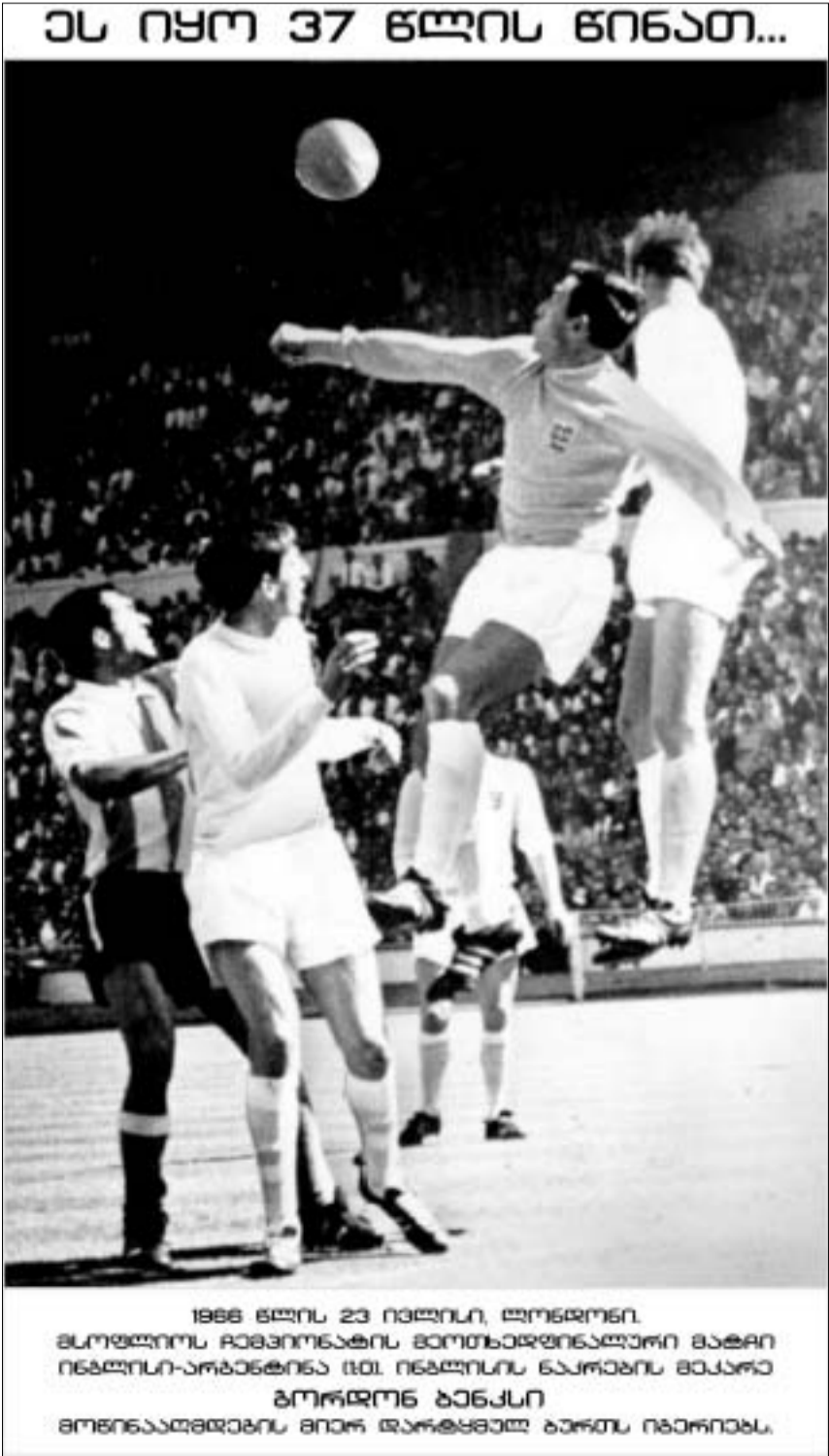
1988 წლის 23 ივლისი, ლონდონი. მსოფლიოს ჩემპიონატის ფინალური მატჩი ინგლისი-არგენტინა (0:1) იმდროინდელი ნაპირის მატჩი. გორდონ ბანკსი მონაწილეობის მიერ დაჯილდოებულია.