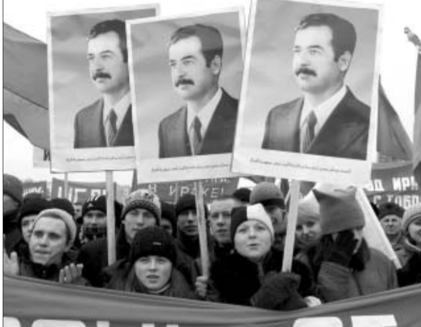
ომის სანიაღვრე დემონსტრაცია ბელოუსში.

თუმცა, ბოლქსმა ისაუბრა იმაზე, რომ ერაყის ხელისუფლებას ჯერაც არ უთქვამს გაერო-სთვის, რა ბედი ენია 30 ათასამდე რაკეტას, აგრეთვე მომზადებულ გაზას და ანთარქის გამომწვევი ბაქტერიის შემცველ იარაღს. ბოლქსმა განაცხადა, რომ მან ჯერ ვერ მიავნო აკრძალული იარაღის კვალს.