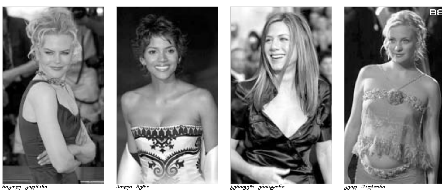
ნიკოლ კიდმანი შოლი ბერი ქენიფერ ენისტონი კიდე ჰადსონი