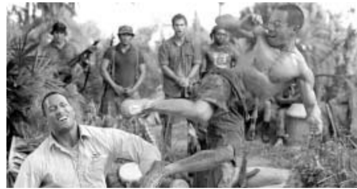
კვირის ყველაზე შეუმსაველიანი ფილმების ათეული აშკარადი კინოსტუდიის მიხედვით