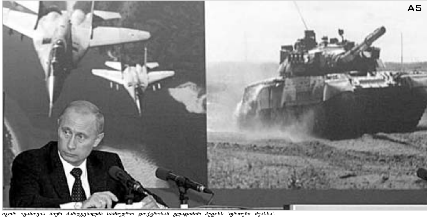
ვიტორ ივანოვის მიერ წარდგენილი სამხედრო დოქტრინამ ვლადიმირ პუტინს „ფრთხი შეასხა“.