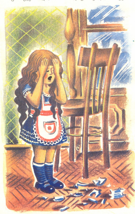
მხატვარი 3აჟა ძურხული

ნათიას დედა ჯერ აბაზანაში ჭყუმპალაობდა, მერე სარკის წინ კეკლუცობდა, ბოლოს გამოეწყობოდა, ნათიას დაუბარებდა, არაფერი