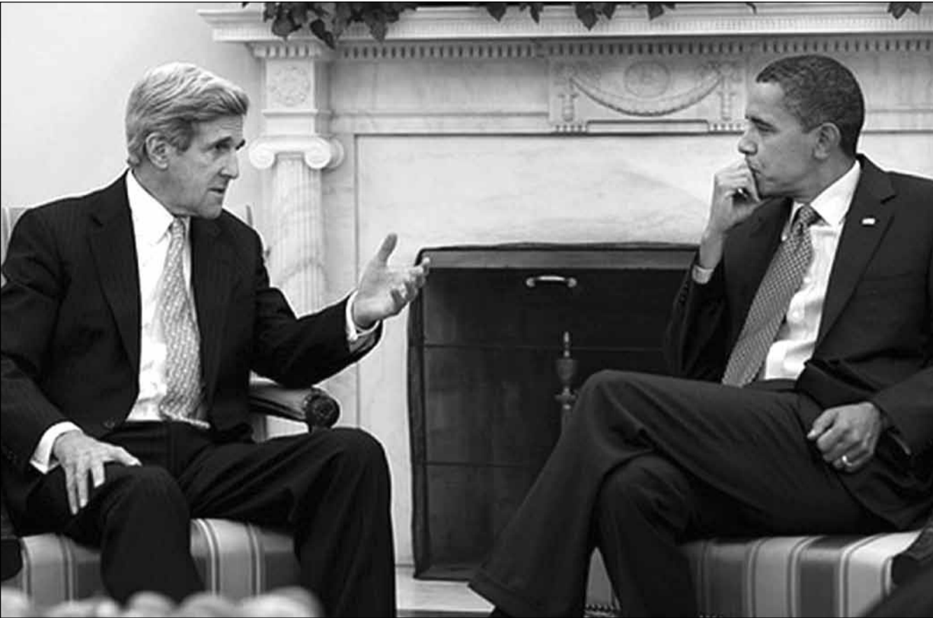
ობამას მარცხი და რუსეთის დიდ სცენაზე ცრიუმფით დაბრუნება

დღეს პრეზიდენტსა და სახელმწიფო მდივანს მსხვილ დიპლომატიურ მარცხში ადანაშაულებენ, რის შედეგადაც, შტატებმა საერთაშორისო დონეზე დაკარგეს არნახულად მყარი პოზიციები, შეილახა მისი ავტორიტეტი, უღალატეს მოკავშირეებს და კვლავ წინ წამოწიეს რუსეთი, თუმცა ვაშინგტონისა და მისი მოკავშირეების, სირიის შემთხვევაში კი, უმთავრესად, პარიზის მიერ წამოწყებული ავანტიურა თავიდანვე განწირული იყო და უმთავრესად, იმიტომ, რომ თითქმის ორი წლის განმავლობაში ვერ გაერკვნენ ასადის ოპოზიციის არსში, ვერ აწონ-დაწონეს სამოქალაქო ომიდან და მისი შედეგებიდან გამომდინარე საფრთხეები, ვერ ჩამოაყალიბეს თავიანთი მიზნები და ამოცანები.