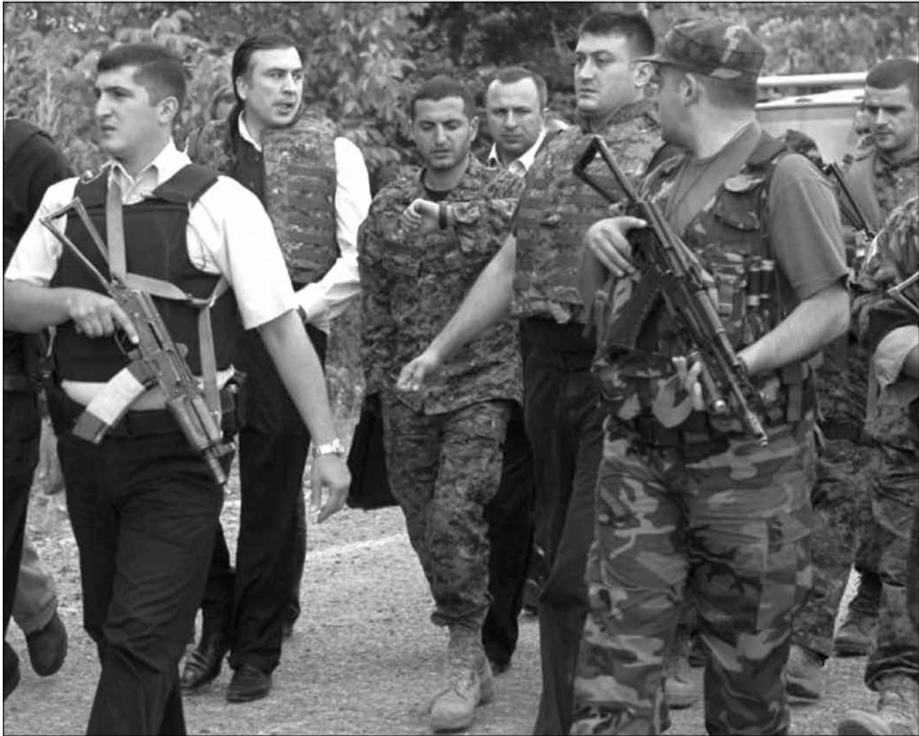
თავდაცვის სამინისტროში შექმნილი 2008 წლის აგვისტოს ომის შემსწავლელი კომისია დასკვნას ოქტომბრის ბოლოს გამოაქვეყნებს