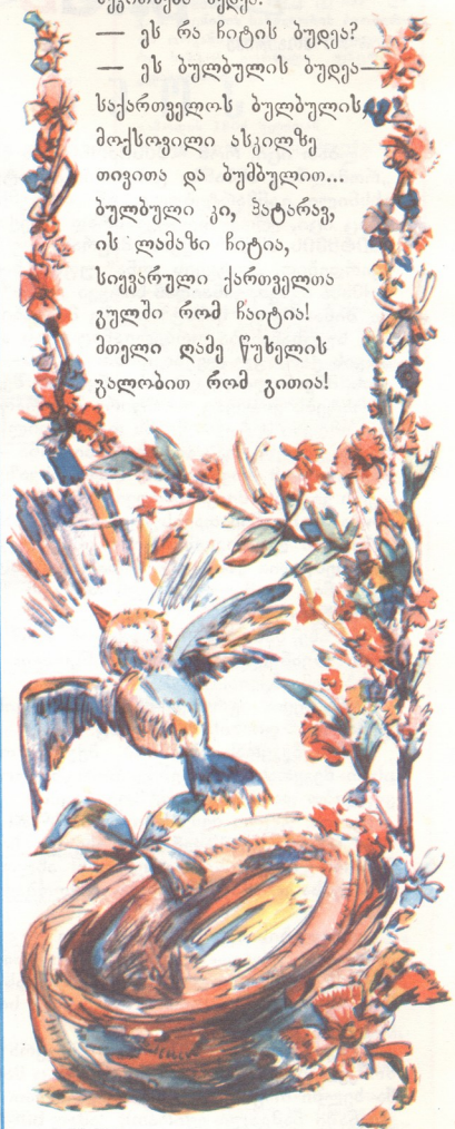
მხატვარი თამაზ ხუციშვილი