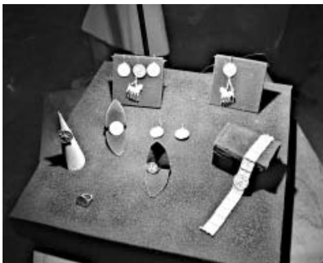
ასლები სახელმწიფო მუზეუმის საგანძურში.