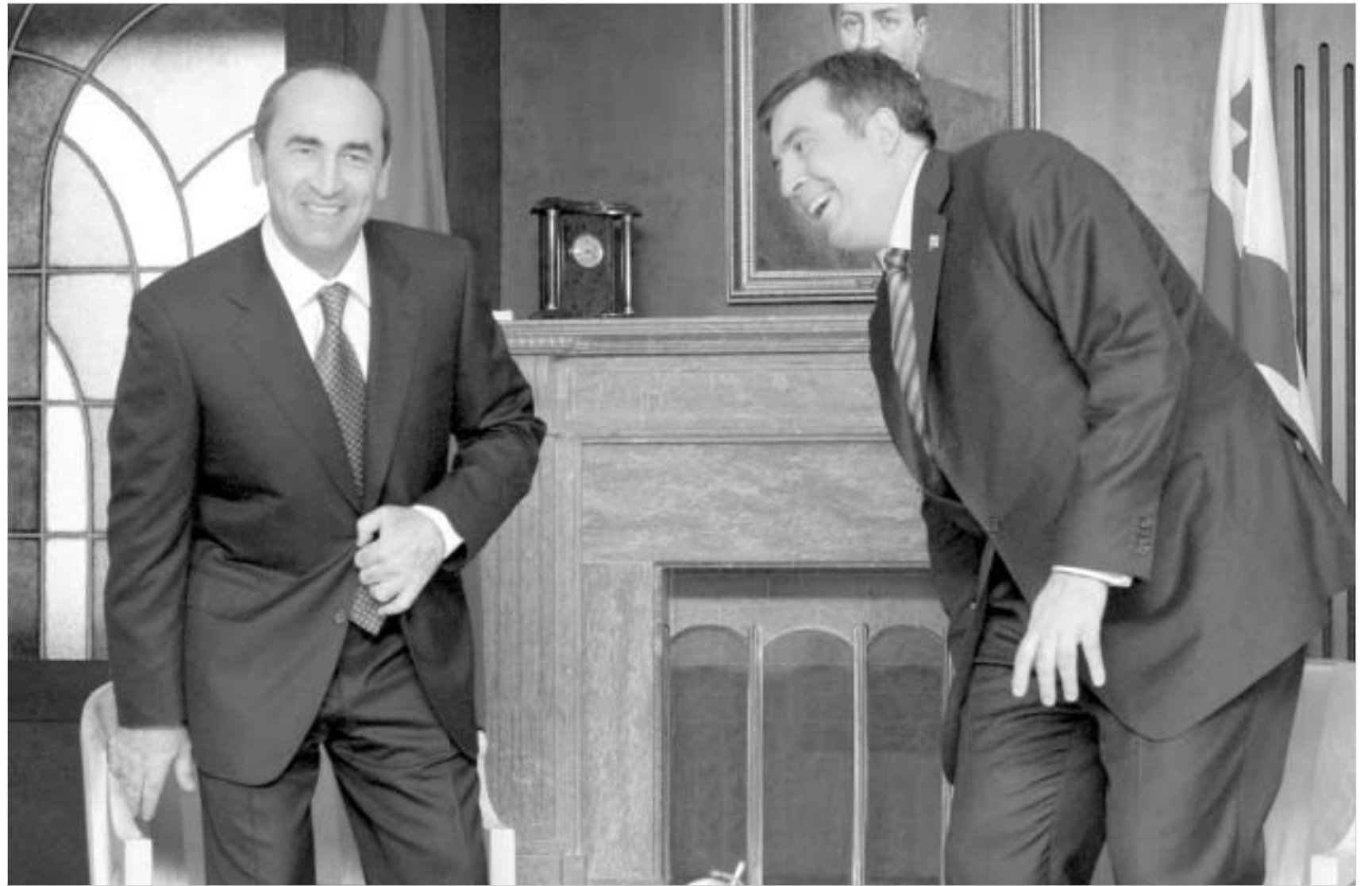
ბაი, ბალაილია, დოლო