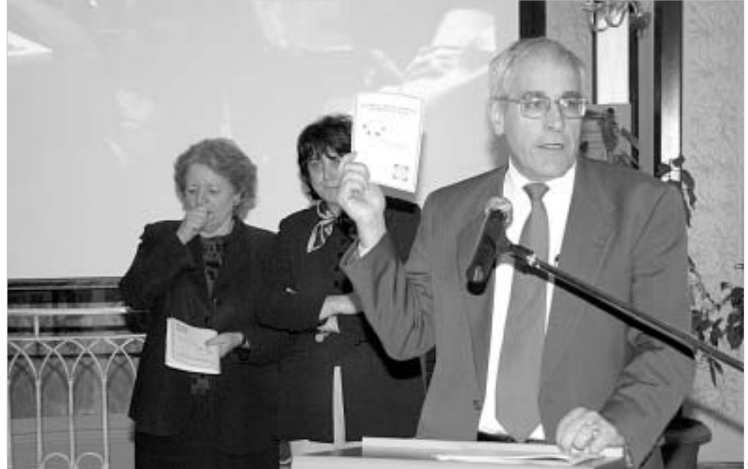
მსოფლიო ბანკი იწყებს იდეებს.