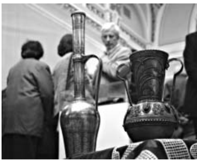
დალესტრელი ქართული კომუნისათვის.