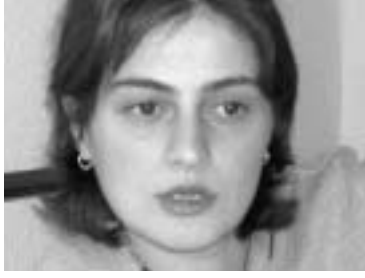
ნინია კაკაბაძის სვეტი