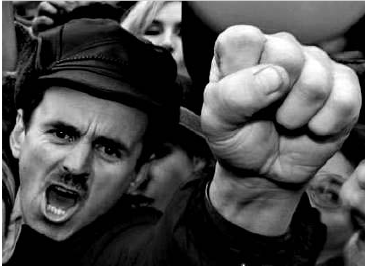
უკრაინაში არჩევანისთვის ბრძოლა დამოუკიდებლობისთვის ბრძოლაში გადაიზარდა.

პუტინსა და კურმას ხელახალი არჩევნების იდეა არ მოსწონთ