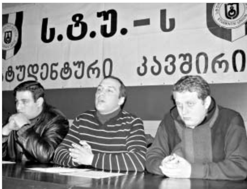
სტუდენტების წარმომადგენლები სოლოდრობას უცხადებენ აჭარაში დაპატიმრებულ თანატოლებს.

“მზარს ვუჭერთ აჭარაში უკანონოდ დაპატიმრებულ სტუდენტებს, შეშფოთებას გამოვხატავთ აჭარაში არსებული დიქტატორული რეჟიმის გამო, მოვითხოვთ აჭარის ტერიტორიაზე “რუსთავი 2“-ის მაუწყებლობის აღდგენას,” - ბოლო პერიოდში ასეთი ლოზუნგები საქართველოს თითქმის ყველა კუთხეში ისმის. გუშინ ამ მიმართებებმა თბილისში არსებული უმაღლესი სასწავლებლების სტუდენტებიც გააერთიანა.