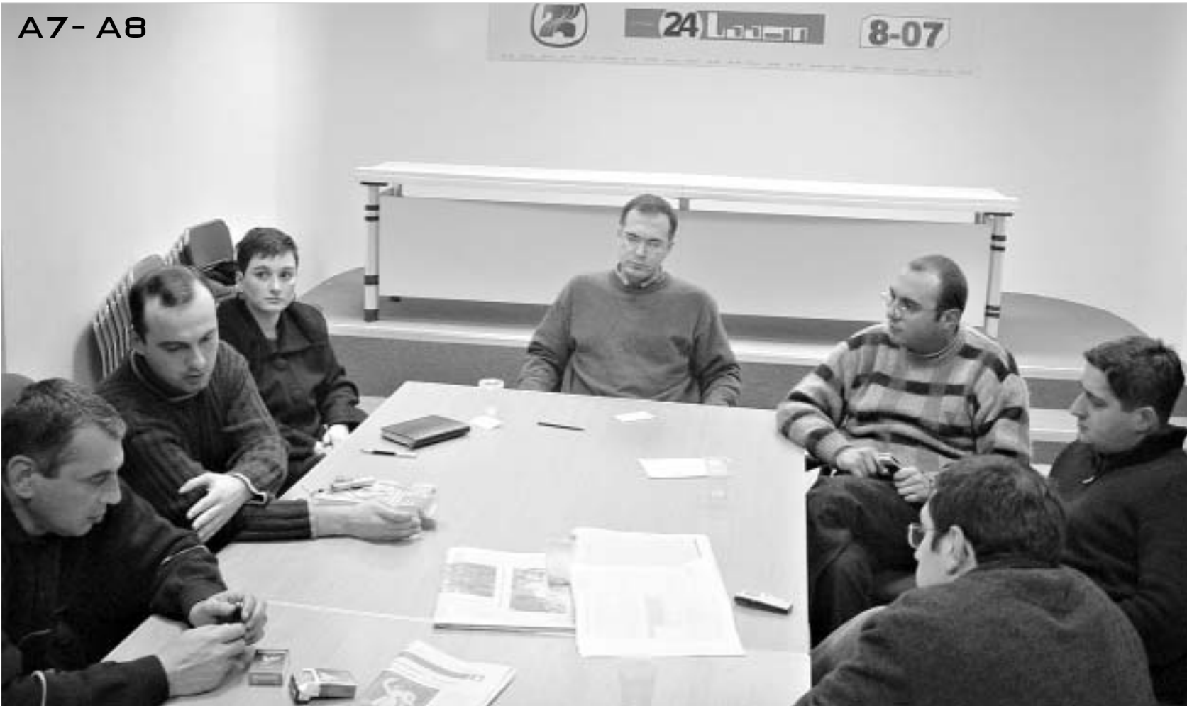
"24 საათში" გამართული დისკუსიის მონაწილეები.

რა შედეგს მოუტანს ქვეყანას ორხელისუფლებიანობა აღმასრულებელი ხელისუფლების შიგნით