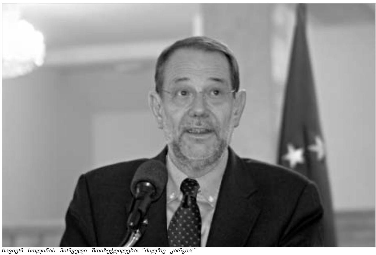
ხაიერ სოლანას პირველი შთაბეჭდილება: "ძალზე კარგია."