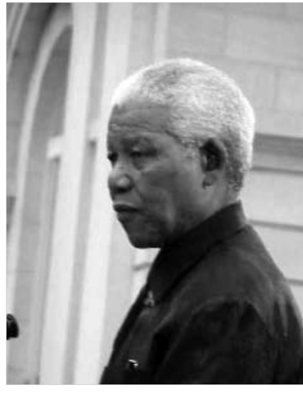
აპარტეიდის წინააღმდეგ ხრძოლის სიმბოლო პოლიტიკაში ბრუნდება. თუმცა, მხოლოდ დროებით.

სამხრეთ აფრიკის რესპუბლიკის ყოფილმა პრეზიდენტმა ნელსონ მანდელამ 2005 წლის თებერვალში, ლონდონში გამგზავრებაზე თანხმობა განაცხადა, სადაც ის "დიდი რვიანის" ქვეყნების ფინანსთა მინისტრების შეხვედრაში მიიღებს მონაწილეობას. აღნიშნულ შეხვედრაზე მანდელა აფრიკისათვის განკუთვნილ "მარშალის გეგმის" ახალ ვარიანტს დაუჭერს მხარს, რისი ინიციატივაც ინგლისის ფინანსთა მინისტრს გორდონ ბრაუნს ეკუთვნის.