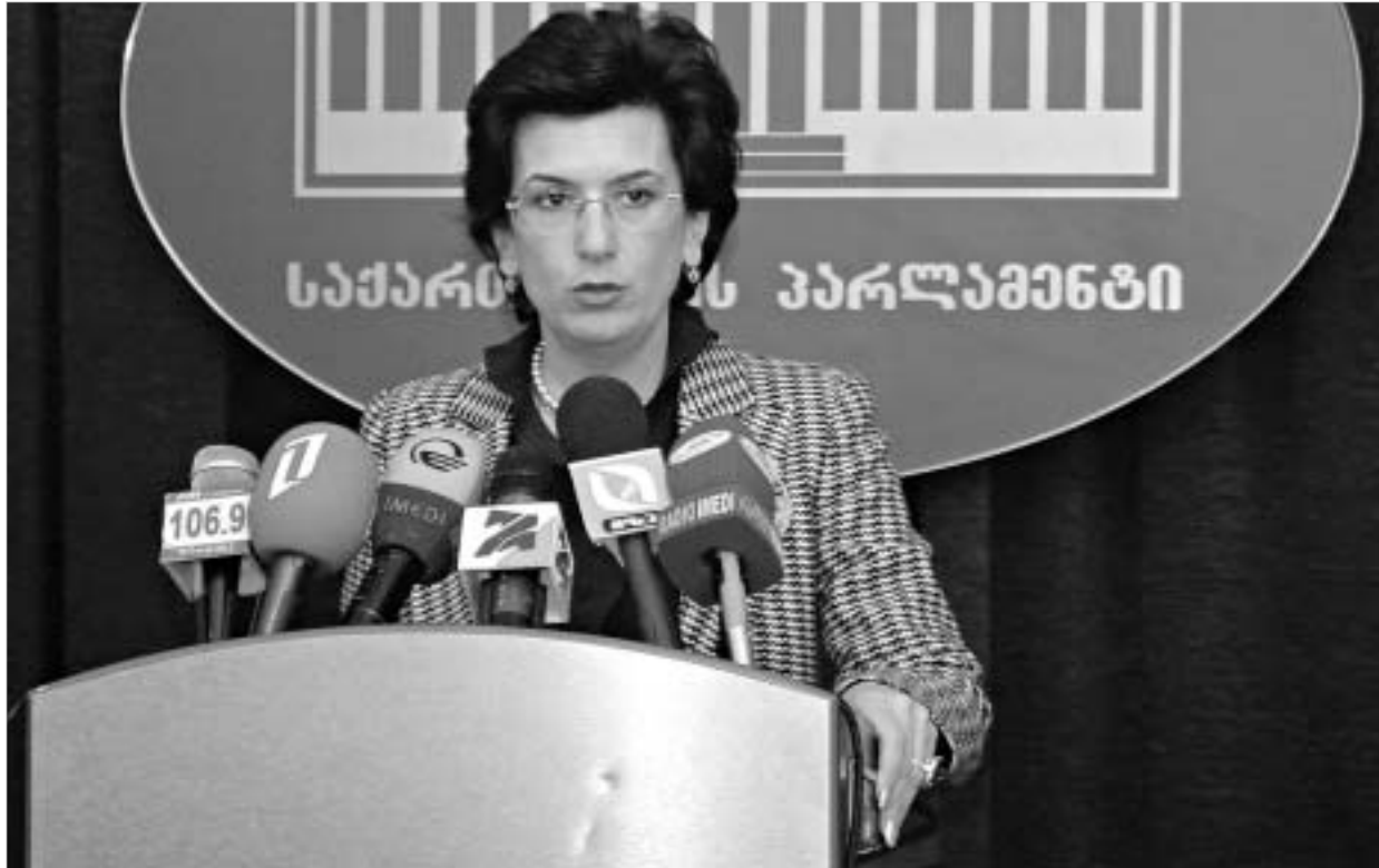
სპეციალურ ბრიფინგზე ნინო ბურჯანაძემ საერთაშორისო თანამშრომლობის რუსეთის გან დაცვა სთხოვა.