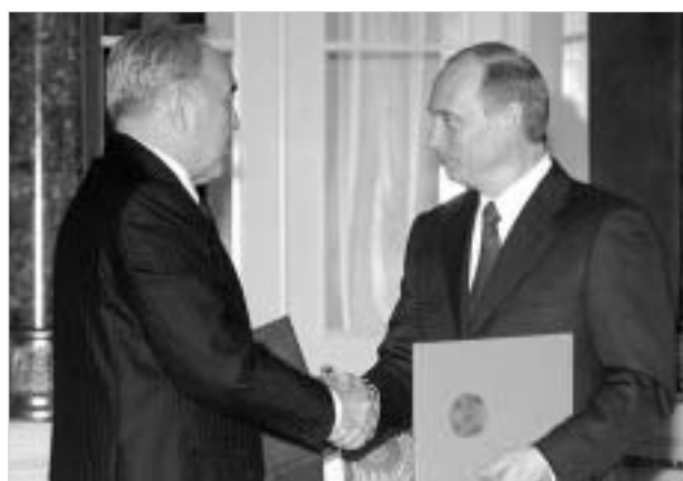
ყაზახეთის პრეზიდენტმა იმედი გამოთქვა, რომ რუსეთ-ყაზახეთის საზღვარი ნდობისა და მეგობრობის საზღვრად იქცევა.

რუსეთის ფედერაციის პრეზიდენტმა, ვლადიმერ პუტინმა სამშობლოს განაცხადა: "რუსეთი და ყაზახეთი აპირებენ გააფართოონ ურთიერთობა ისეთ ტრადიციულად პრიორიტეტულ საკითხებში, როგორებიცაა კოსმოსური და სათბობ-ენერგეტიკის სფეროები."