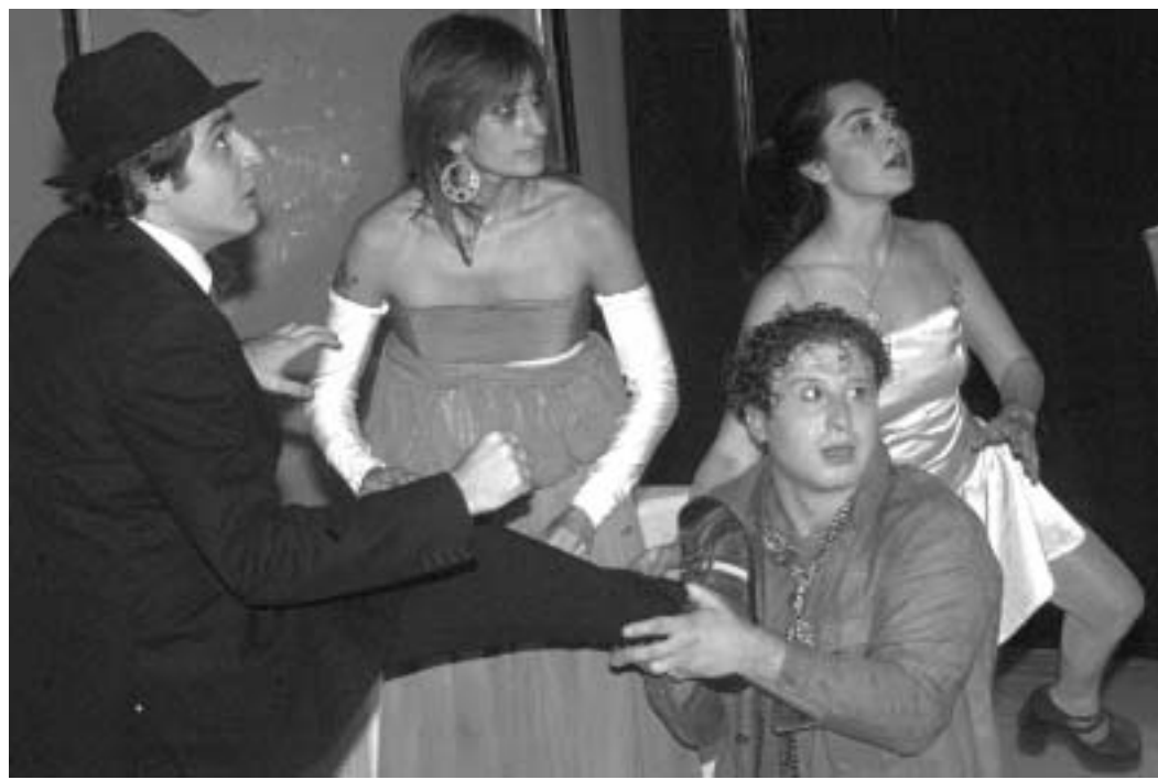
"ჩვენი თანამედროვე თეატრები სწორედ მაყურებელს ითვალისწინებენ. თუმცა ამ შემთხვევაში ეს არის დაშვება მაყურებლის დონეზე. თანაც, დაბალგემოვნებიანი მაყურებლის დონეზე."

ტუარო პოლიტიკა, რაც ძალიან კარგი იყო თეატრებისთვის. არ შიძლება იყოს იგივე ექსცენტრიკი ყოველივე, მას სახე უნდა ჰქონოდა. ახალი თეატრები დასავლური ხასიათისაა." ჩემი მოსაუბრე დამეთანხმა იმაზე, რომ "დასავლური" ამ ბოლო დროს კარგთან, მონიშნავს და პროგრესულთან ასოცირდება და ამიტომაც განიმარტა: "დასავლური - ეს მოდელია, კარგია ის თეატრი, სხვა საქმეა. მოდელის ხარისხს განსაზღვრავს პერსონალი; ადამიანი, ვინც ამ მოდელში მუშაობს. ისინი რომ აკადემიურ თეატრში გადაიყვანონ, ვერაფერს გავაყვებენ. დღეს სპექტაკლი მაკონტროლებული არ ჰყავს. ის მხოლოდ საკუთარ შემოქმედებით პოეტურად თეატრებს. მაყურებელი მიდის ამ თეატრებში და მე ვერ ვიტყვი, რომ მისი იქ მოსვლა, ის შემდეგ ზუსტად აქვს ათვისებული, თუ როგორ თეატრალურ გარემოში მოხვდა. ის მიდის კონკრეტულ სპექტაკლზე და არა თეატრში. მარჯანიშვილის თეატრის მაყურებელმა ყოველთვის იცოდა, რას მიღებდა, როგორ სტილისტიკასა და ესთეტიკას შეხვდებოდა. ისინი მიდიოდნენ არა მარტო წარმოდგენებზე, არამედ თეატრებში, იმ თეატრალური ესთეტიკის შესაგრძობად და მათი თეატრების გასაგონად. სტურუას, ჩხეიძეს, თუმანიშვილს ჰქონდათ ერთი სპექტაკლიდან მეორეშიც ვარდამაგალი პროდუქტაკა, ჯაჭვი, რაც თეატრის სახეს ქმნიდა. ერთი თეატრი ერთი გარკვეული იდეის პროპაგანდას ეწეოდა, მეორე - მეორისას. მე მათი ესთეტიკისა და ხელნერის სანახავად დავდივარ. დღეს თავისუფალ თეატრში (თუ სხვა ნებისმიერში - ასეთი ბევრია) მაყურებელი მიდის კონკრეტული სპექტაკლის სანახავად და არა თეატრში, რათა ნახოს, მაგალითად, სარდაფის "აზროვნება". თეატრმა ასეთი სახე დაკარგა. ადრე იყო სარებერ-