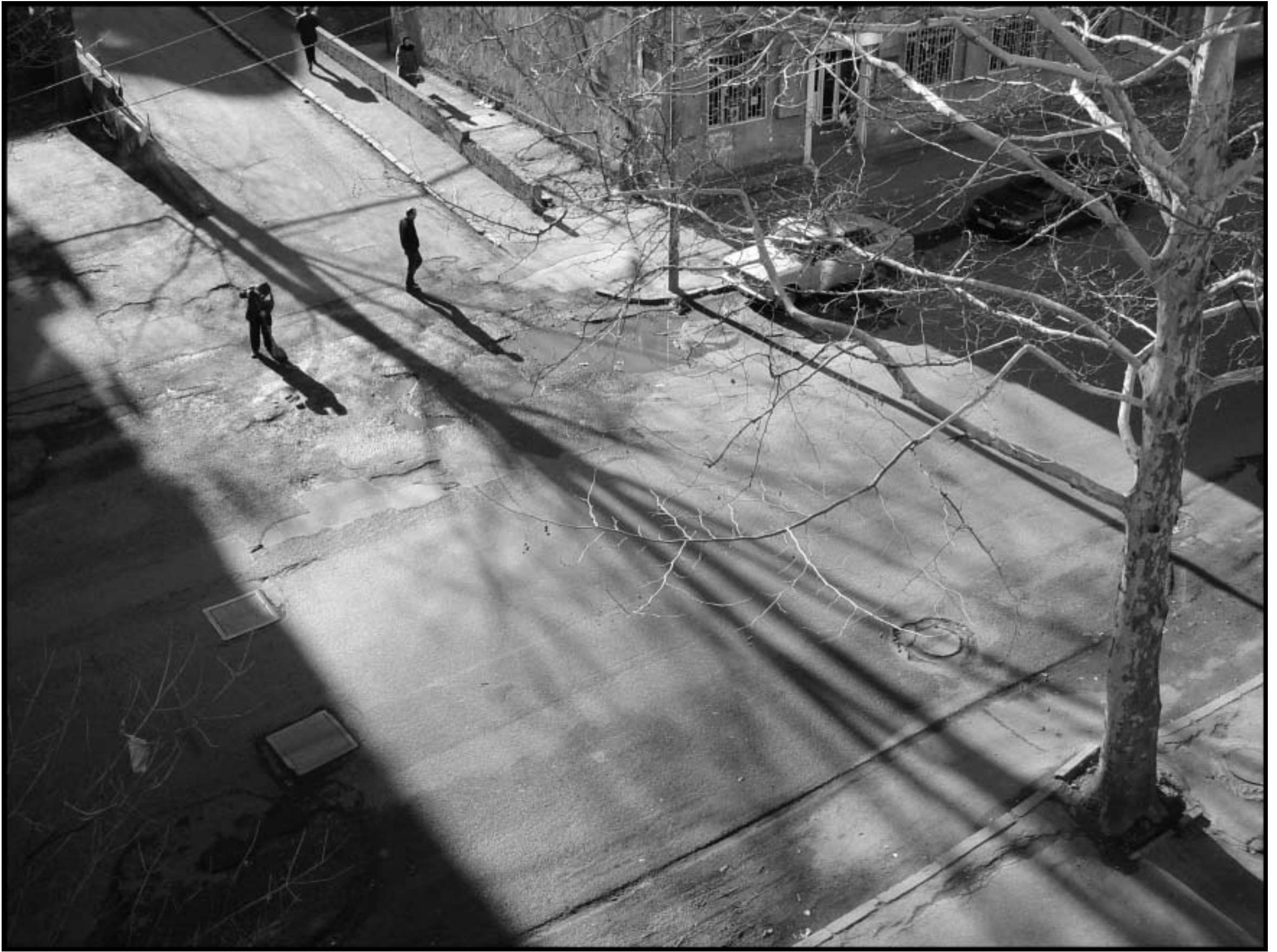
ხედი ჩემი ფანტრიდან.