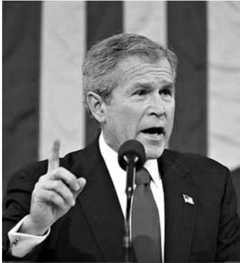
ინაუგურაციის მთავარი გმირი