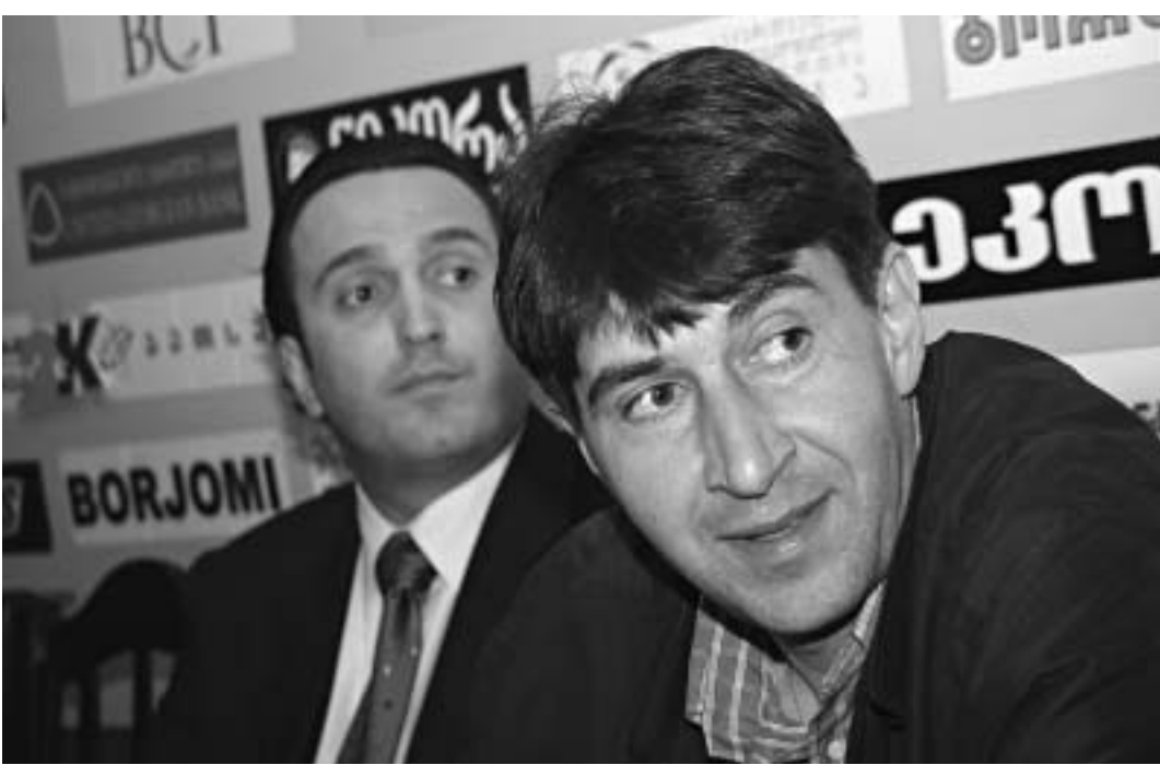
„დინამო“ მზადდება კვიპროსში განაგრძობს.