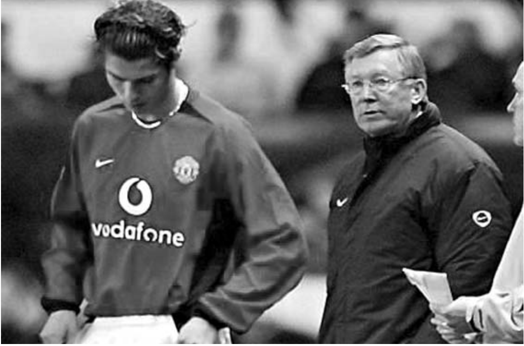
ფერეისონმა ვენგერს სისინიოს უწოდა.

მონინალმდე გუნდის ფეხბურთელის მიერ „პატივცემიმა“ ფერეისონმა, თითქოს არაფერი მომხდარაო, აუღელვებლად გამოიკვალატანსაცემელი და ისე ჩაატარა მატჩის შემდეგომი პრესკონფერენცია, რომ მომხდარზე კინიტელ კი არ დაუმრავს, თუმცა, ეს ამბავი მაინც გახმაურდა. „მანჩესტერ იუნაიტედის“ მწვრთნელმა არც მაშინ დაცვა თავი, როცა გვირაბში უკვე გახმაურებულ ინციდენტს არსენ ვენგერმა ფერეისონის „ფანტაზიის ნაყოფი“ უწოდდა. მან არც მაშინ დაარღვია დემილი, როცა ვენგერმა ინგლისის ფეხბურთის ასოციაციას ეწვიო კოულში უფემი თამაშის გამო რუდ ვან ნისტერლის დამსარულთა, თავად ფეხბურთელი კი „მატყუარად“ მონათლა.