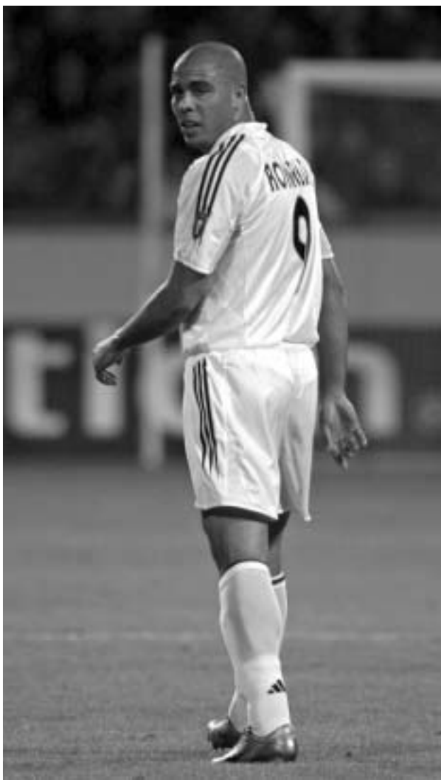
რონალდო ლუმემბურგოზე განწყენდა.

- ეს მას ჰკითხეთ, რატომ იყო უკმაყოფილო. ჩემთვის არაფერი უთქვამს. მისი შეცვლა ჩემთვის