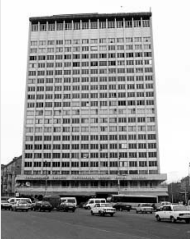
დევნილები სასტუმროების გაყიდვას შიშობენ

"დევნილთა შესახებ" საქართველოს კანონის თანახმად, დევნილებით კომპაქტურად დასახლებული ობიექტებიდან მათი გამოსახლება აფხაზეთისა და ცხინვალის რეგიონში პოსტ-კონფლიქტური სიტუაციის მოწესრიგების შემდეგ, ან მათთვის ისეთი საცხოვრებელი ფართის გამოყოფის შემთხვევაშია შესაძლებელი, რომლითაც მათი საყოფაცხოვრებო პირობები არ გაუარესდება. ამასთან, დევნილებით კომპაქტურად დასახლებული პუნქტებშია მათი გამოსახლება შეუძლებელია მაშინაც, თუ სტიქიური ან სხვა მიზეზებით ხდება, რაც განსაზღვრულ კომპენსაციებს ითვალისწინებს და საერთო წესით რეგულირდება, აგრეთვე, თუ დევნილი უკანონოდ და თვითნებურად ადგილს დაკავებული ფართი. შესაბამისად, ეკონომიკის სამინისტროში აცხადებენ, რომ ინვესტორის მიერ ამა თუ იმ ობიექტის შესყიდვის შემთხვევაში, მას დევნილების გამოყენების უფლება არ აქვს, სანამ პოსტ-კონფლიქტური სიტუაცია არ დარეგულირდება, ან დევნილებს გარკვეულ საკომპენსაციო თანხას არ შესთავაზებს. ეკონომიკის სამინისტროს ინფორმაციით, საპრივატიზაციო ობიექტთა ნუსხაში დევნილებით დასახლებული