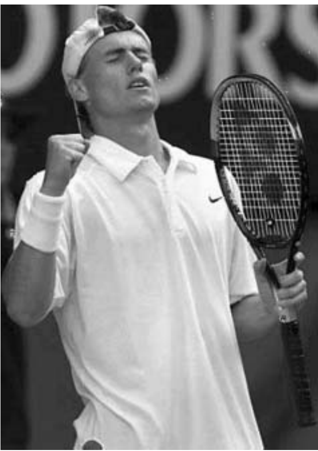
მოლიკი და ჰოუტი ავსტრალიის ჩემპიონობას შეეძებნა.

მოკლედ, ტურნირის მე-10 ნომერმა არაფერი დაუთმო გაცილებე-