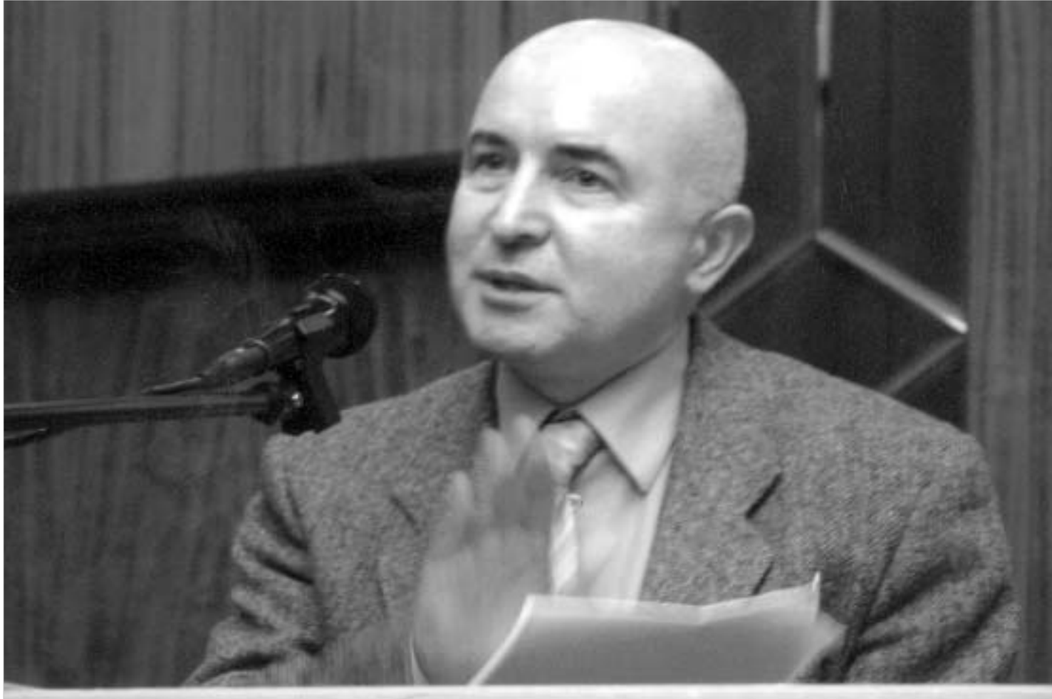
წარმოდგენილ კონცეფციითაგან ყველაზე ფუნდამენტური და ყოვლისმომცველია პაატა ზაქარეიშვილის კონცეფცია. კულაშვილისა და მათ თანამაზრეთა კონცეფცია თუმცა აქვე უნდა ითქვას, რომ ამ კონცეფციამ საზოგადოებაში აზრთა სხვადასხვაობა გამოიწვია რაც განსაკუთრებით ეხება საქართველოს ტერიტორიული მოწყობის საკითხს. როგორც უნდა იყოს იგი: უნიტარული თუ ფედერაციული.

იმ დროს, როცა იქ, ენგურს გაღმა არ არსებობს ყოველივე ამის შემკავებელი არანაირი მექანიზმი (ეგრეთ წოდებული, აფხაზი სამართალდამცველი ხშირ შემთხვევაში იმ დანაშაულობათა თანამონაწილენი არიან), აფხაზეთის მართლმადიდებლობა, შესაბამისი საგამოძიებო ორგანოების ძალისხმევით, თავის სიტყვას ამბობს და იქაც, საქართველოს ხელისუფლების მიერ არაკონტროლირებად ტერიტორიაზეც კი ზღვარს უდებს დანაშაულობათა აღსულებას. - თქვენ ზემოთ აღნიშნეთ, რომ აფხაზეთის მართლმადიდებლობა ზოგ შემთხვევაში ფსოუმდეც კი აღწევს, კონკრეტულად