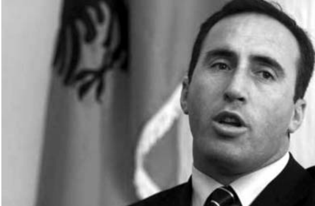
სერბი ძალოვნების განცხადებით, პრემიერ-მინისტრი ჰარადინა უკვლაზე გავლენიანი კრიმინალური ფიგურაა კოსოვოში, რომელიც აკონტროლებს იარაღის, ნარკოტიკების, სანავ-საპოხი მასალებისა და ავტომობილების კონტრაბანდის ქალაქების - პერი, დეჩანე, ვაკოვიცა - რაიონებში. არსებობს ინფორმაცია, რომ ბანეთის განმათავისუფლებელი არმიის საქმიანობაში ჰარადინაის მონაწილეობისა და მაკე-დონიაში ბოვიკებისთვის იარაღის არაფორმალური მიწოდების შესახებ, აგრეთვე ჩერნოგორიაში ალბანური უმცირესობის სეპარატისტული მისწრაფებების მხარდაჭერის შესახებ. გარდა ამისა, კოსოვოს მთავრობის ახალი ხელმძღვანელის ახლო გარემოცვა მძილბულია 2004 წლის 17-18 მარტში კოსოვოში ეთნიკურ წმენდამ, სადაც აღბანდმა ექსტრემისტებმა 22 ადამიანი მოკლეს და ხუთასზე მეტი დაჭრეს. იმავდროულად დაზარადა გაროსა და ნატო-ს სამხედრო ძალების 60-ზე მეტი ჯარისკაცი.

1990-იან წლებში ჰარადინა იგერეთ ნოდებული "კოსოვოს განმათავისუფლებელი არმიის" ერთ-ერთი საველე მეთაური იყო და ამჟამად იმყოფება სიაში, სადაც ის პირები არიან შესული, რომლებსაც შაავის ტრიბუნალი სამხედრო დანაშაულში ეჭვმიტანილად მიიჩნევს. რამუშ ჰარადინა შაავის საერთაშორისო ტრიბუნალის გამოძიებებშია დაკითხვებზე ორჯერ გამოიძახეს, 1998-1999 წლებში კოსოვოში მომხდარ ეთნიკურ შეტაკებებში მის როლთან დაკავშირებ-