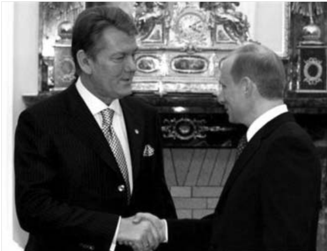
რუსეთის პრეზიდენტმა იუშენკოს აუხსნა, რომ კერძო თხოვნით მოქმედებდა.

უკრაინის ახალი პრეზიდენტი ინაუგურაციის მკორე დღესვე მოსკოვში ჩავიდა ვლადიმირ პუტინთან "სწრაფი და გულწრფელი" საუბრისთვის. ცხადია, არავინ მოელოდა, რომ ამ ვიზიტს რაიმე სერიოზული შედეგები მოჰყვებოდა, თუნდაც იმ ფაქტთან გამოდინარე, რომ ვიქტორ იუშენკომ სულ რამდენიმე საათი დაჰყო მოსკოვში. გუშინ რუსული გაზეთი "კომერსანტი" წერდა: "ნარინჯისფერი რევოლუციის ლიდერს პუტინთან გულახდილი დიალოგის იმედი არ უნდა ჰქონდეს და მისგან მხოლოდ პრეზიდენტის პოსტზე არჩევასთან დაკავშირებით "მშრალ პროტოკოლურ მილოცვას მოისმენს". ასე რომ, მოსკოვში იუშენკოს ჩასვლა ჯერ კიდევ უაღრესად საშიში მეზობლის შემოირიგების მცდელობის შთაბეჭდილებას ტოვებდა.