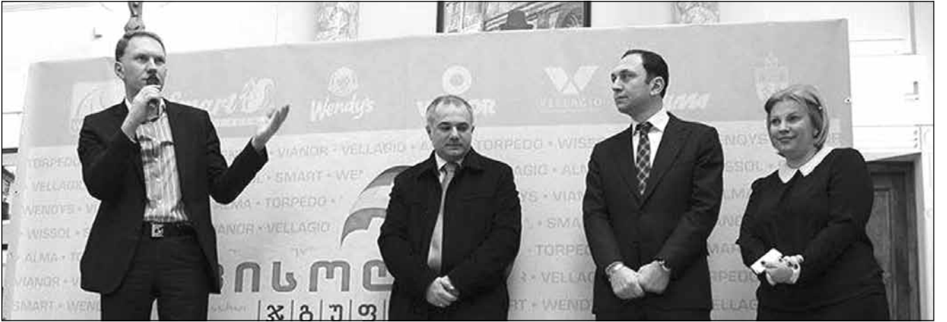
კომპანიამ ახალგაზრდებისთვის დასაქმების ფორუმი მოაწყო

„ვისოლმა“ სიურპრიზი, ამჯერად, ახალგაზრდებს გაუკეთა — კომპანია უახლოეს მომავალში, 400 სტუდენტს დაასაქმებს. „ვისოლ ჯგუფის“ ინიციატივით, პირველად საქართველოში, ეროვნულ ბიბლიოთეკაში დასაქმების ფორუმი მოეწყო. ორი დღის განმავლობაში, კომპანიის წარმომადგენლებმა ახალგაზრდებს ლექციები წაუკითხეს, გამოცდილება გაუზიარეს და აუხსნეს, რომ დასაქმების რეალური შანსის გარდა, მათ „ვისოლ ჯგუფის“ შვილობილ კომპანიებში სტაჟირებისა და კომპანიის დამფუძნებლებისგან მასტერკლასების მოსმენის საშუალებაც ექნებათ. დასაქმების მსურველთა რაოდენობა შთაბეჭდილო იყო — ფორუმში მონაწილეობის მისაღებად საქართველოს სხვადასხვა უმაღლესი სასწავლებლის 2000-ზე მეტი სტუდენტი დარეგისტრირდა, რაც „ვისოლ ჯგუფის“ პრეზიდენტის, რომს უსაჰაძის თქმით, ძალიან სასიამოვნოა: „კარგია, რომ ახალგაზრდებს დასაქმების სურვილი აქვთ და მათი სახით, ჩვენს ინიციატივას ამდენი მხარდაჭერი გამოუჩნდა. „ვისოლის“ განვითარების ტემპის პროპორციულად იზრდება მოთხოვნა პროფესიონალ კადრებზე. მოხარულები ვართ, რომ საშუალება გვაქვს, საქართველოს წამყვანი უნივერსიტეტების გამორჩეულ სტუდენტებს მივცეთ დასაქმების შესაძლებლობა „ვისოლ ჯგუფის“ შვილობილ კომპანიებში. „ვისოლის“ წარმატების ისტორიას თითოეული თანამშრომელი ქმნის. გვჯერა, წარჩინებულ სტუდენტებთან ერთად, უკეთეს მომავალს შევქმნით. დასაქმების ფორუმებს, სხვა ქვეყნებში, ძირითადად, უნივერსიტეტები აწყობენ. ეს ერთ-ერთი პირველი ფორუმაა, რომელსაც ატარებს კერძო კომპანია. ჩვენს ქვეყანაში უმუშევრობა ერთ-ერთი ყველაზე დიდი პრობლემაა, ადამიანების დასაქმება კი „ვისოლის“ პრიორიტეტია“.