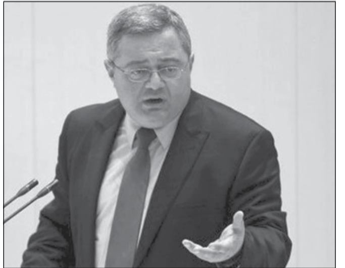
ჩხუბი პარლამენტში და ნაციონალების მიმართვა უსუფაჟილს

— მათი სტრატეგიაა, პროცესი დროში განელონ. ჩემს სიმართლეს ყველგან დავამტკიცებ, მათ შორის, ლონდონშიც. ვვარაუდობ, რომ შარანგიები სასამართლო პროცესის გადავადებაში გარკვეულ თანხას იხდიდნენ, რათა გამოძიება არ დაწყებულიყო. ხელისუფლებამ ხალხის წინაშე აღებული ვალდებულება უნდა შეასრულოს და ნართმულ ქონებასთან დაკავშირებით, გამოძიება დაიწყოს. თუ კერძო საკუთრებას არ დაიცავენ, არ მესმის, საერთოდ რისთვის მოვიდნენ ხელისუფლებაში.