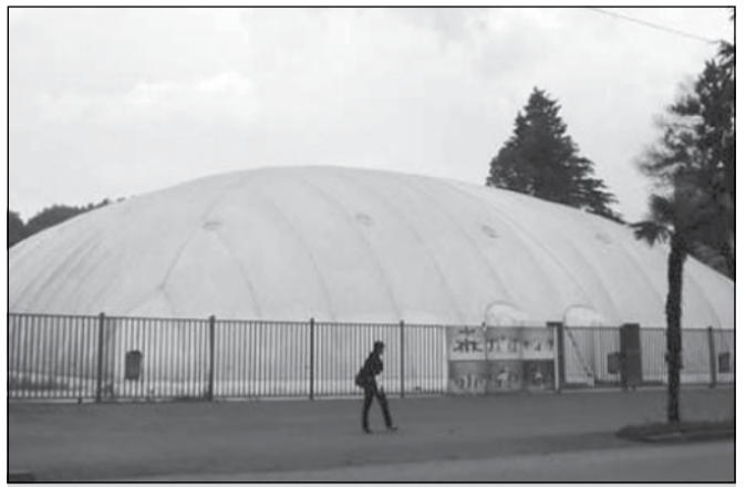
დიდთოვლოვის გამო ბათუმში ყინულის სასახლე ჩამოიშალა

ობიექტის ჩამონგრევის მიზეზი გათბობის სისტემის მოუწესრიგებლობა გახდა.