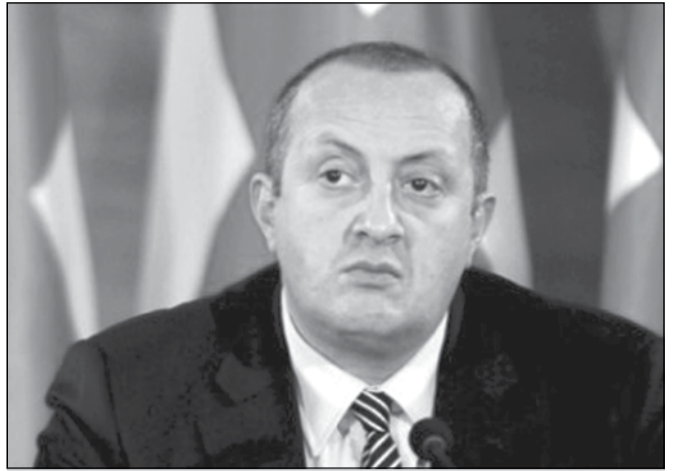
პრეზიდენტმა მარგველაშვილმა ევროკავშირის ქვეყნების ელჩებს უმასპინძლა

საქართველოს პრეზიდენტმა გიორგი მარგველაშვილმა რესტორან „ფუნიკულიორში“ საქართველოში აკრედიტებულ ევროკავშირის ელჩებთან სამუშაო სადილი გამართა.