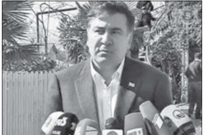
მიხეილ სააკაშვილი: „თავი გაჟანჯაბთ!“

„საერთოდ, პოლიტიკაში, ძალიან გთხოვთ, ნუ ჩამრევთ“, — ასე უპასუხა საქართველოს ყოფილმა პრეზიდენტმა, მიხეილ სააკაშვილმა მუხროვანის სპეცოპერაციის დაგეგმვის ამსახველ ვიდეოსთან დაკავშირებით ჟურნალისტების კითხვას.