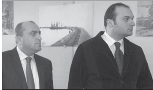
ვის სათაშაო კუთხეც არის“, — განაცხადა არჩილ ხაბაძემ.

ავტოსადგური, რომელიც 1541 კვ მეტრზეა განთავსებული და მოიცავს ორსართულიან შენობასა და ავტოპარკინგს, აჭარის მთავრობის თავმჯდომარემ, არჩილ ხაბაძემ და ქობულეთის გამგებელმა გაია რომანაძემ გახსნეს. ავტოსადგური 40 ავტომობილს ერთდროულად მოემსახურება. შესრულებული რევიზიის შიდა, საქალაქთაშორისი და საერთაშორისო რეისებში მისი მფლობელი შპს „გიაგოა“, რომელმაც ტერიტორია აუქციონის წესით შეიძინა და სამშენებლო სამუშაოები შეასრულა. „მნიშვნელოვანი ობიექტი გაიხსნა ქობულეთში, ეს კიდევ ერთი წარმატებული პროექტია კერძო კომპანიებსა და სახელმწიფოს შორის თანამშრომლობისა. სადგური მაღალ დონეზე მოემსახურება ადგილობრივ მგზავრებსა და სტუმრებს; აქ მოეწყობა დასასვენებელი ადგილი, საკვები ობიექტი და ბავშვებისთვის სათამაშო კუთხეც არის“, — განაცხადა არჩილ ხაბაძემ.