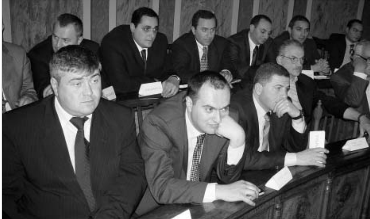
ახალი და ძველი სავარძლების მოლოდინში.