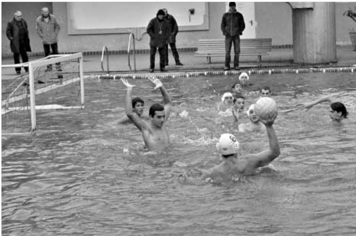
ქართველ ჭაბუკებს არც უკრაინელთა დამარცხება გასჭირვებიათ.