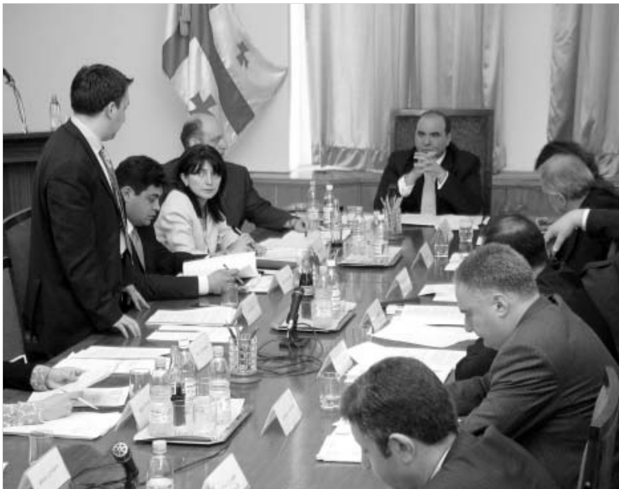
საქართველოს მთავრობამ ჩვეულებრივი დღის წესრიგი აჭარაზე მსჯელობით შეცვალა.