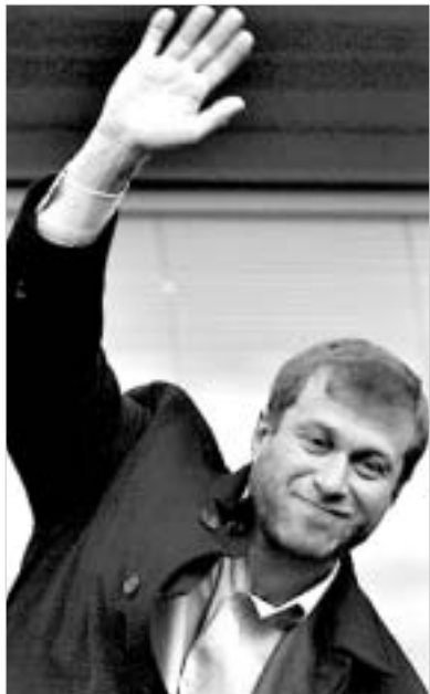
რომან აბრამოვიჩის მოუწონის გადაბირება მოუნდა.