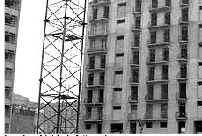
მიტოვებული შენობები ბათუმში ვლიან.

ყოველ მშენებარე ბინას (სხვევ, მიტოვებულს) გარს აუცილებლად უნდა ჰქონდეს შემოვლელი დამცველი ზოლი, რომელიც ადამიანს შეატყობინებდა, - ჩემს იქით გადასვლა აკრძალულია. ამ ქალაქში კი ასეთი ვერაფერს ნახათ. თუმცა, დამცველი ზოლი რომ შემოეფლით, რუსეთში ერთბაშე აჭრულდებოდა, განსაკუთრებით - მიკრორაიონები. სხვა, რომ ამგვარი ბინების არსებობა ძალიან აუშოვებს ისედაც ნაცრისფერ ქალაქს - თვალს ცუდად ხვდება გამოღამებული ბინების ცქერა.