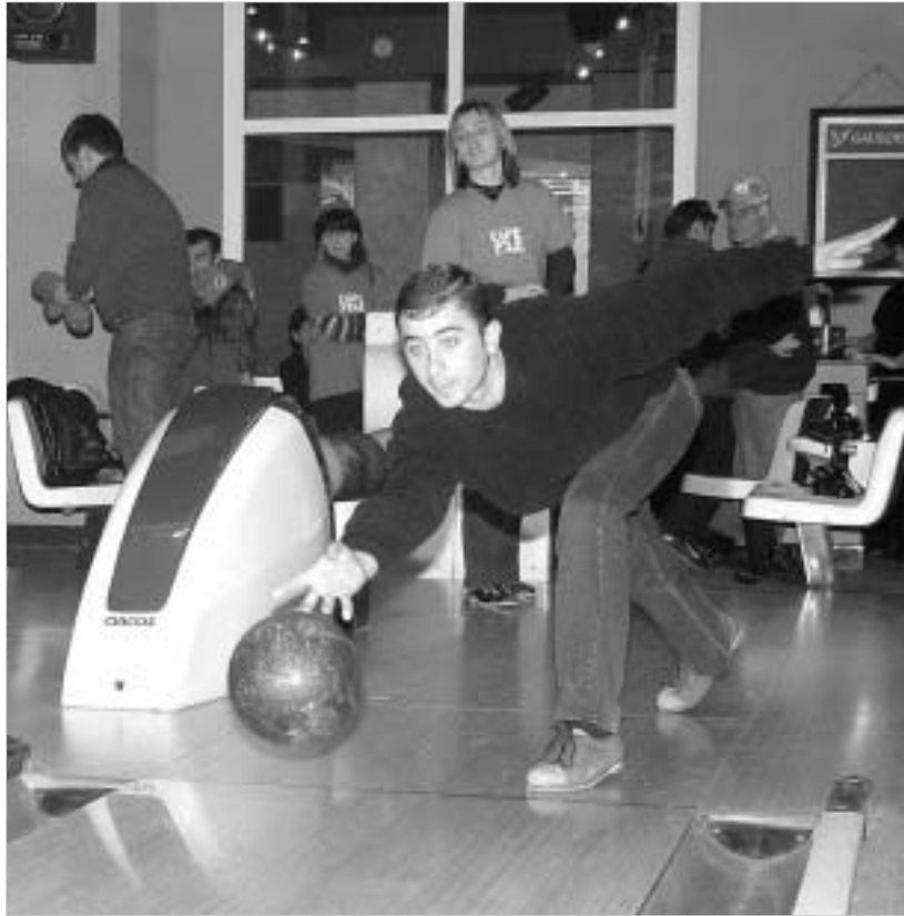
ბოულინგი პროფესიონალთა თამაშია.

ბოულინგი რომ კარგი გასარ-თობი და დროის სასიამოვნოდ გა-ტარების საშუალებაა, ამას თავად დარწმუნდებით, თუ ერთხელ მა-ინც შეადგინო ბოულინგცენტრის კარს და თამაშის სურვილს გამოთ-ქვამთ. მაგრამ მართლ ბურთის გო-რუბა დიდად სახიერო ვერ იქნება, თუ თამაშის ელემენტარულ წესებ-თან ერთად პროფესიონალ ინსტ-რუქტორთა რჩევას არ გაიზიარებ-თ. გაინტერესებთ, მაინც რას გვიჩვენებთ გართობის მოყვარულ-ებს მწვრთნელები ან პროფესიონა-ლი მოთამაშეები?