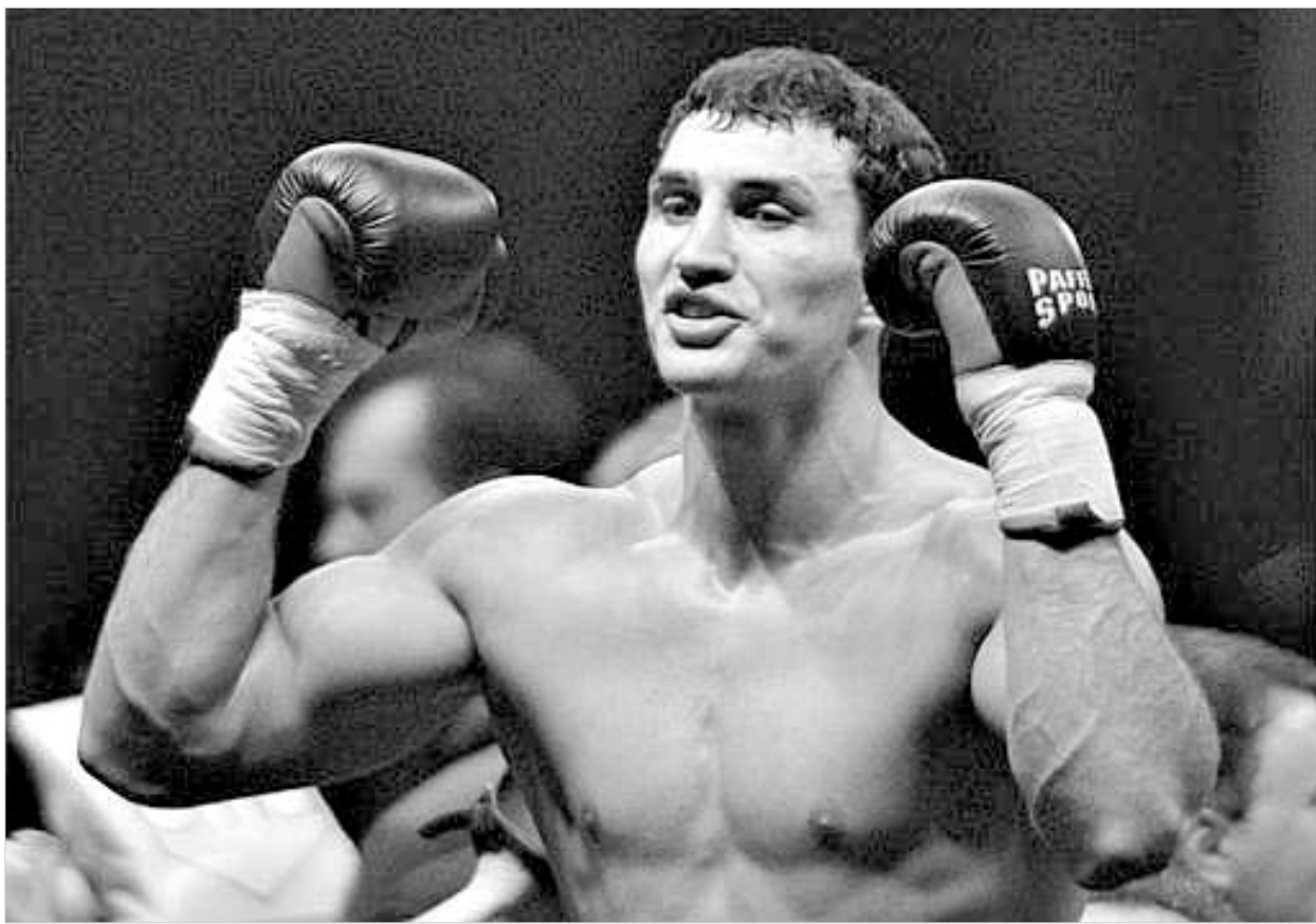
ვლადიმირ კლიჩკო სამართლს ეძებს.