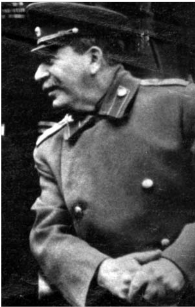
წლის 17 ოქტომბრის 15 საათსა და 30 წუთზე. შინსახკომის ორგანიზების მიერ მიღებული ყველა ზომები დაგეგმილ ღონისძიებათა უშუალოდ მხარდობისათვის.

გიხოვთ საბოლოოდ ჩათვალეთ შეხვედრის დროდ 1939 წლის 17, 18 და 19 ოქტომბერი და არ 17-19 ნოემბერი, როგორც ადრე იყო დაგეგმილი. ჩემი მატარებელი იუხვედრის ადგილზე იქნება 1939