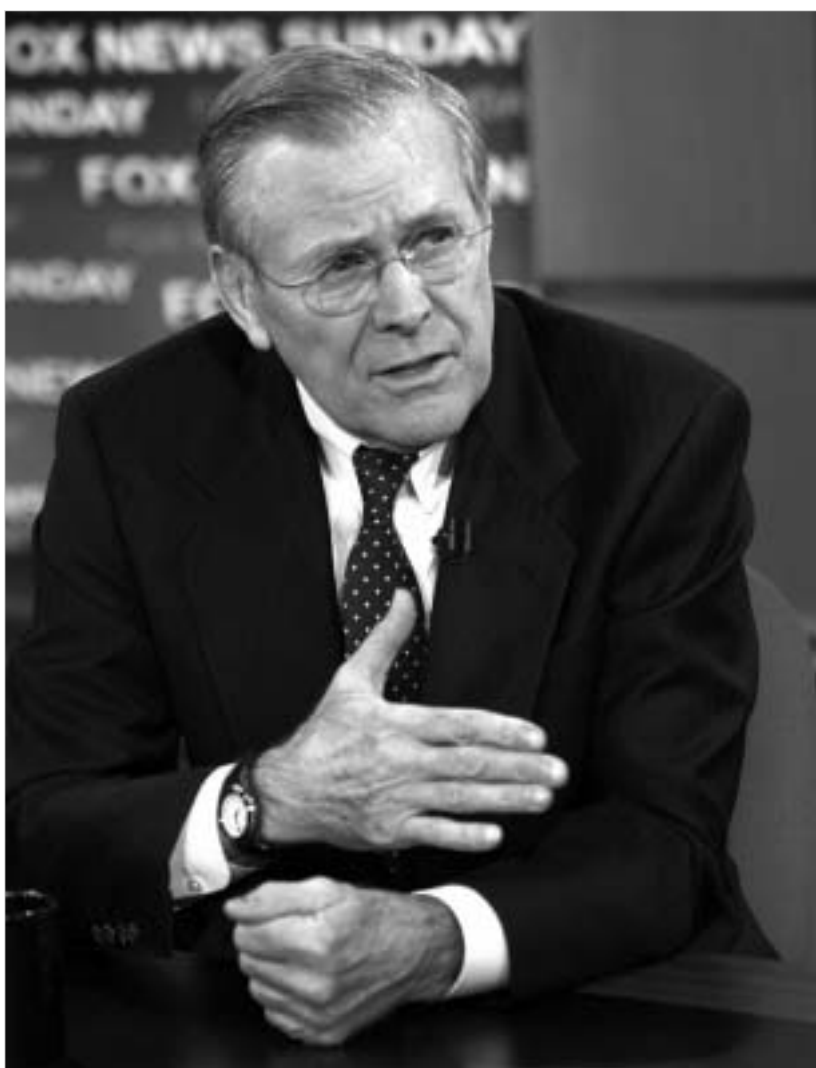
დონალდ რამსფელდმა ბოდიში უნდა მოიხადოს.

გუშინ დონალდ რამსფელდს კონგრესის ორივე პალატის თავდაცვის კომიტეტების წინაშე გამოვლია და ბოდიშის მოხდა უწყევდა. მიზეზი კი უკვე რამდენიმე დღეა სენატორად ქცეული ფოტოგრაფია, რომელიც ერაყელ პატიმრებზე ამერიკელი სამხედროების შეურაცხველი მოპყრობას ადსტურებს. მას ძალიან არასასიამოვნო კითხვებზე პასუხის ვაცემა მოუწევდა, ერაყელი პატიმრების წაშლასთან დაკავშირებით. ეს მომენტები რამსფელდისთვის, მისძალია, კარიერის დასასრულის დასაწყისიც ვახდეს.