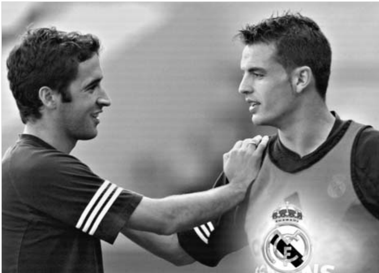
კვლავ ერთად - რაული-მორიენტისი.

ესპანეთის ნაკრების ფორვარდმა ფერნანდო მორიენტესმა ჭირვეულ "რეალს" დაუმტკიცა, რომ ღირსია ითამაშოს "გალაქტიკოს" გუნდის ძირითად შემადგენლობაში. ევროტურნირებზე მან ცხრა გოლი გაიტანა, ჯერ კიდევ მეოთხედწინააღმდეგობაში მადრიდის "რეალი" და "მონაკო" ჩემპიონთა ლიგის ფინალში გაიყვანა. ამით მორიენტესმა საქვეყნოდ შეარცხვინა "სამეფო კლუბის" ხელმძღვანელობა და, კერძოდ, "რეალის" პრეზიდენტი ფლორენტინო პერესი. ახლა "გალაქტიკოს" კლუბის ხელმძღვანელობა აცხადებს, რომ მომავალი სეზონიდან ესპანელი ფორვარდი მადრიდში დაბრუნდება.