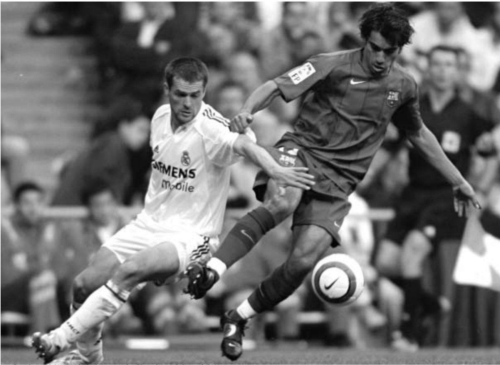
ოუენი იმედოვნებს, რომ მომავალ სეზონშიც "რეალში" ითამაშებს.