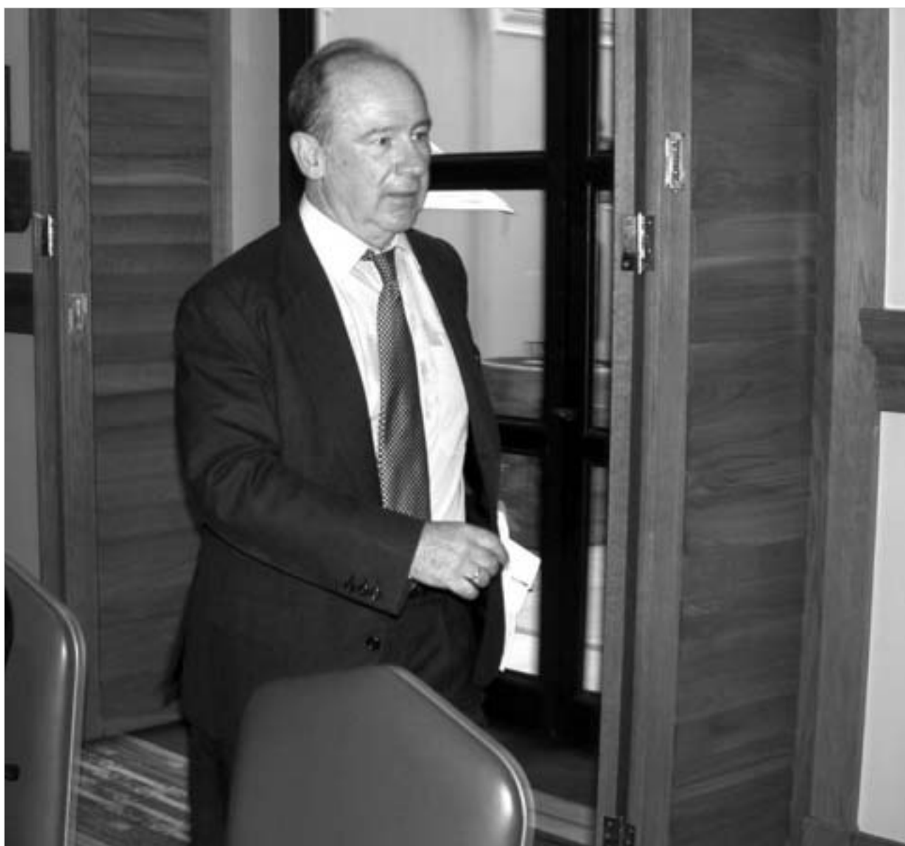
როდრიგო დე რატომ არაერთი შეხვედრა გამართა საქართველოს ხელისუფლების წარმომადგენელთა კაბინეტებში.