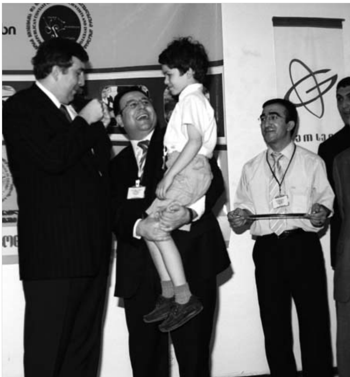
პრეზიდენტმა ყველაზე ნორჩ გამომგონებელს სამკრდე ნიშანი აჩუქა.

სხვათა შორის, ბოლო გადასასვლელი (სოფლის მეურნეობის სამინისტროს წინ) ქალაქის მთავრობამ შარშან დიდის ამბით გახსნა (წლები მანძილზე ხე გადასასვლელი ჩახერგილი იყო). ე.წ. "სამკუთხედის" ამოქმედების შედეგად კოსტავას ქუჩაზე ფეხით გადასვლა განსაკუთრებით გაჭირდა და მიწისქვეშა გადასასვლელის ამოქმედებაც ამიტომ გახდა საჭირო. მართალია, ფეხით მოსარულეთა წართილი იხვე ქუჩაზე ზვიდან გადასვლას ამჯობინებს, მაგრამ ნაკლებად გაბედულებს ამ ადგილას მიწისქვეშა გადასასვლელის გაუქმება სერიოზულ პრობლემებს შეუქმნის - კოსტავას ქუჩის ერთი მხრიდან მეორეზე მოხვედრა მხოლოდ ფილარმონიის წინ მდებარე გადასასვლელით შეიძლება.