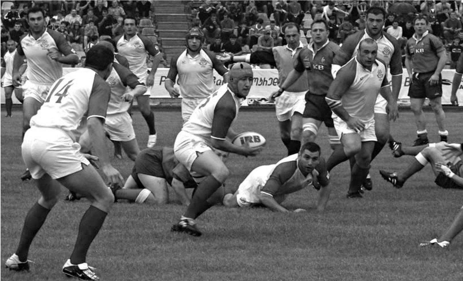
“ზორკლაოსნებმა” ლიდერის პოზიცია დაიბრუნეს.