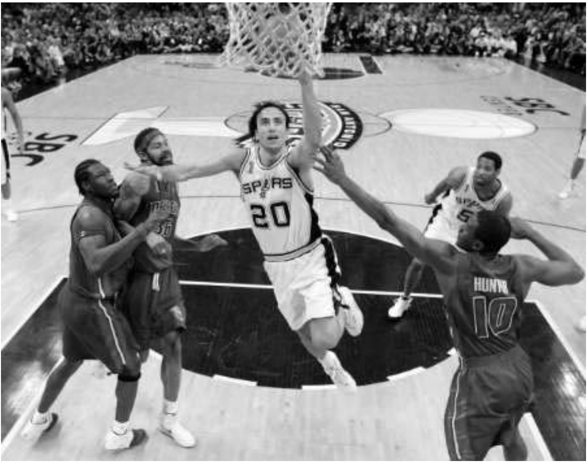
მანუ ჰინოზილიმ "სან-ანტონიოს" მეორე გასარტყევა მოაპოვებინა.

სან-ანტონიო - დეტროიტი 97:76 (სერიის ანგარიში 2:0)