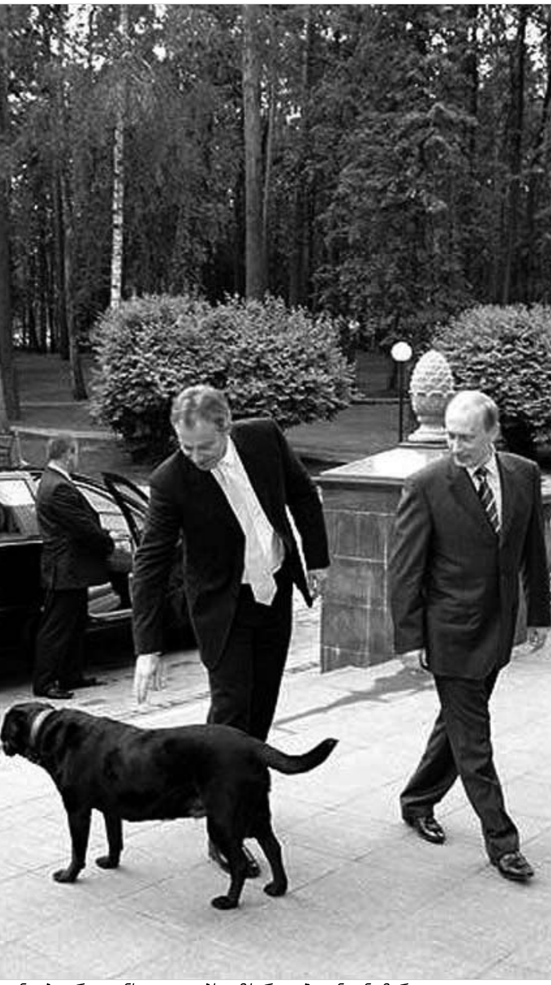
ტონი ბლერი კონსულტაციებს ამკარად პუტინთან მართავდა.

თუმცა, ობიექტურობისთვის აუცილებელია, ითქვას, რომ დღეს ორ ლიდერს კამათისთვის ამკარად ნაკლები დრო ექნებათ. საფრანგეთსა და ნიდერლანდებში რეფერენდუმების ჩავარდნის გამო, ევროკავშირში ღრმა კრიზისია. გარდა ამისა, არსებულ პრობლემებს ევროკავშირის ბიუჯეტის თაობაზე საფრანგეთსა და ბრიტანეთს შორის მწვავე კამათიც დაერთო, ხოლო აფრიკულ ვალებსა და გლობალურ დემობაზე ვაშინგტონში მსჯელობას სულაც არ ყოფილა ისეთი წარმატებული, როგორც ჯორჯ ბუში და ტონი ბლერი აღნიშნავდნენ. ამკარაა, ბუნდოვანება ამ საკითხებზე მსჯელობასაც ახლდა. ასე რომ, ბრიტანეთის პრემიერ-მინისტრის მხრიდან კონსულტაციებისთვის რუსეთში ჩასვლა მართლაც დროული იყო. "იმედს გამოთქვამ, რომ რუსეთის ფედერაციასა და დიდ