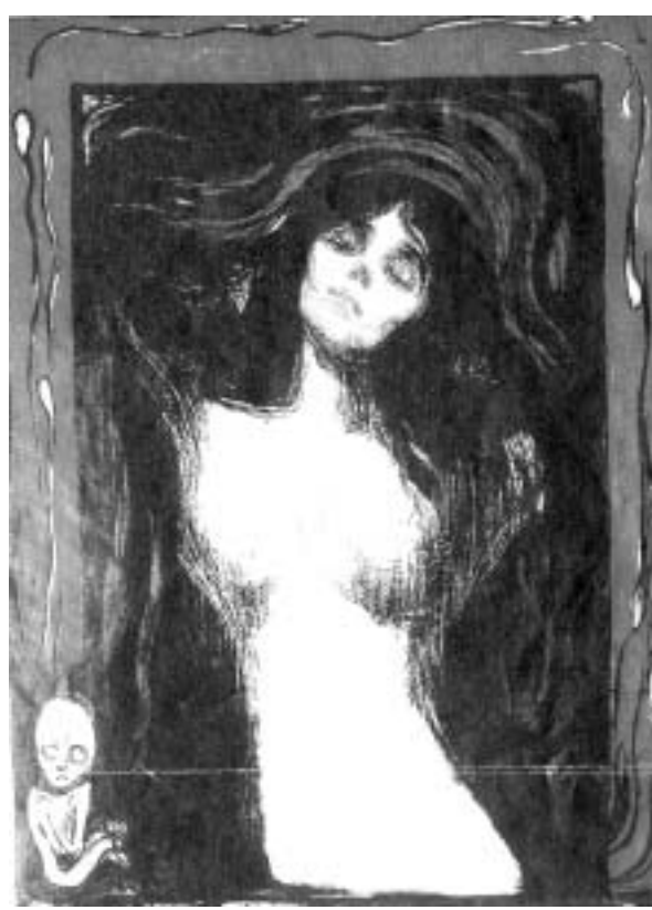
მუნკის ეს ნახატი მოიპოვეს.

„ტიფლისი ლისტოკის“ 25 მაისის ნომერში იუნველობდნენ: „მიხედავს, რომ დაგნი ოუელი-ფიზიკურად მოკლეს, რომლის ორგანიზატორი იყო კონსტანტინე ადამიანი (თბილისის სახელმწიფო უნივერსიტეტის მთავარი). მუნიციპალიტეტის ხელისუფლებამ ახალგაზრდა მომხიბვლელობა სანა-