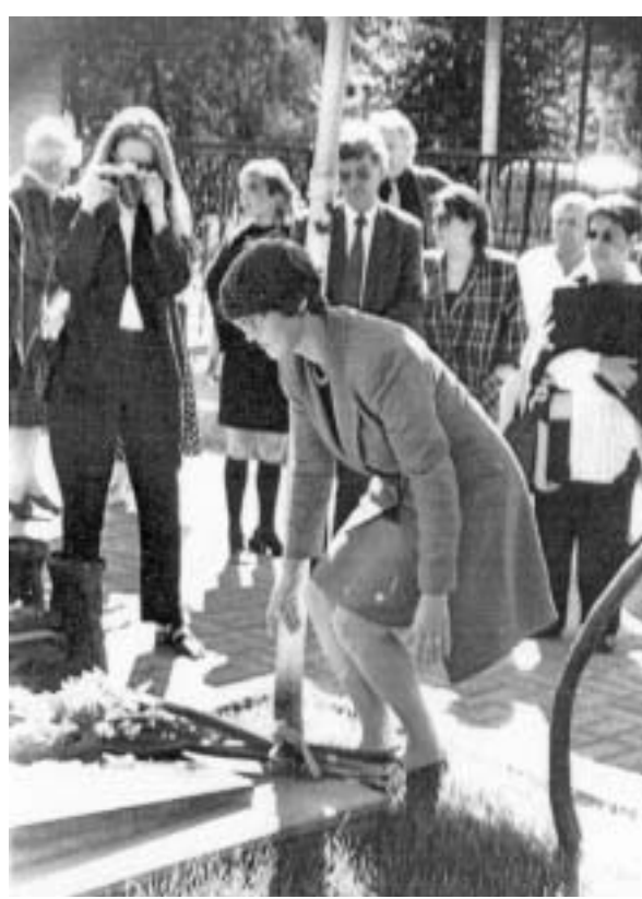
ნორვეგიელები ნახატის პროტოტიპის საფლავზე