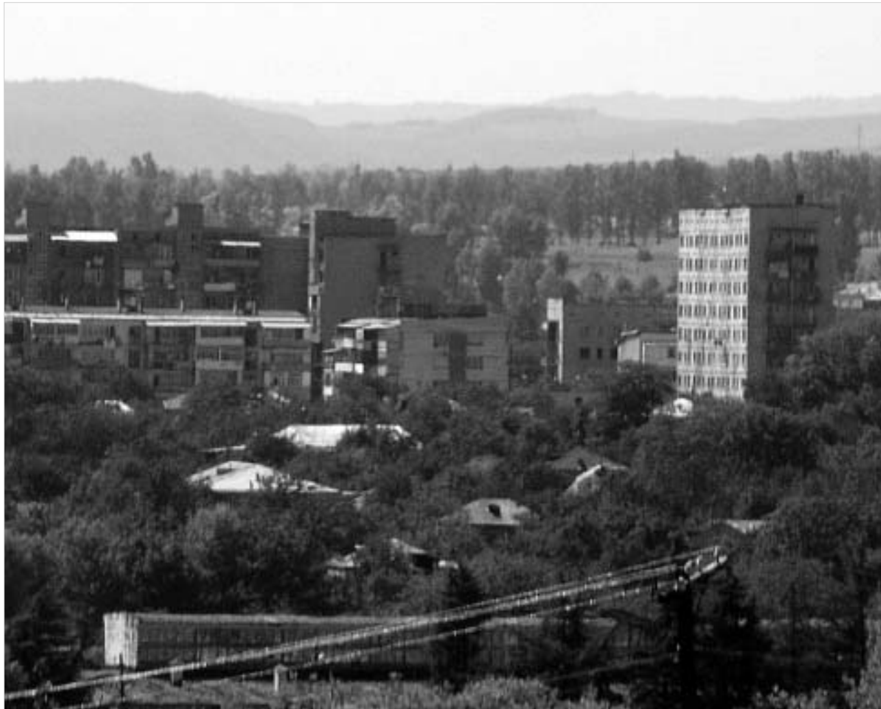
ნაცრისფერი, სევდიანი, ცარიელი და საბჭოთა სტილის სახლებით სავსე - ასე მოჩანს დღევანდელი ცხინვალის ქართველი ჟურნალისტის თვალით.